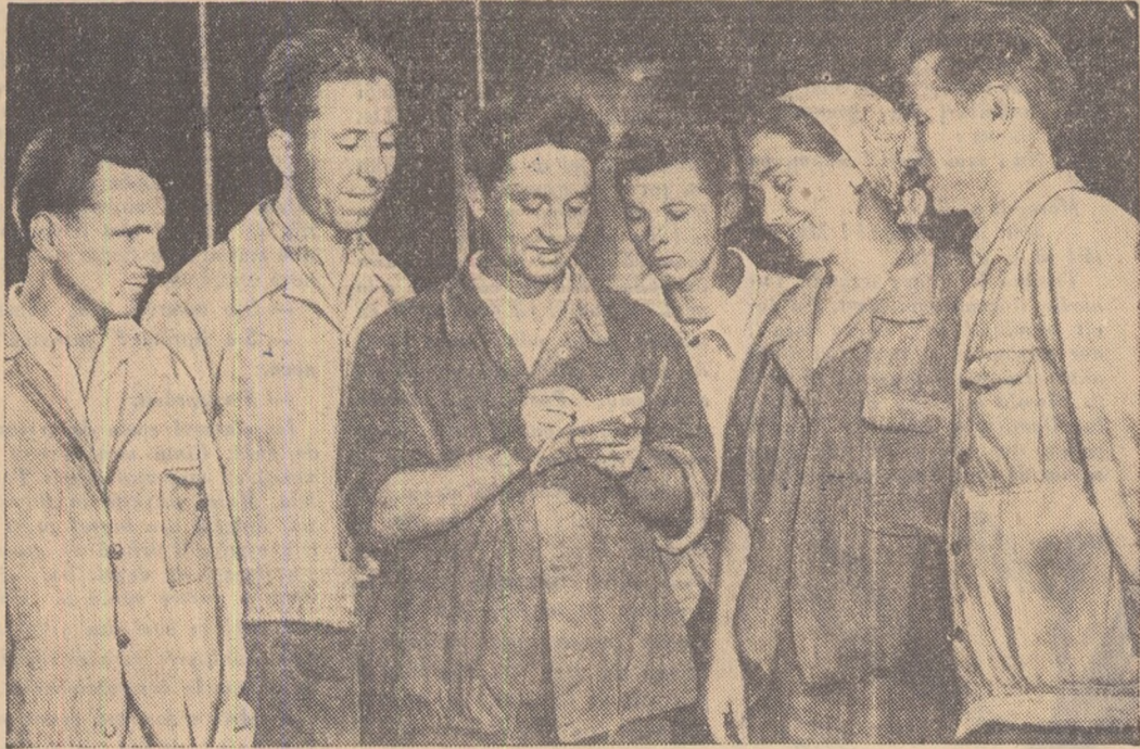
Acești tineri din brigada de șineret „16 Februarie” de la tipăria Atelierelor C.F.R. „Grivița Roșie” fac bilanțul rodnic al îndeplinirii angajamentelor în cinstea lui 23 August și a Festivalului. În cinstea mării sărbători a eliberării patriei ei își iau noi angajamente...

Azi perinița s-o dansezi În legănată ritm vienez, Dunărea duce n orice val Mii de lumini din Festival,