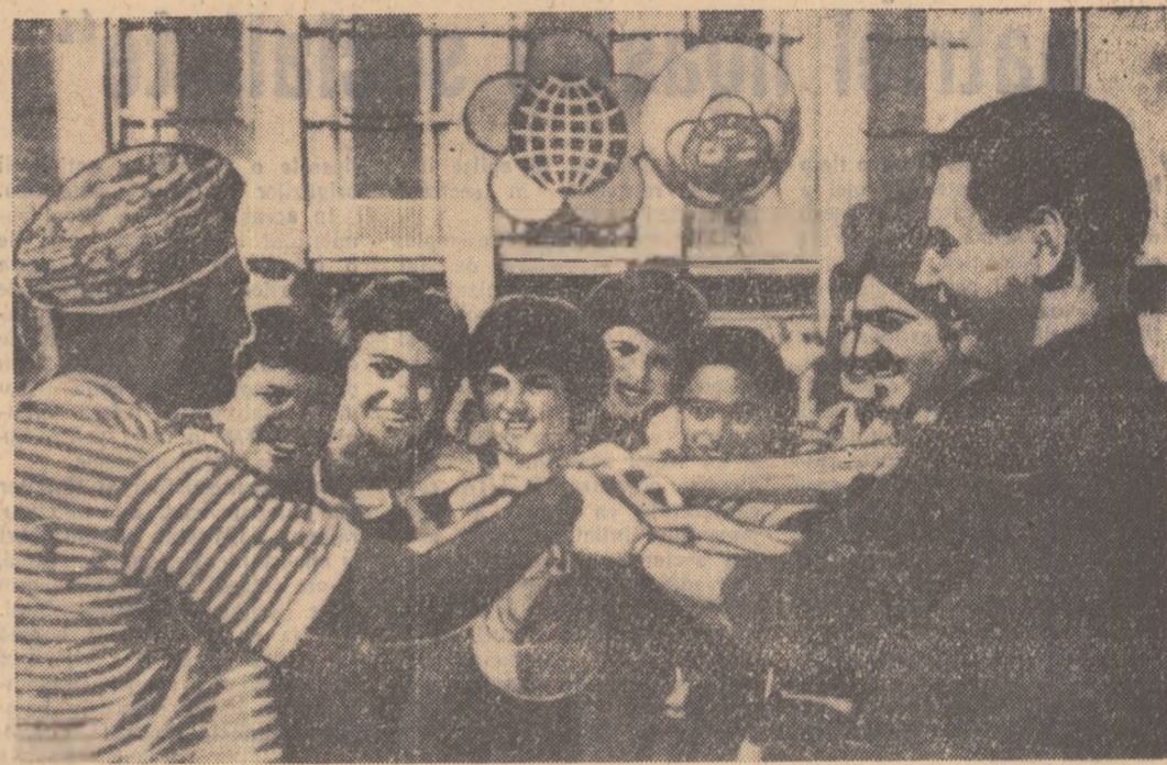
O întâlnire prietenească a tinerilor din diferite țări la Viena.