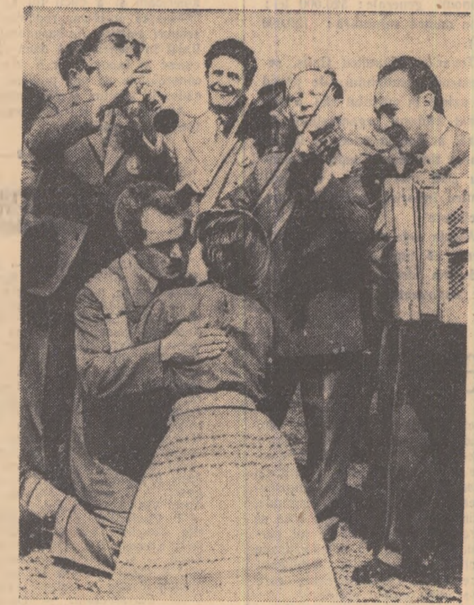
Și la Festivalul de la Viena „Perința” se bucură de succes.