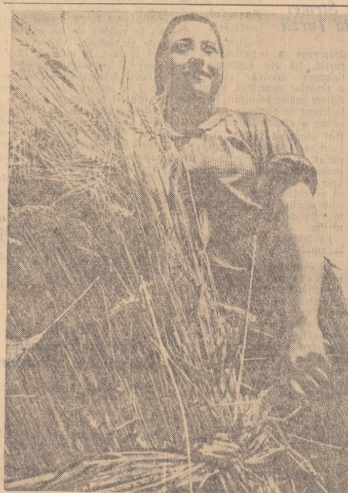
Bucurie pentru noua recoltă.