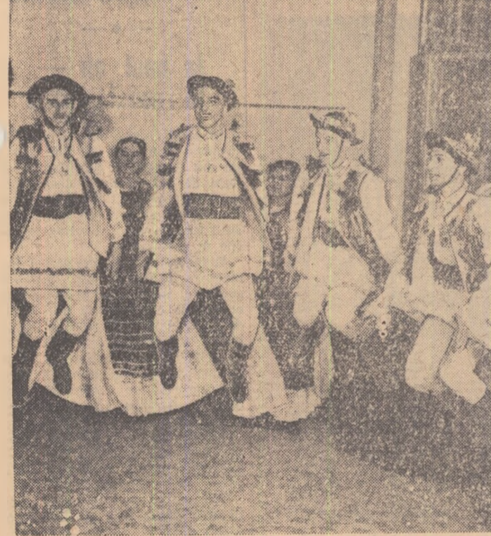
Echipa de dansuri a Combinatului siderurgic Hunedoara execută un dans din Făgăraș.