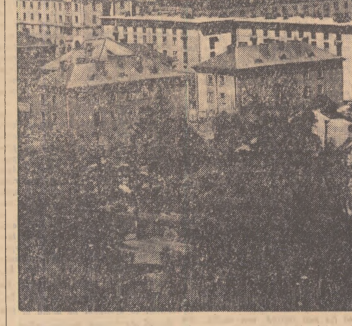
La Petrosani s-au construit recent 1.000 apartamente. In fotografie: unul din cartierele noi — „Gh. Dimitrov”

Membrii delegației noastre au avut două întâlniri prietenești cu membrii ai delegațiilor participante la Festival. Tinerii din Algeria, Maroc și Tunisia au vorbit delegațiilor noastre despre lupta lor pentru libertate și independență și au prietenește schimb de păreri s-a angajat, tinerii noștri asigurându-i pe oaspeții de toată solidaritatea și dragostea lor.