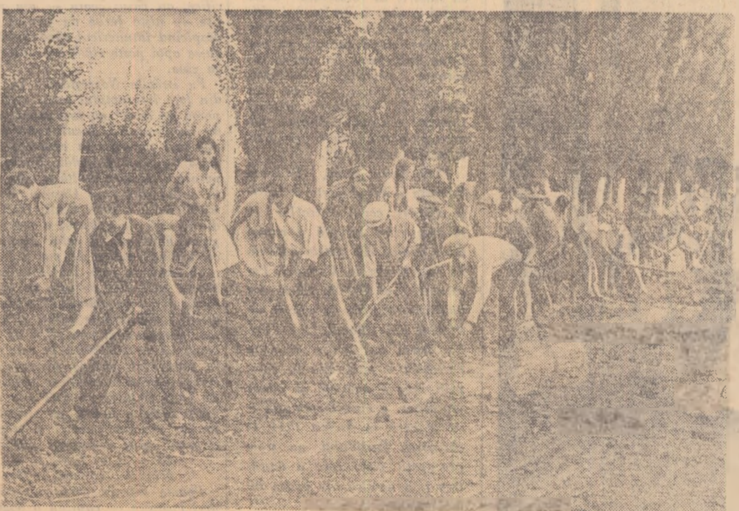
Peste 4.000 de ore de muncă voluntară au prestat tinerii din brigăzile de muncă patriotică ale G.A.S. Fabrica de vată și Fabrica de conserve din Bulea, laia-i în timpul lucrului.