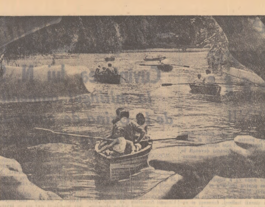
Pe șantiere, în Gișmigiu