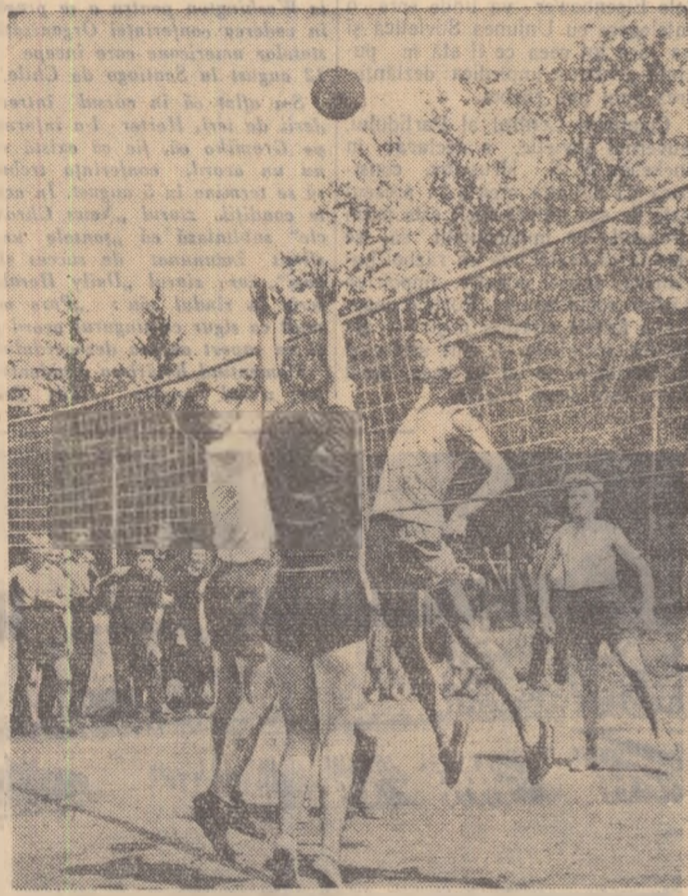
În tabăra elevilor de la Brănești, regiunea București, sportul a loc de cinste.