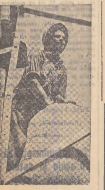
Pe aria tineretului din Sebeș, regiunea Hunedoara, treierăștii este în toi