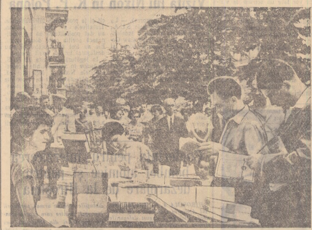
În librării sosesse mereu cărți noi. Chiar și trecătorii cei mai grăbiți se opresc în fața standurilor și-și aleg cartea preferată. Iată în fotografia noastră un aspect grător din fața unui stand de cărți de pe B-dul 6 Martie din Capitală.