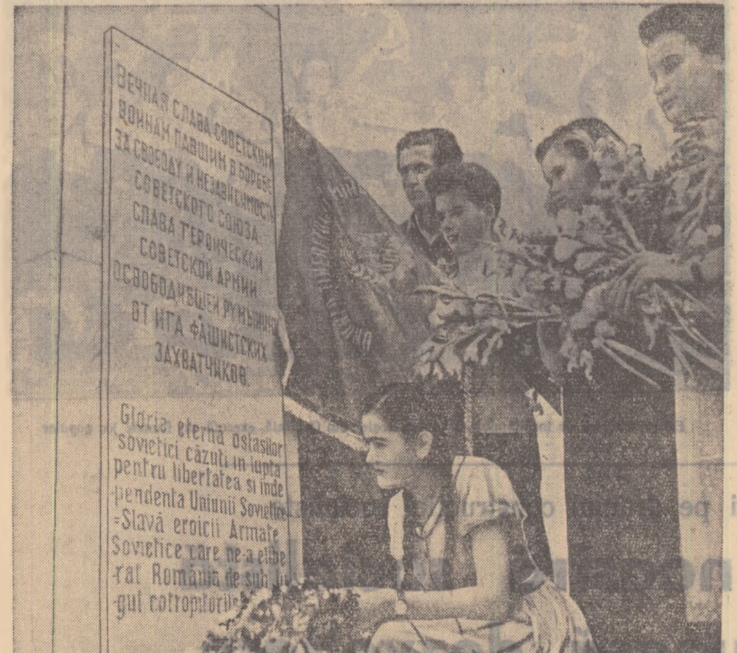
Utemistii și tinerii de la Întreprinderea „Ceramica” din Ploiești vin să depună la monumentul ostașilor sovietici căzuți pentru eliberarea patriei noastre florile nestinsei lor dragoste și recunoștințe.