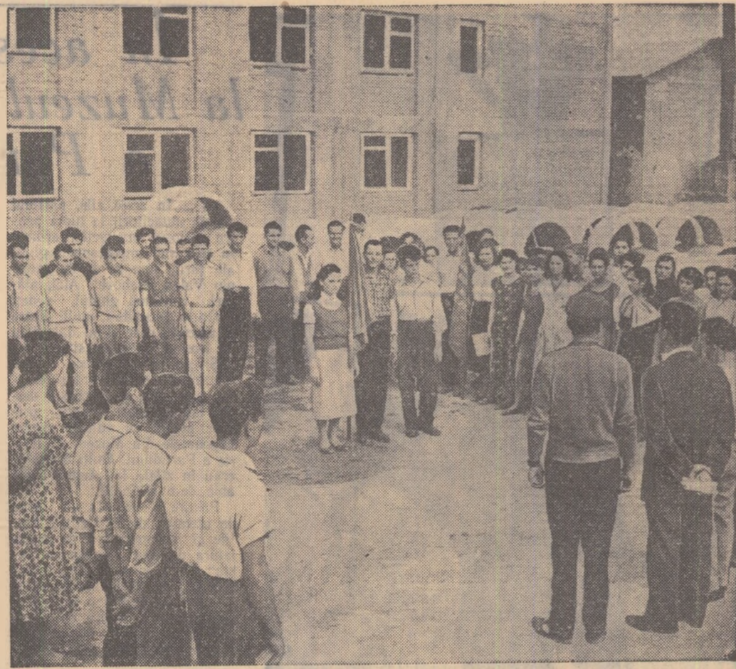
Un aspect de la careul festiv de înmănare a insignelor de brigadier al muncii patriotice tinerilor de la Uzinele „Republica”