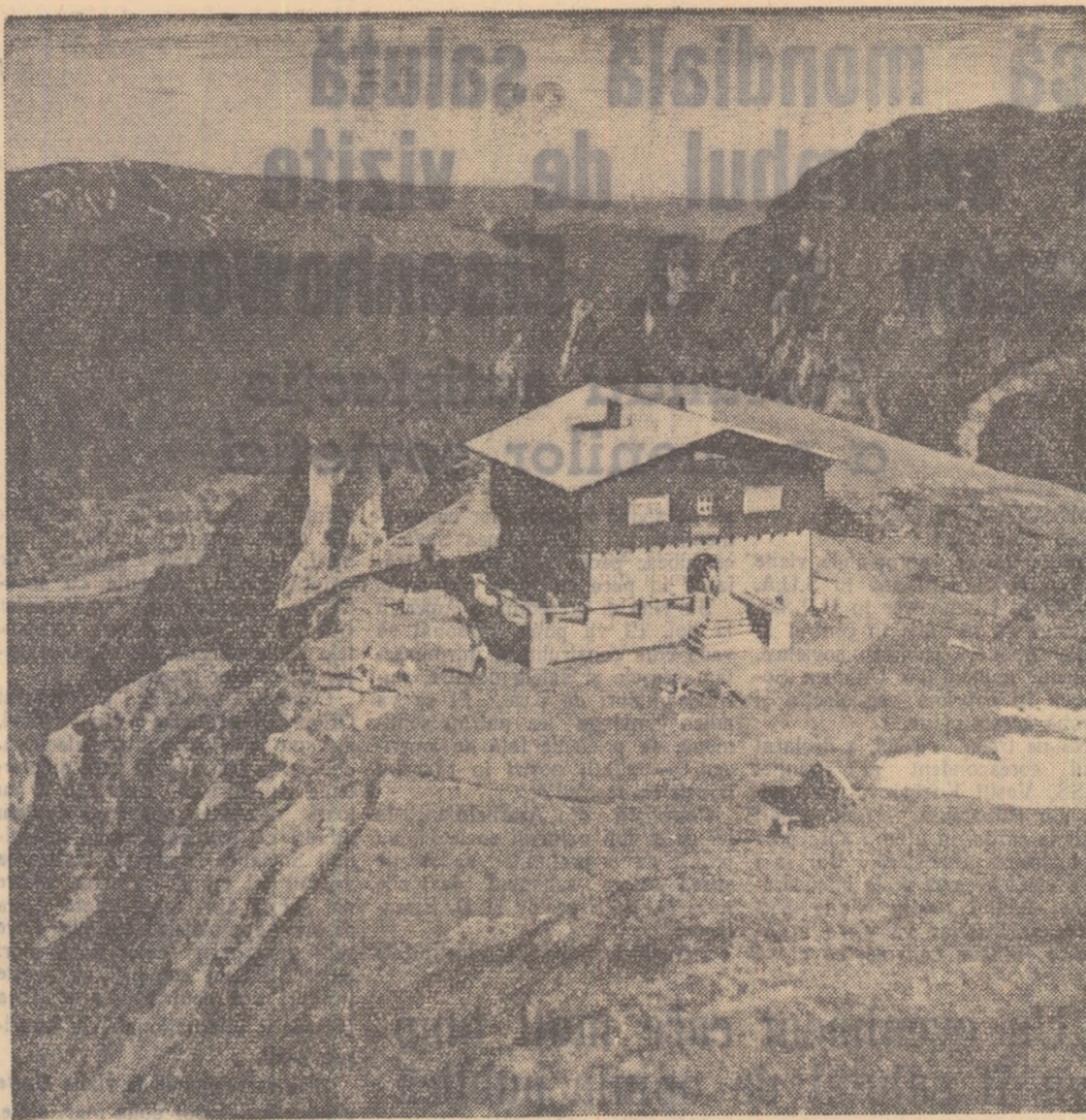
Cabana Caraiman din munții Bucegi.