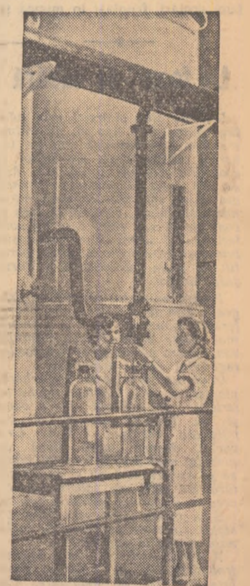
La Fabrica de zahăr Chițila a început campania de fabricare a zahărului din noua recoltă de sfeclă, cu 26 de zile mai înainte ca anul trecut.