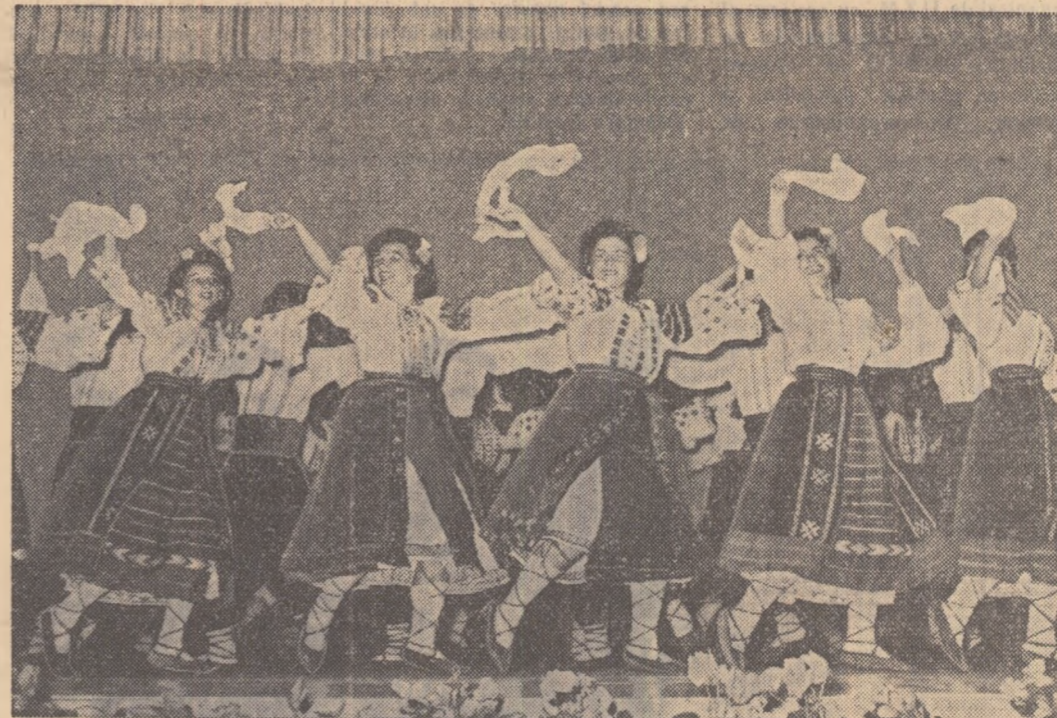
Echipa Fabricii de Încălțămînt „Pisăcra Roșie” din Capitală, execută un frumos joc popular

Majorările prevăzute se aplică începînd cu data de 1 August 1959 și nu afectează drepturile la alocația de stat pentru copii, taxe școlare, burse pentru elevii și studenții merituoși.