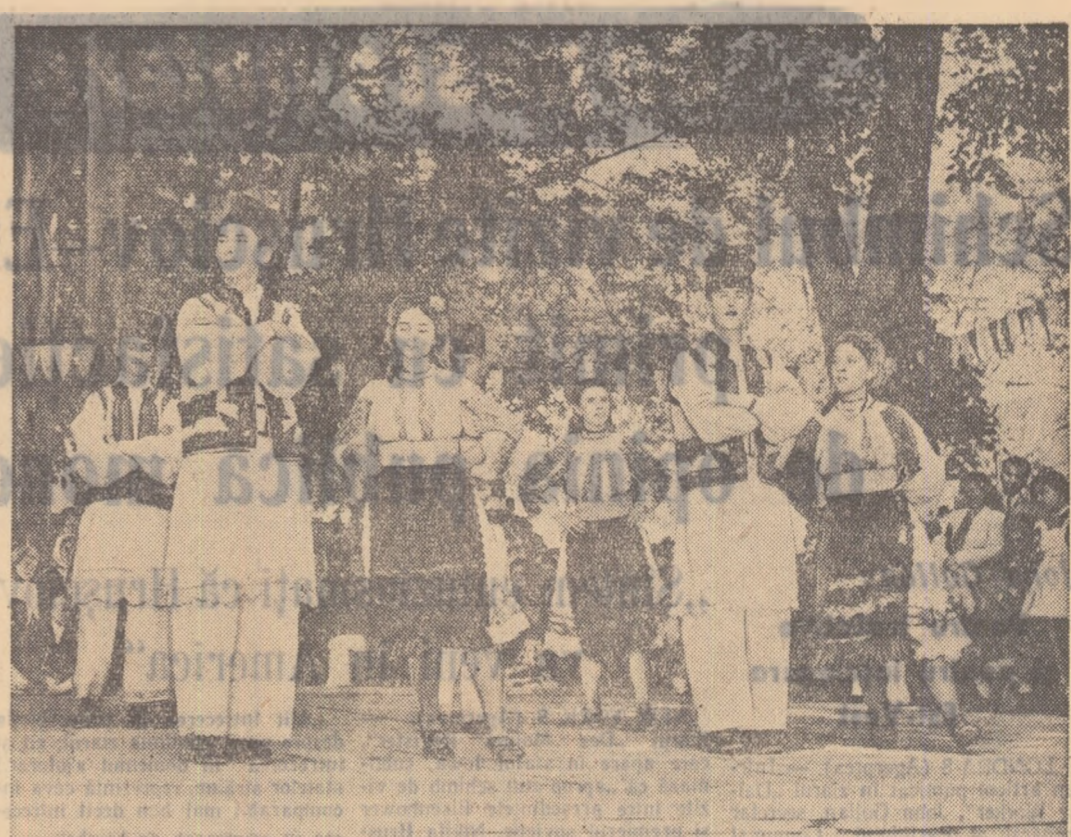
Echipe de dansuri din comuna Lugojel, regiunea Timișoara.

Prin înfăptuirea acestor reduceri de prețuri, împreună cu reducerea prețurilor la vinuri, țuică și rachuri naturale, populația va realiza o economie anuală de 1 miliard lei.