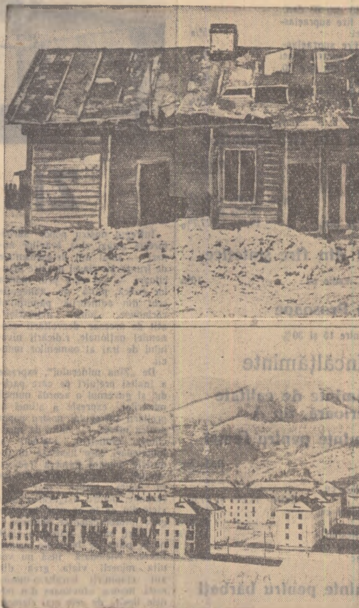
Două imagini grăitoare: cocioaba din fotografia de sus este una din fostele „locuințe” ale minerilor din Lonea. În ultimul deceniu Valea Jiului a devenit un imens șantier. La construcțiile ridicate se adaugă și ficare zi noi blocuri muncitorești, locuințe spațioase, sănătoase pentru harnicii mineri. Fotografia de jos este o imagine din noul oraș Urziceni.

„Lonea, Petriș, Petroșani, Livezeni, Aninoasa, Vulcan, Lu-