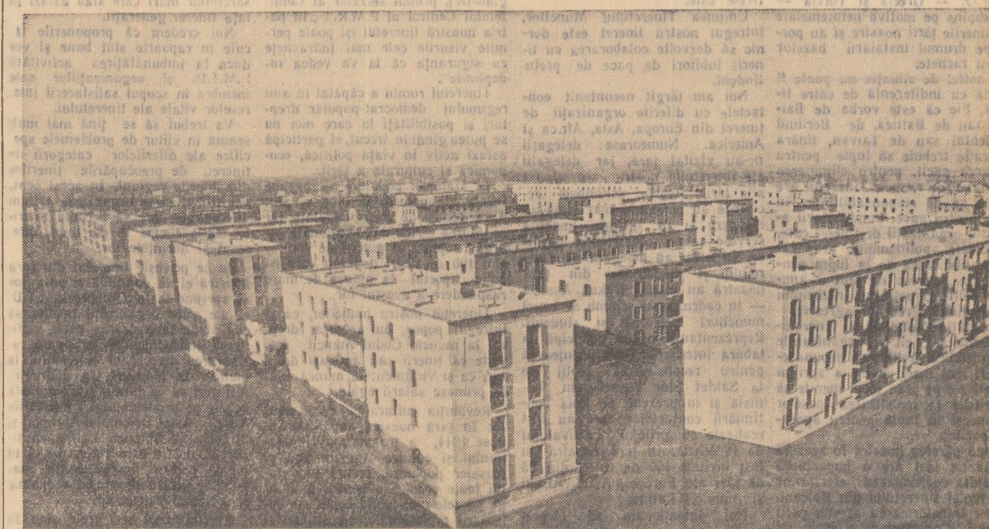
Unul din blocurile noi construite în cartierul Floreasca, București.