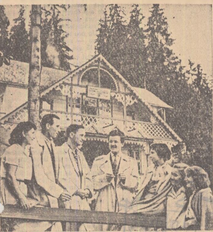
La odihnă în frumoasa stațiune Borsele