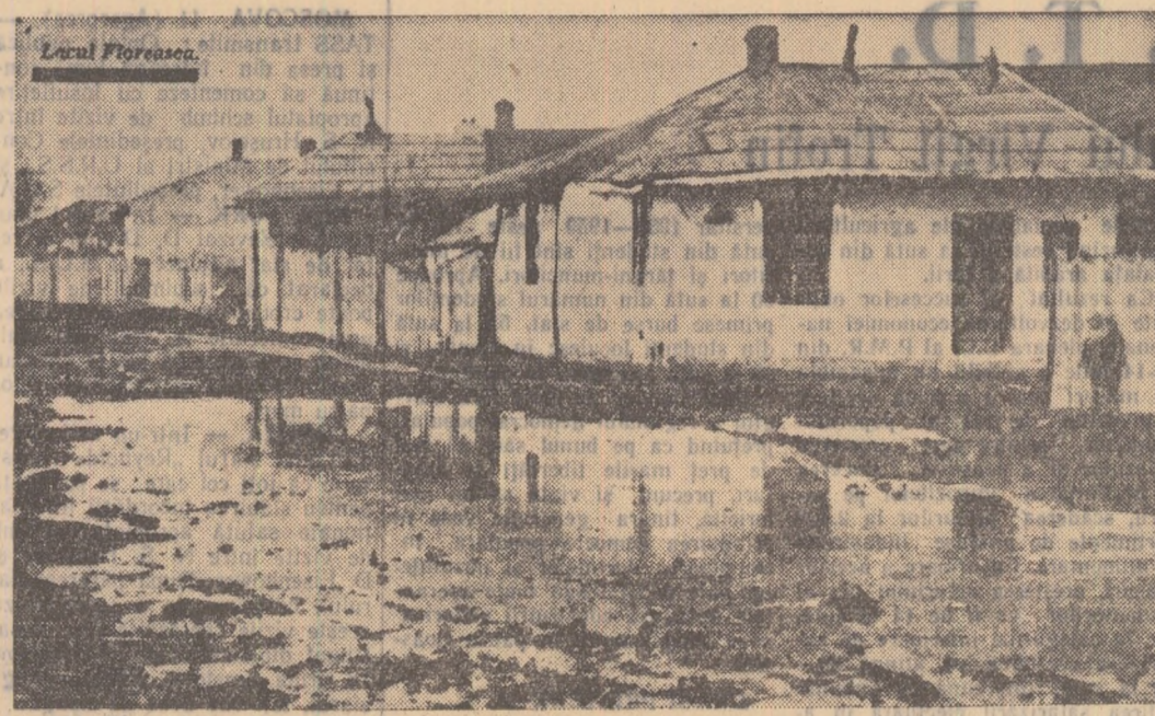
Local Floreasca, construit în anul 1936, cartierul Floreasca din București.

În anul 1936, cartierul Floreasca nu e un cartier ci o imensă groapă veșnic înmădă, mîndind de geneaie și molime... Cele mai multe dintre casele de aici amintesc de așezările triburilor africane. Chiar și locuințele mai răsărite sînt dărăpănate. Reporterul burghez și-a ilustrat reportajul cu fotografia una dintre „locuințele mai răsărite” (pe care o reproducem sus).