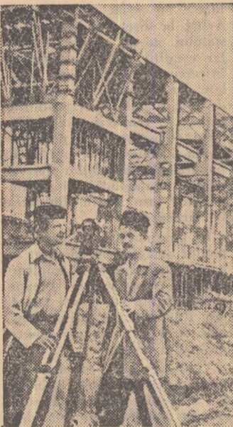
Constructorii de pe Șantierul combinatului de cauciuc sintetic din Borzești, regiunea Bacău, depun eforturi pentru a termina lucrările combinatului înainte de termen. Iată în fotografie un aspect de pe șantier

AVRAM BUNACIU Ministrul Afacerilor Externe al Republicii Populare Romine