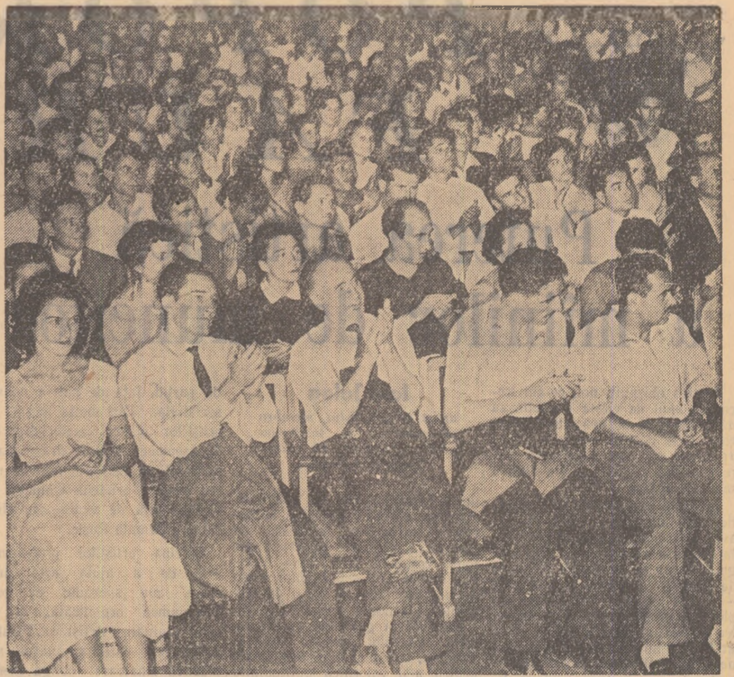
Un aspect din timpul întîlnirii