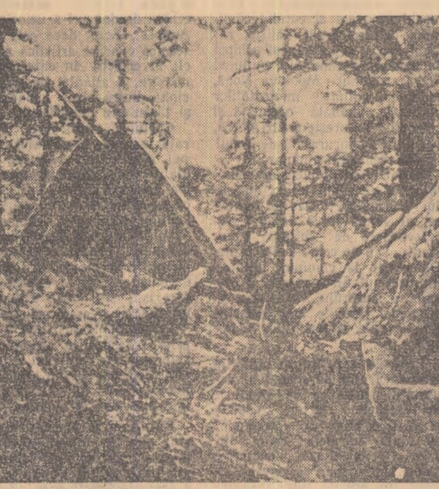
Cortul grupului de partizani „Carpați” care a acționat în Valea Prahovei

Insurecția armată de la 23 August 1944 a însemnat o cotitură radicală în istoria poporului nostru. Pregătită, organizată și condusă de Partidul Comunist Român, insurecția a avut ca rezultat răsturnarea dictaturii militar-fasciste, scoaterea țării din războiul criminal antisovietic și întoarcerea armelor împotriva Germaniei hitleriste. Ea a însemnat începutul revoluției populare, care a dus la instaurarea regimului democratic-popular, cea mai mare câștigătoare a maselor populare din țara noastră. 23 August este pentru poporul român — grăta tovarășul Gh. Gheorghiu-Dej — cea mai mare sărbătoare națională, deoarece ea a însemnat cotitura spre o schimbare radicală în viața de regimul burghez-moșieresc de aspirare și exploatare sălbatică a maselor muncitoare, de înfrângere politică și economică a țării de către puterile imperialiste, la regimul democratic-popular, în care poporul eliberat și-a luat soarta în propriile mâini și a devenit singurul și adevăratul stăpîn al țării.