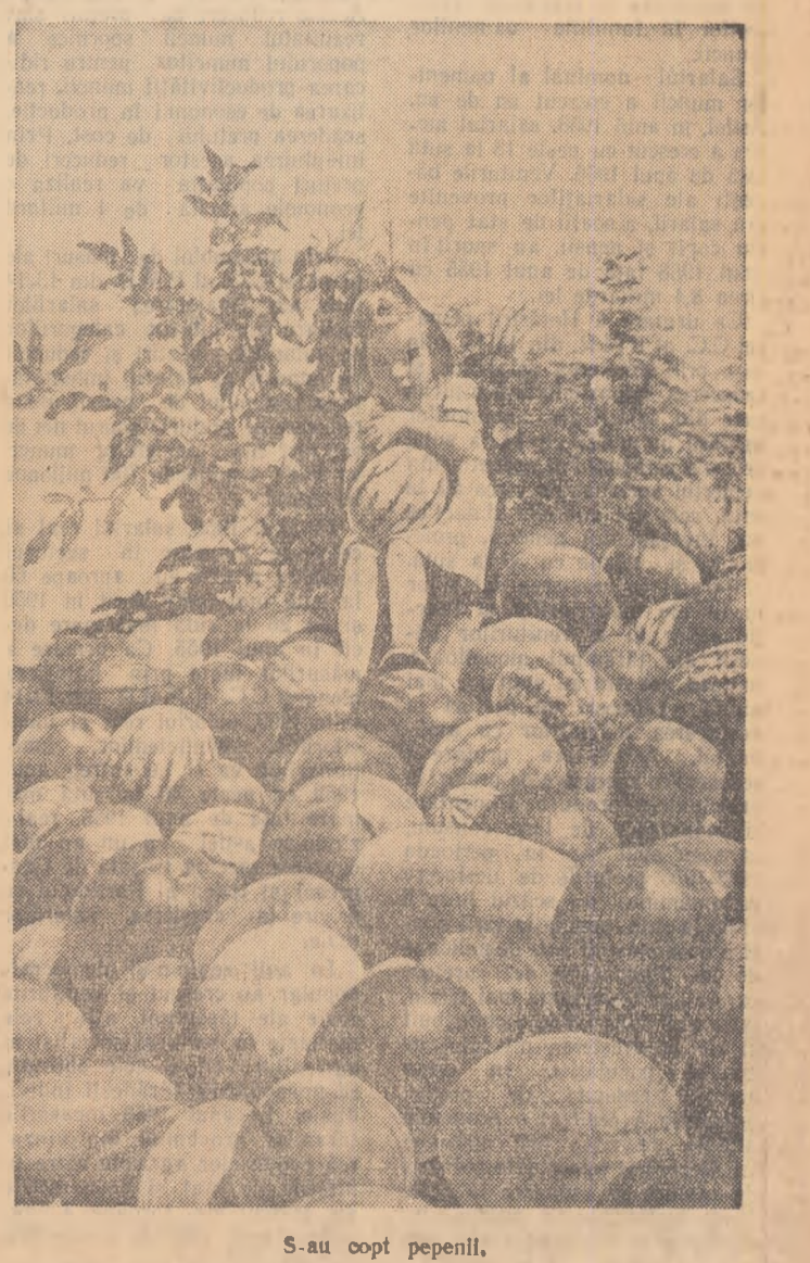
S-au coapt pepenii.

Înscrierile se fac între 15—29 august 1959, iar examenul se ține la 30 august 1959. Informații la telefon 15.65.96 între 9—12.