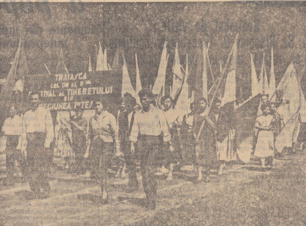
Aspect de la deschiderea celui de-al II-lea Festival al tineretului din regiunea Pitești.