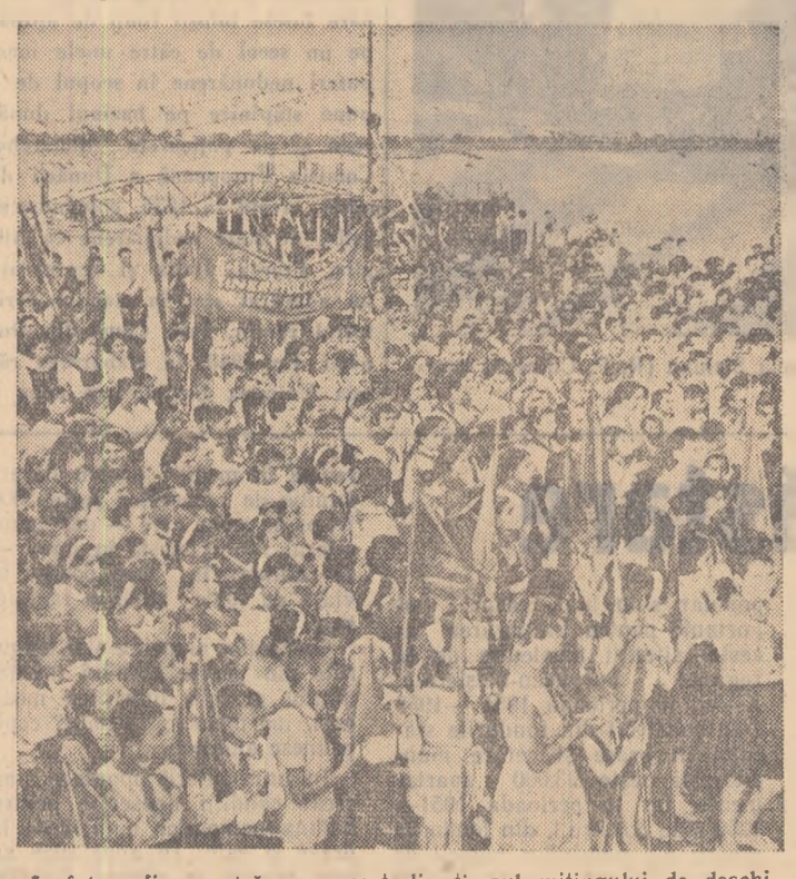
În fotografia noastră, un aspect din timpul mitingului de deschidere a Festivalului tineretului din orașul Galați.