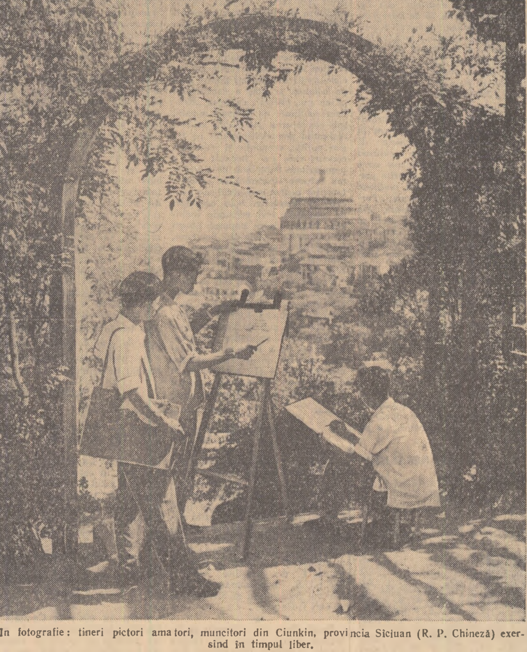
In fotografie: tineri pictori amatori, muncitorii din Ciunkin, provincia Sicuan (R. P. Chineză) exercînd în timpul liber.

Totodată, contrar dorinței delegației americane, conferința a adoptat o rezoluție cu privire la reducerea cheltuielilor militare, cu privire la colaborarea economică, respectarea drepturilor omului și altele.