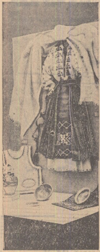
Ieri, s-a deschis în sala „Dalles” din Capitală expoziția biennială de artă populară a creatorilor amatori, omagiu artistic închinat luminoșului 23 August.

In fotografie: Unul din frumoasele obiecte expuse.