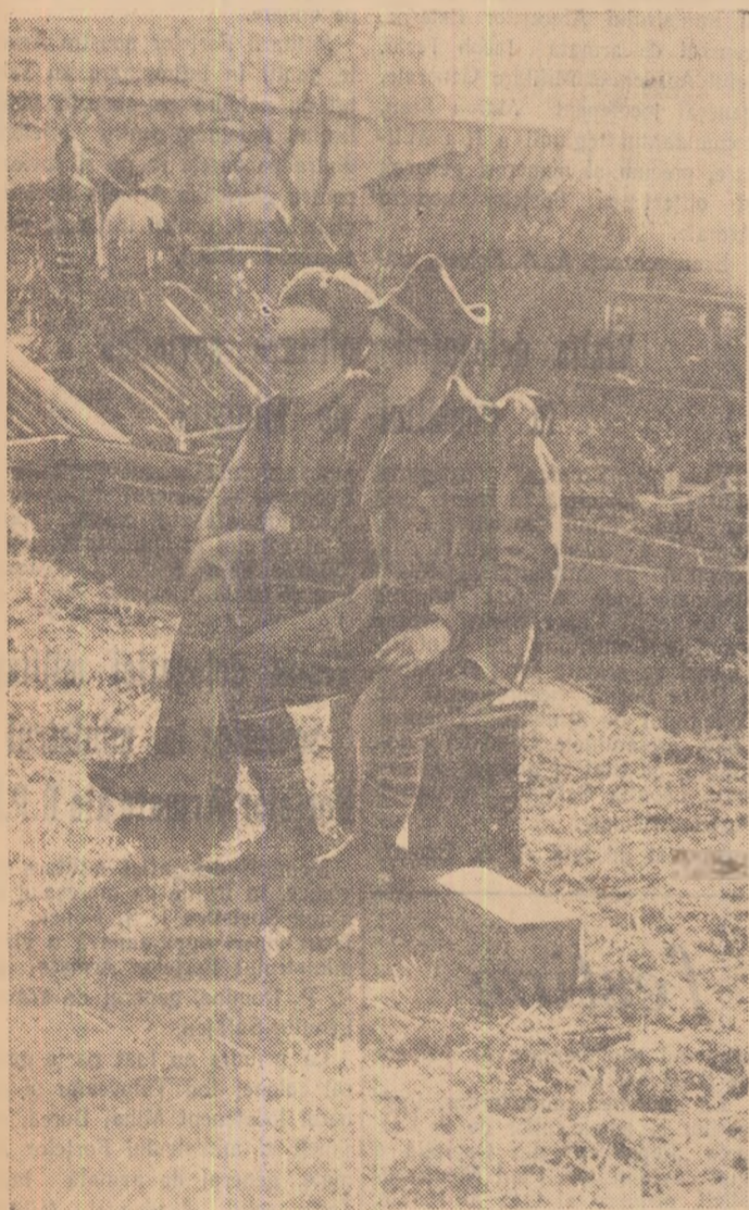
O clipă de răgaz pe front. După ce au luptat împreună și au respins un atac al fasciștilor, ostașul român și cel sovietic s-au așezat la vorbă. Și, avînd ocazia, s-au gîndit că n-ar fi rău să facă și „o poză”, ca amintire.