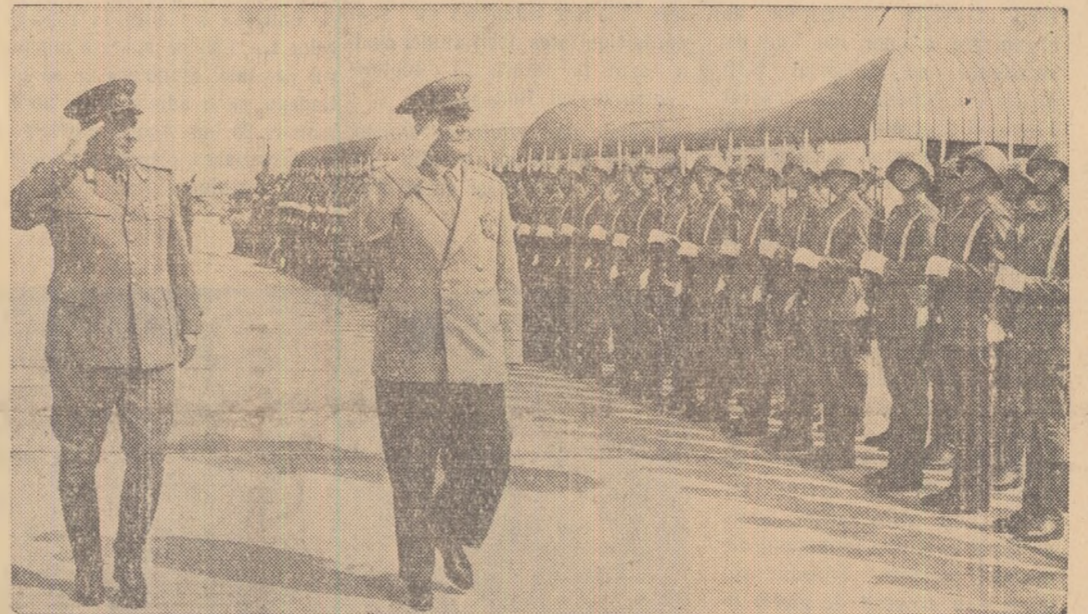
Mareșalul I. S. Konev, însoțit de generalul de armată Leontin Sălăjan, trec în revistă garda de onoare.