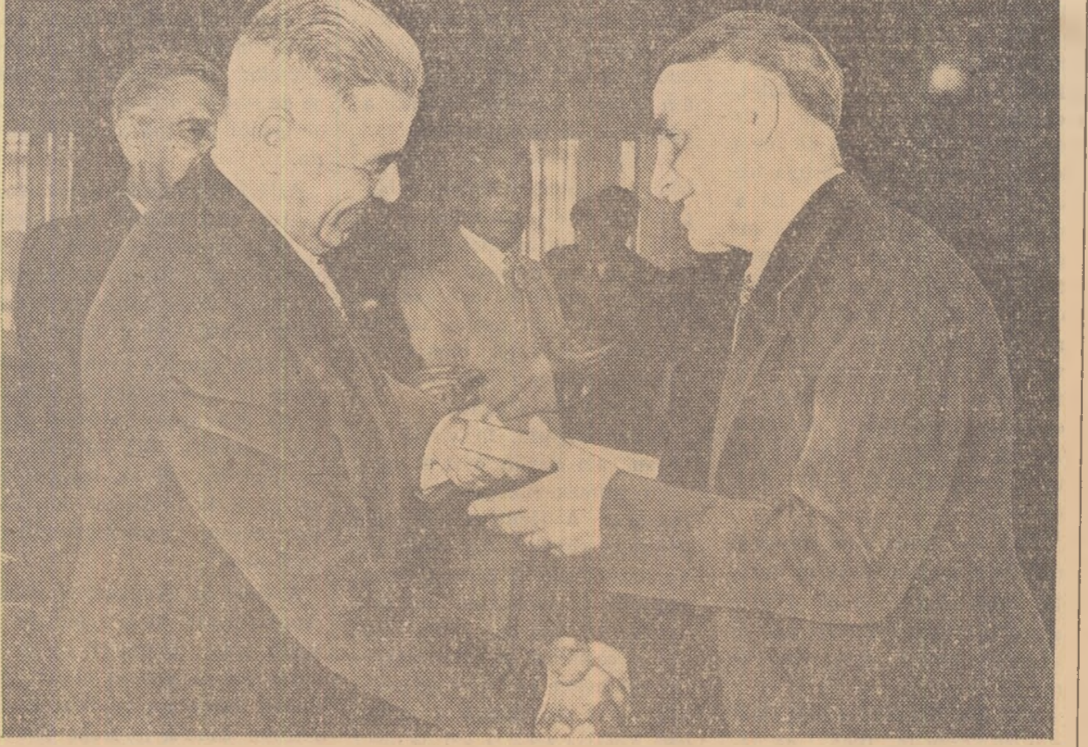
Tovarășul Ion Gheorghe Maurer, înmînînd tov. Acad. Iorgu Iordan decorația ce i-a fost conferită.