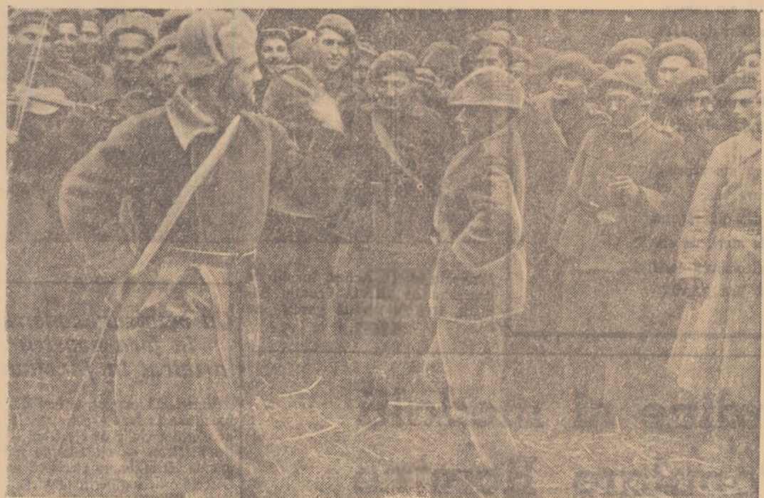
Ostași sovietici și romini în momentele de odihnă, manifestîndu-și bucuria după eliberarea ultimei localități rominești — Carei Mari.