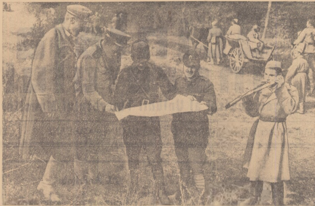
Militari sovietici și romini studiind o hartă înaintea unei operațiuni în Transilvania de Nord.

În bătălia pentru eliberarea Budapestei, Corpul 7 armată român după ce a străbătut prin lupte, împreună cu numeroase mari unități ale Frontului 2 ucrainean, peste 100 km. pînă la prima centură de fortificații a Budapestei, a participat alături de unitățile sovietice la ruperea celor trei fșii de apărare din jurul capitalei maghiare ce se întindeau pe o adîncime de aproximativ 25 km. Apoi a participat la dezvoltarea ofensivei în interiorul orașului.