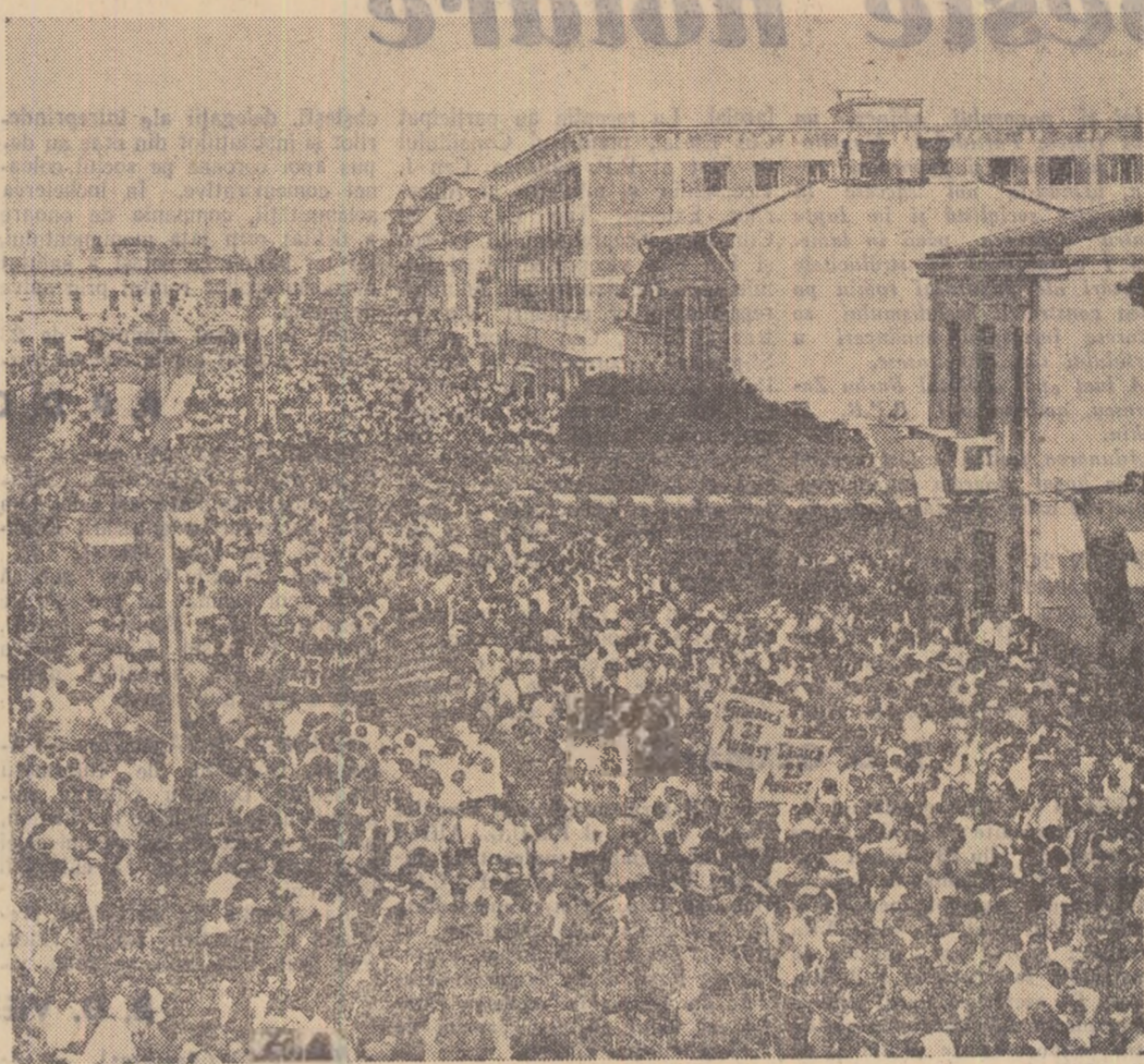
Numeroși oameni ai muncii din Bacău au manifestat pe străzile orașului.