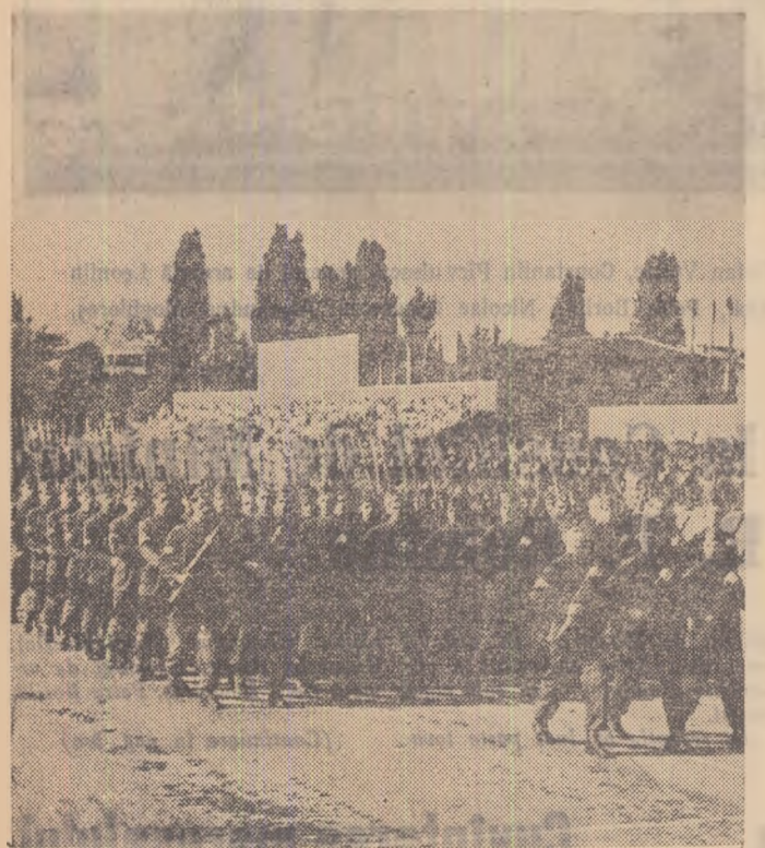
În pas cadențat cu frunța sus trec gîrzile muncitorești.

— Și acum unde e ea? — Cu noi e numai portretul ei. Ea se află, ca invitată, la tribună.