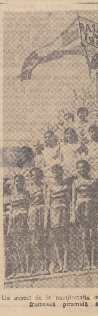
Un aspect de la manifestația oamenilor muncii din București.

Urmează apoi defilarea pionierilor, după care începe grandioasa demonstrație a oamenilor muncii din Capitală.