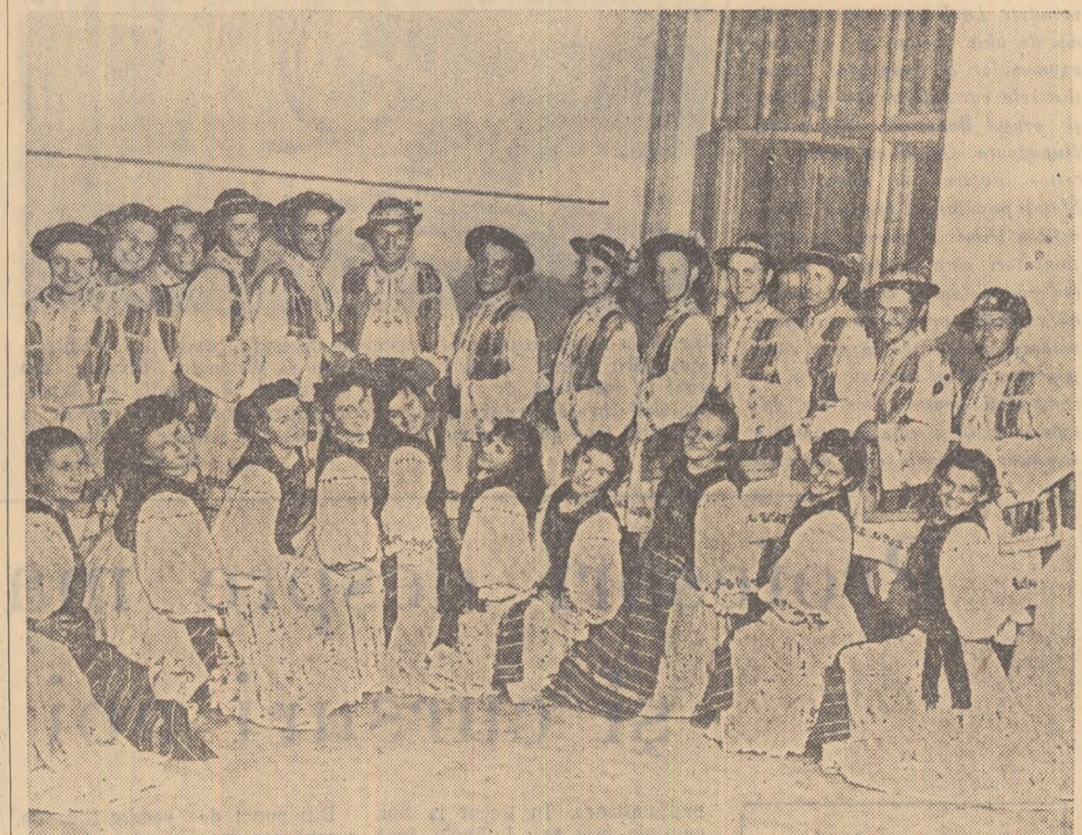
Echipa de jocuri populare a Combinatului siderurgic Hunedoara.