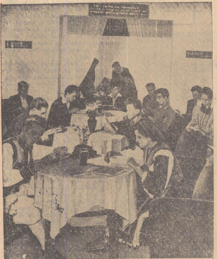
La clubul „Nicolae Bălcescu” al întreprinderii miniere de fier Ghelar.