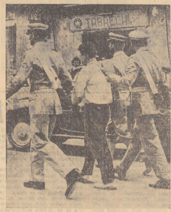
Acum ceva timp, au avut loc în Italia largi mișcări greviste. Numeroase categorii de salariați au manifestat pentru mărșare, salarilor și încheierea de noi contracte de muncă. Poliția italiană a intervenit cu brutalitate. În fotografie: un tânăr muncitor agricol din Marigliano (Lingua Neapole) în momentul arestării.

tele supuse spre examinare conferinței. Participanții la tratative au căzut de acord să suspende lucrările conferinței între 27 august și 12 octombrie a.c. ULAN-BATOR. — Primalul ministru al Indiei, Jawaharlal Nehru, a invitat pe președintele Consiliului de Miniștri al Republicii Populare Mongole, I. Tedenbal, să viziteze India la data care îi va conveni în septembrie a.c. După cum anunță agenția Montame, I. Tedenbal a primit invitația și s-a dus la Delhi la 10 septembrie. DELHI. — Harish Chandra, conducătorul delegației indiene la cel de-al VII-lea Festival Mondial al Tineretului și Studenților din Viena, a declarat la înapoierea la Delhi că delegații indieni și Ceylonului li s-a propus să organizeze în septembrie 1960 primul festival al tineretului din Asia. Comitetul de pregătire, a spus el, va examina problemele în legăt-