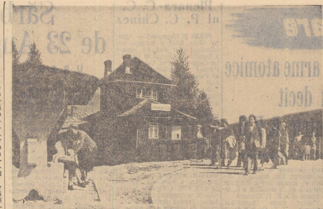
Oameni ai muncii sosiți la odihnă în stațiunea Predela

Încapăținându-se să nu înțeleagă acest lucru, Vlaicu rămîne din ce în ce mai singur. Treptat, prietenii și chiar feciorii săi înțeleg că eliberarea din carapacea meschină, închisă de veacuri pentru ei, a concepțiilor cărora le este sclav tatăl lor, este posibilă numai în gospodărie colectivă, care deschide oamenilor, prin noile relații de producție, prin condițiile de lucru și de viață ce le creează, noi și mari perspective. Mitru, aflînd de viclenia tatălui său, va intra conștient și hotărît în gospodărie. Andrei, după un proces frîmțat de conștiință, va ajunge la aceeași concluzie, părăsindu-și și el tatăl. Iar Tudor care, pînă la urmă a moștenit din toată averea unchiului, un coșec și doi cai, nu mai vrea să reînceapă o viață de slugă în casa părintească; el se va