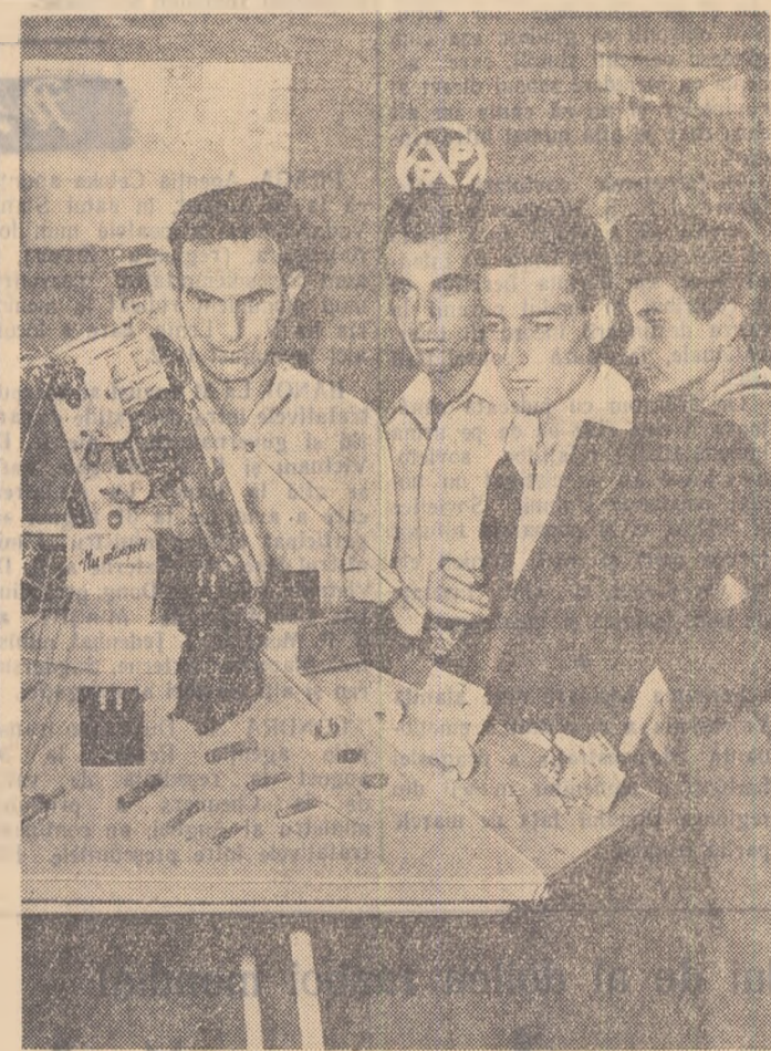
Imaginea noastră vă prezintă un colț al expoziției închinată împlinirii a 10 ani de la fabricarea primului aparat de radio în țara noastră, deschisă de curînd în Capitală.

lip Geltz, membru al Prezidiului Marii Adunări Naționale a înmînat consiliului de conducere al gospodăriei Ordinul Muncii clasa I-a. La festivitatea au luat parte reprezentanții ai organelor de partid și de stat, numeroși colectiviști, mecanizatori, tehnicieni și ingineri agronomi. Într-o atmosferă entuziastă colectiviștii au aprobat în unanimitate trimiterile unei telegramme de mulțumire Comitetului Central al P.M.R., Consiliului de Miniștri și Prezidiului Marii Adunări Naționale. Cu același prilej, colectiviștii din Lenaueheim au sărbătorit împlinirea a 10 ani de la înființarea gospodăriei lor.