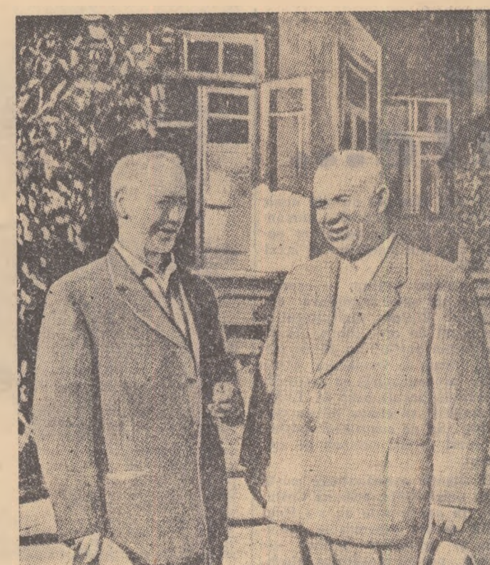
N. S. Hrușciov în vizită la scriitorul M. A. Șolohov în stația Veșenskaia

Faptul că popoarele din unele țări capitaliste au fost în stare să exercite influența asupra caracterului războiului la care participau guvernele lor, reflectă schimbările de importanță istorico-comercială petrecute în raportul forțelor sociale în perioada de după Revoluția din Octombrie, constituindu o dovadă a rolului crescînd al popoarelor în viața societății. Intrarea Uniunii Sovietice în război a desăvîșit procesul de transformare a celui de-al doilea război mondial într-un război just de eliberare împotriva fascismului. Succesele Uniunii Sovietice au inspirat forțe noi și au înfrînt încrederea tuturor popoarelor care luptau împotriva