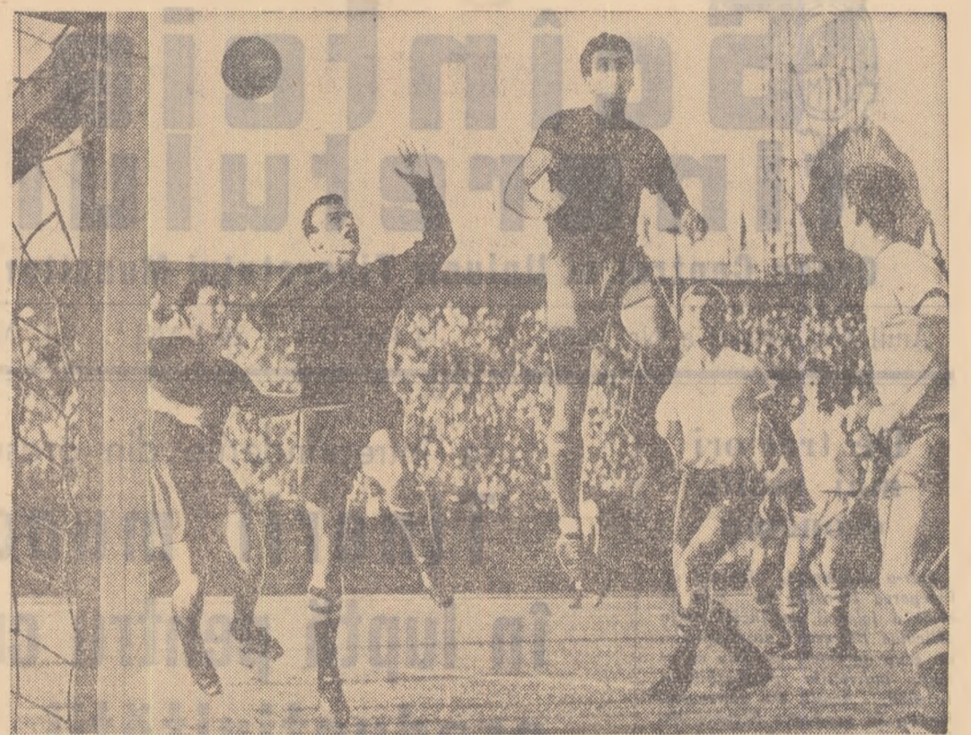
Așa s-a marcat unul din golurile printro-o acțiune pornită din cotul terenului, mingea interceptată de unul dintre înalțiișii reprezentativei secunde a țării noastre, va intra în plasă, cu toată intervenția portarului.