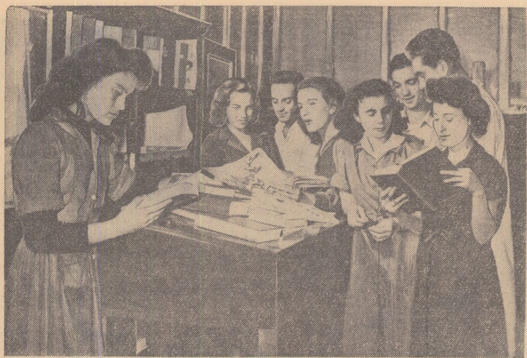
La standul de cărți de la Uzinele „Grigore Preoteasa” din București vin numeroși tineri pentru a-și cumpăra noi cărți