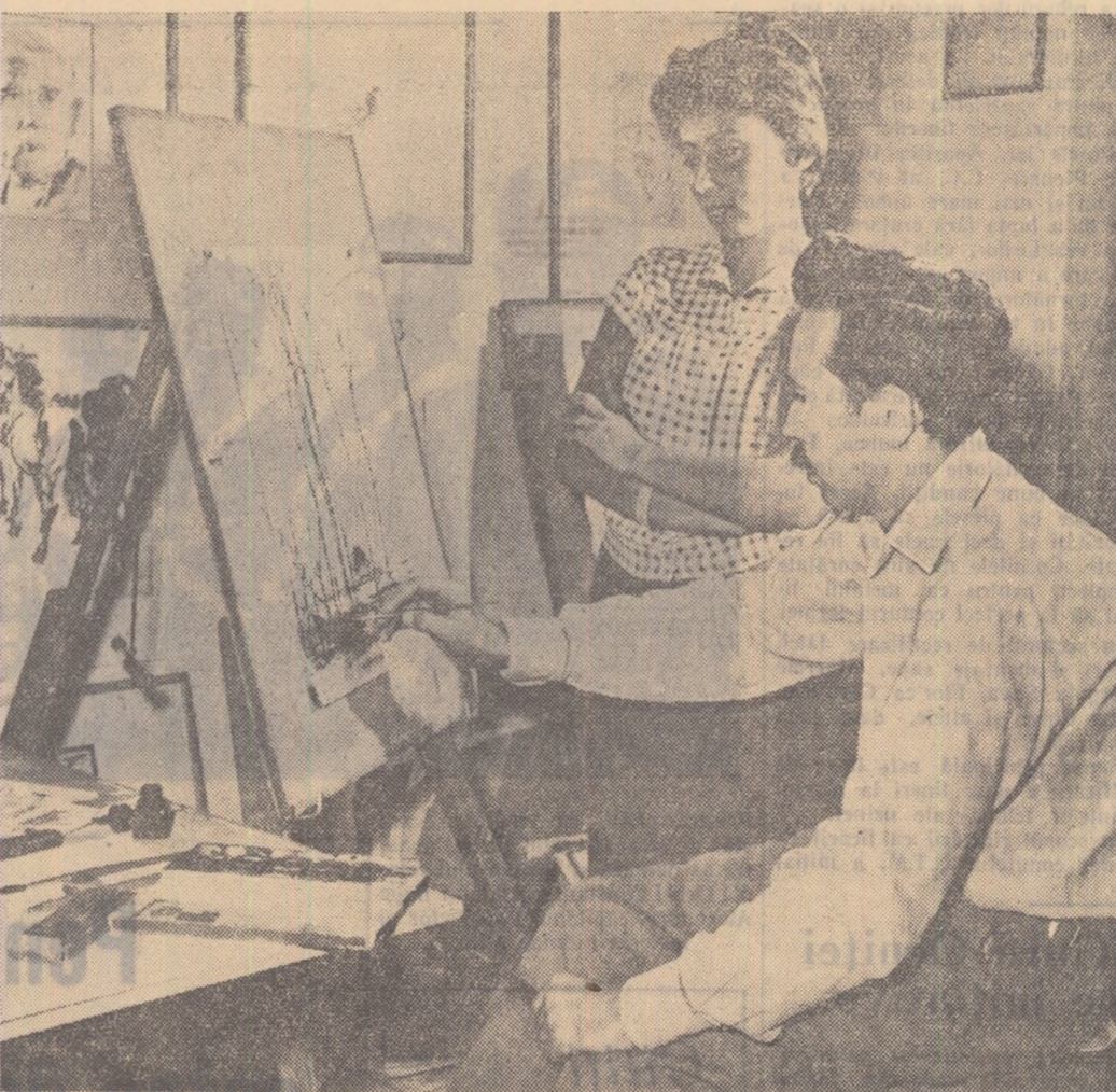
Un aspect din activitatea cercului plastic de pe lângă Casa de creație Nr. 1 din Găpîlnă.