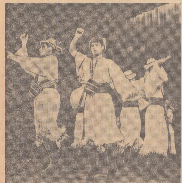
Formația de dansuri a Trustului regional de construcții — T.R.C.L.R.—Deva, executînd un dans din Oaș.