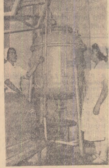
Iată un aspect din laboratoarele Fabricii de medicamente „Galenică” din București

GELLU NAUM: Cartea cu Apolodor. Ilustrații de I. Perahim, 48 pag. — 6 lei; cart. 12 lei. Ed. Tineretului.