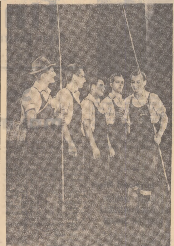
Moment dintr-un spectacol al brigăzii artistice de agitație de la Fabrica de sticlă din Turda.