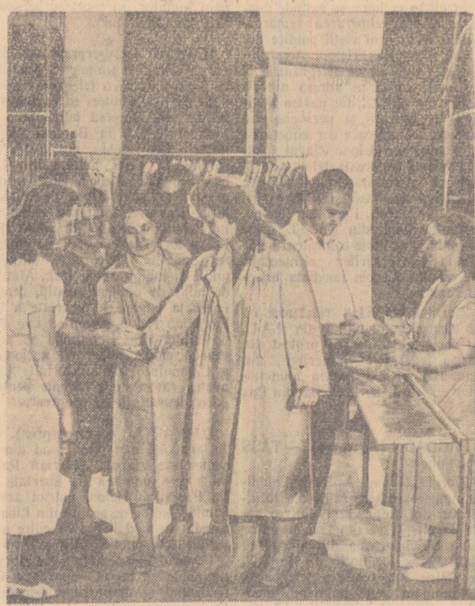
La magazinul de confecții „Ele gant” din B-dul N. Bălcescu au sosit noi sortimente.