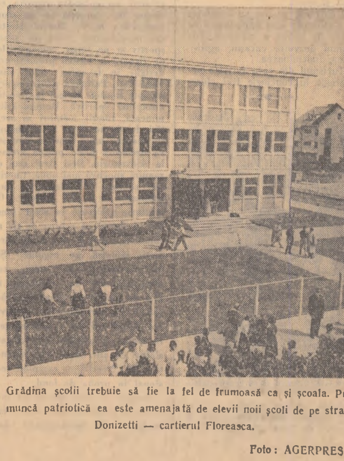
Grădina școlii trebuie să fie la fel de frumoasă ca și școala. Prin muncă patriotică ea este amenajată de elevii noii școli de pe strada Donizetti — cartierul Floreasca.