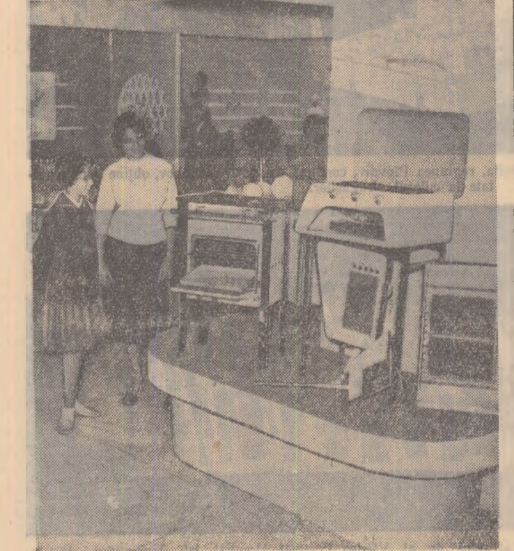
Aspect de la expoziția de produse industriale organizată de întreprinderea „Feronon” din Buda