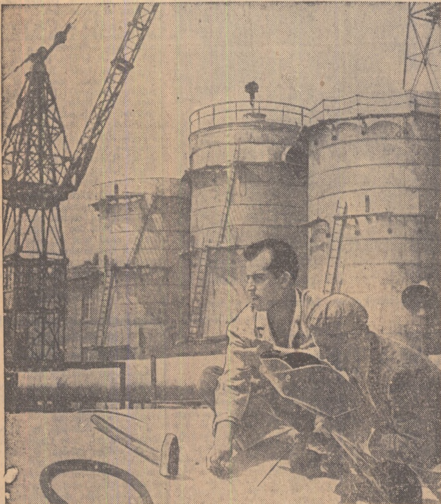
Tineri fruntași în muncă de la combinatul „Stalin” din Dimitrograd.

Tineretul bulgar împlinind cu noi succese în muncă cea de-a 15-a aniversare a eliberării patriei sale de sub jugul fascist. Iată în fotografiile noastre cîteva aspecte din munca și viața tineretului bulgar: