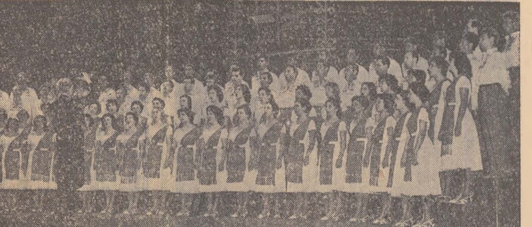
Corul academic din Sofia, laureat al celui de al VII-lea Festival Mondial al Tineretului de la Viena, interpretînd un cîntec.