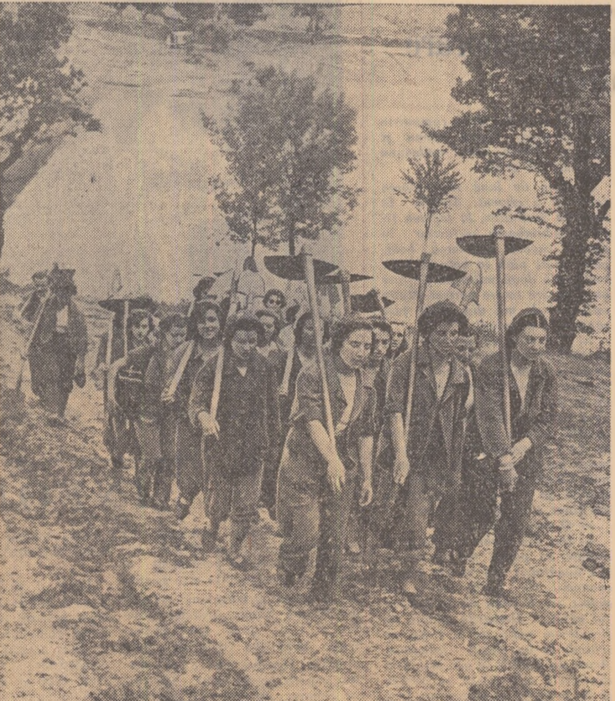
O brigadă de tineri din satul Mikre, raionul Lovci mergînd la muncă voluntară.