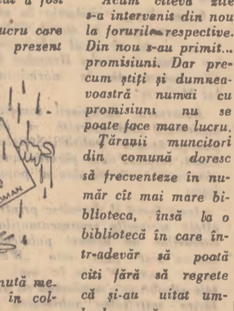
este că... se mută mereu naturii în colțurile forite.

Am început lucrul. Discuția lor însă continua din ce în ce mai aprinsă. Aproape că strigau unul la celălalt. După un timp am ieșit afară să jumez o figură. Cînd am reîntors în sala de lectură ce credeți că am găsit? Alături de cei doi vorbăreți se discuta un al treilea. Și-acum detașat și mai aprins. Încercările de-a-i face să