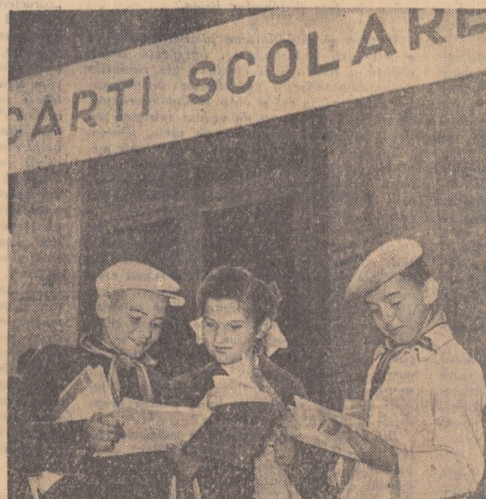
Bucuria și curiozitatea i-a oprit pe acești elevi chiar în fața bibliotecii

Vin și acum țărani la București. Nu e și în care gazetele noastre să nu relateze despre muncă lor minunată pe ogoarele patriei. Perdutul a curățat din viața lor un codru înfricoșător de zmircuri: moșieri și cămășari, negustori și chibaburi, neștiință de carte și paludism, neștință și alături, iată numele cîtorva din zmircurii vechi da tristeții și întunecării, care moștenite din trecut, au trebuit să piară sub seceră și ciocanul vitorilor socialista.