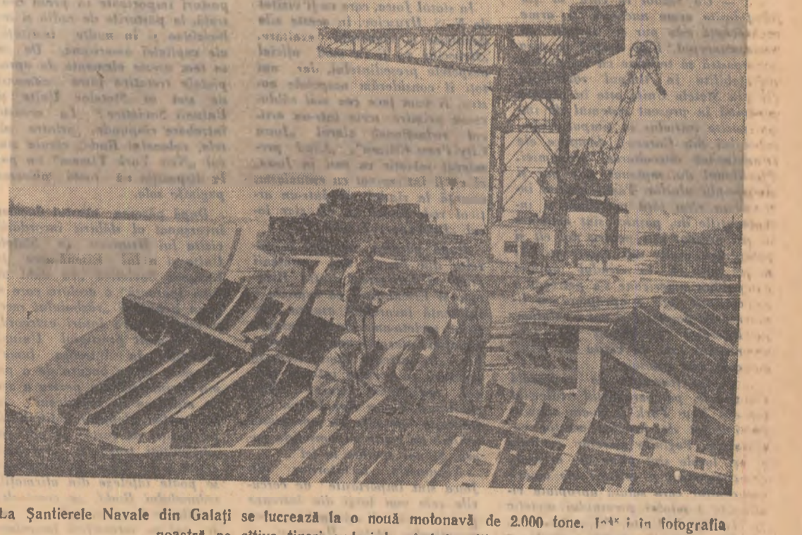
La Șantierele Navale din Galați se lucrează la o nouă motonavă de 2.000 tone. 1-a și în fotografia noastră pe eliva tineri sudori lu crînd la vîitoarea motonavă.