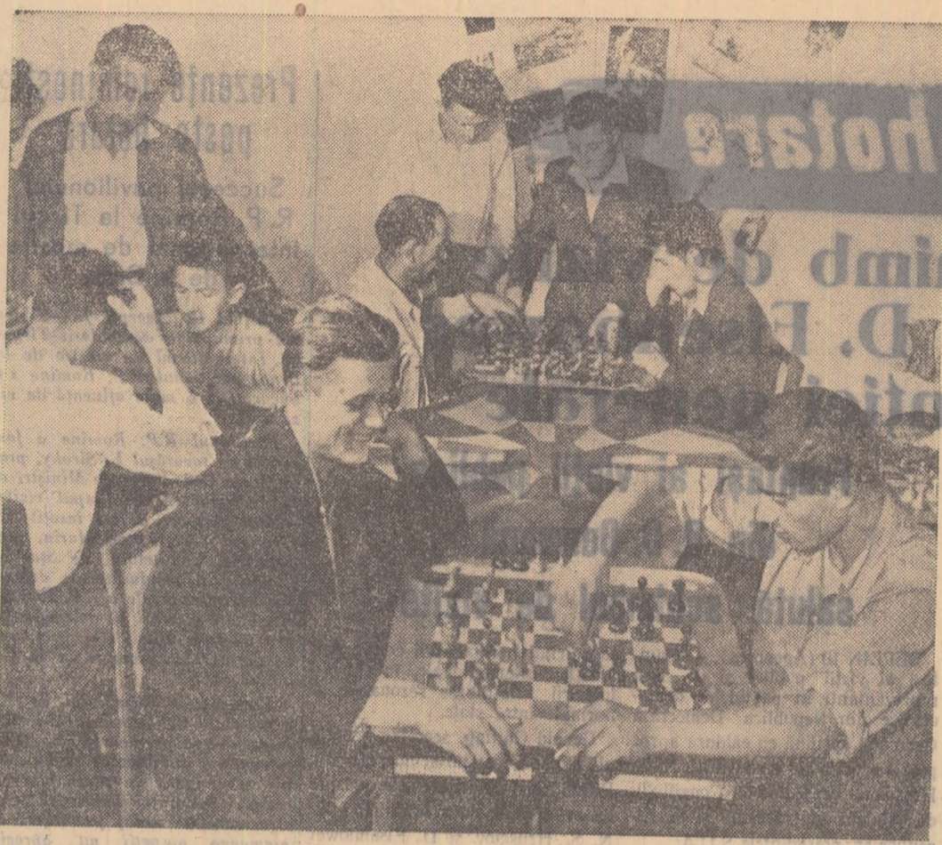
Sala de șah a clubului Atelierele G.F.R. „Ilie Pintilie” din Iași cu noștile în fiecare după amiază o mare animație.

Am aflat că brigăzile de producție din multe întreprinderi au pornit acțiunea pentru ca fiecare țărîn să încreze la nivelul frunțașilor, pentru a deveni colective de muncă fruntașe. Am dis-