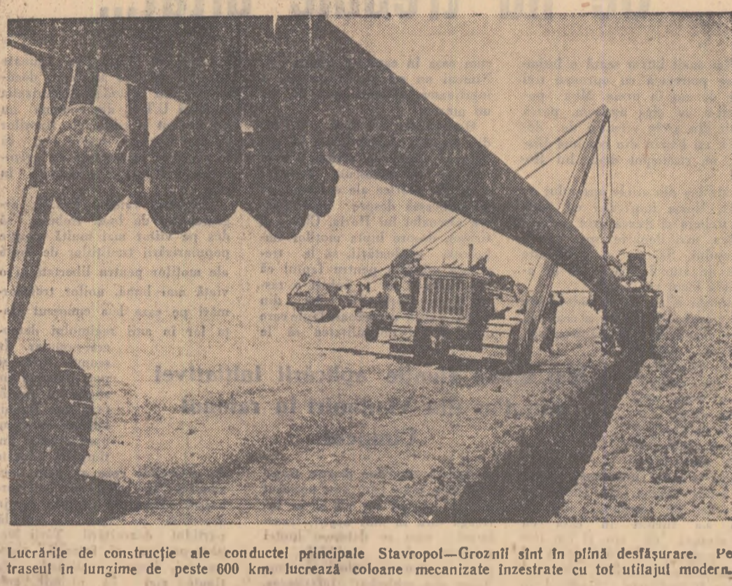
Lucrările de construcție ale conductei principale Stavropol—Grozni sînt în plină desfășurare. Pe traseul în lungime de peste 600 km. lucrează coloane mecanizate înzestrate cu tot utilajul modern.