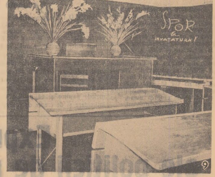
L. VALERIU

Au fost vizionate filmele „Cin-tece de nunță ardelenesă” și „N. Grigorescu”, care s-au bucurat de mult succes.