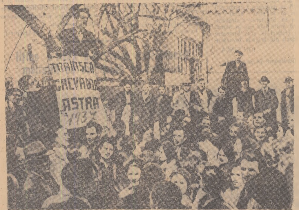
Numerose sînt mărturiile care vorbesc despre lupta maselor muncitoare din București conduse de P.C.R. împotriva fascismului țării. Documentul fotografic reproduces aici înfățișează pe neuitatul ziarist și scriitor