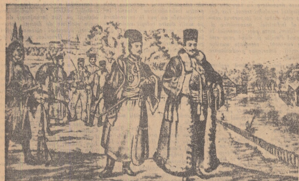
Litografia aceasta îl înfățișează pe Tudor Vladimirescu în mijlocul pandurilor săi la București în anul 1812.