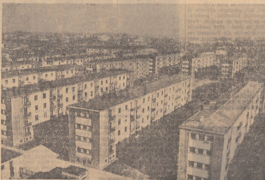
O imagine tipică a Bucureștiului nostru socialist: în locul vechiului cartier Ferentari cu străzi desfundate și cocioabe se ridică noul Ferentari cu clădiri moderne, locuințe confortabile pentru oamenii muncii. Numai în anii 1957 și 1958 au fost date în folosință oamenii muncii peste 7800 locuințe noi, anul acesta urmînd să fie terminate încă 8600 apartamente.