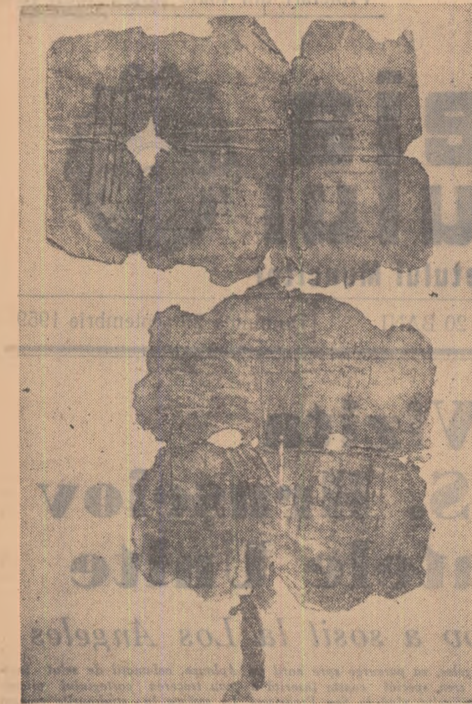
Iată reproducerea facsimilului hrisovului dat de Vlad Tepeș la 20 septembrie 1459 care, dintre toate documentele descoperite, cuprinde cea mai veche mențiune a denumirii BUCUREȘTI

În foto-reportajul de față prezentăm cititorilor noștri câteva reproduceri ale unor dintre exponatele ce pot fi văzute la Muzeul de istorie a orașului București.