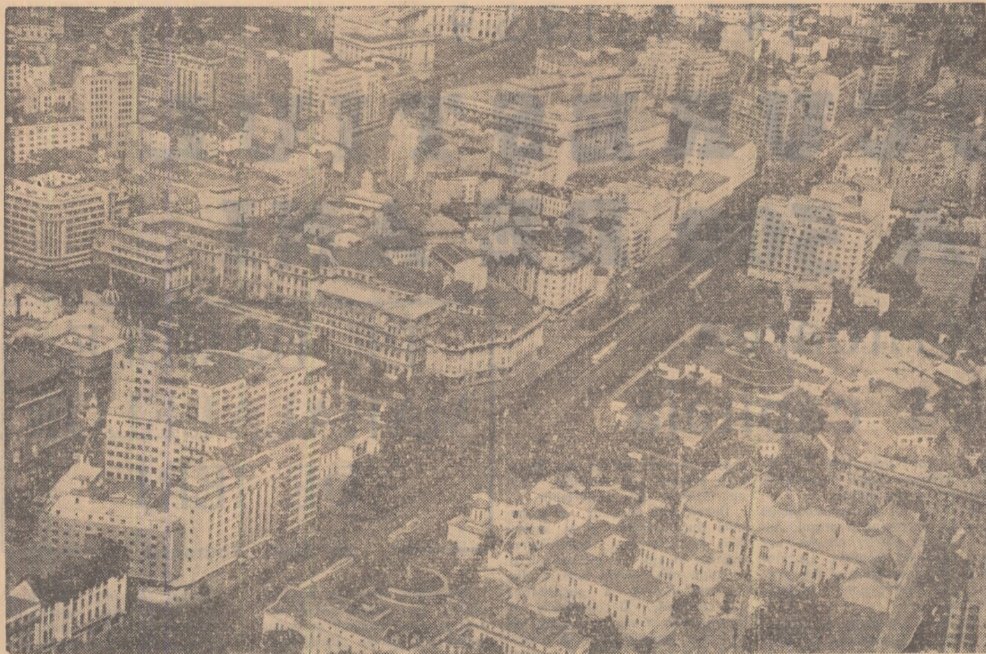
O imagine din heliicopter a Bucureștiului nostru drag