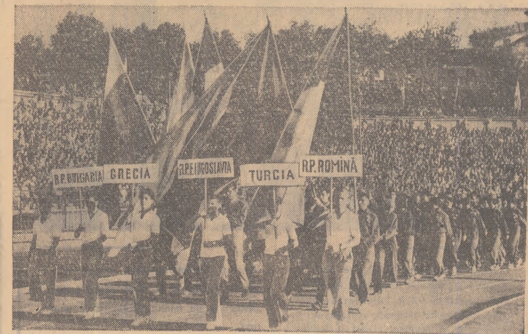
Aspect de la festivitatea de deschidere