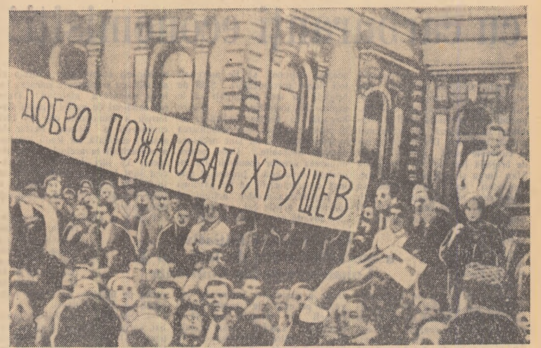
Locuitorii orașului San Francisco așteaptă sosirea lui N. S. Hrușciiov purtînd placarde pe care sînt scrise în limba rusă urări de bun venit.