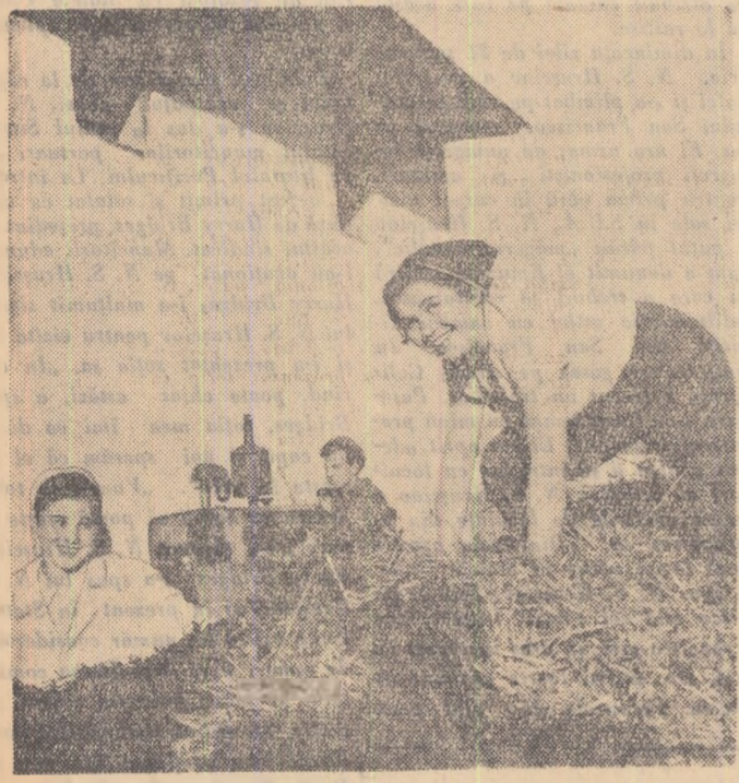
(Urmare din pag. 1-a)

năsuințe vechi, înăbușite îndelung, se iveau trăsături noi, tinerețe se-mplinea în noi coordonate. Se impunea o revizuire a valorilor, și instituirea unui noi ierarhii, în care hărnicia, îndemnată, curtea, cercușul poștii de prim ordin.