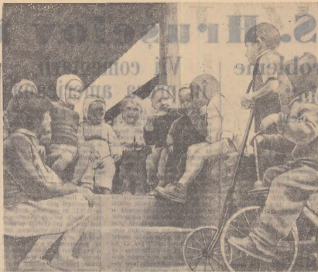
Fotoreporterul nostru surprinde un grup de copii ai muncitorilor din Bicaș în timpul unui „concert” de nai.

— M-am gândit mult la cazul a acestui tânăr. Mă întreb: nepunțința aceasta de a rupe prompt și în mod curajos relațiile de prietenie cu Jorj se datorează lașității sau faptului că în conștiința lui s-au infiltrat atât de adânc concepțiile burgheze ale „prieteniului” sau încă a ajuns el înșuși să se situeze pe poziții burgheze de viață?