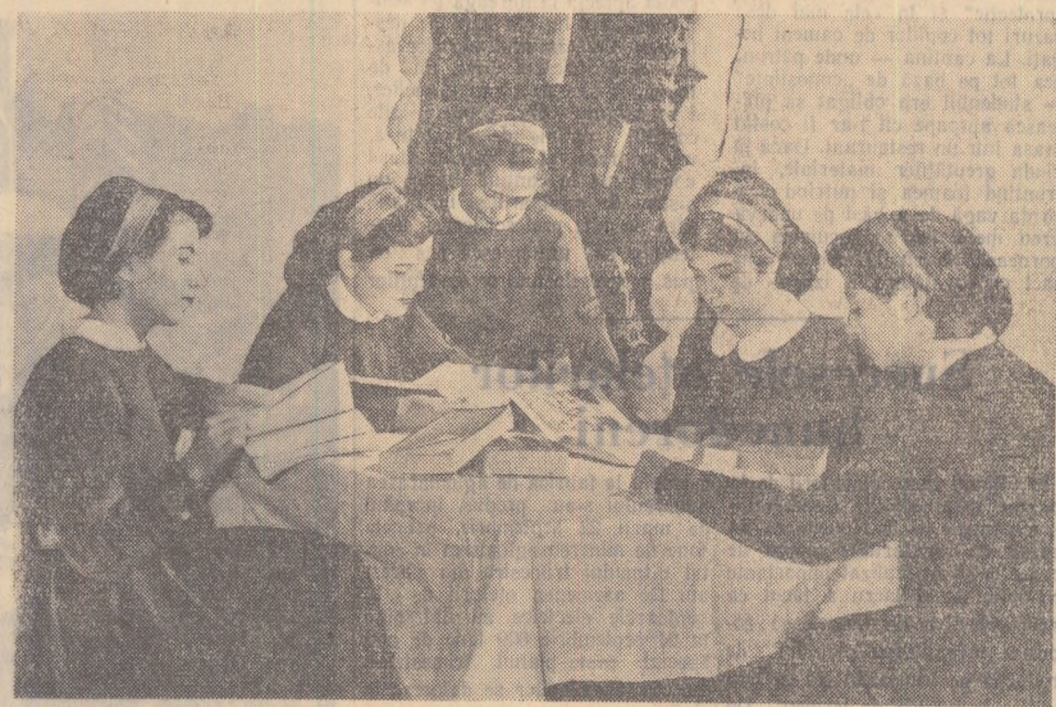
Studiu intens din primele zile de școală. Elevele clasei a XI-a A din Școala medie nr. 2 Buzău pregătesc în fiecare zi cu seriozitate lecțiile.