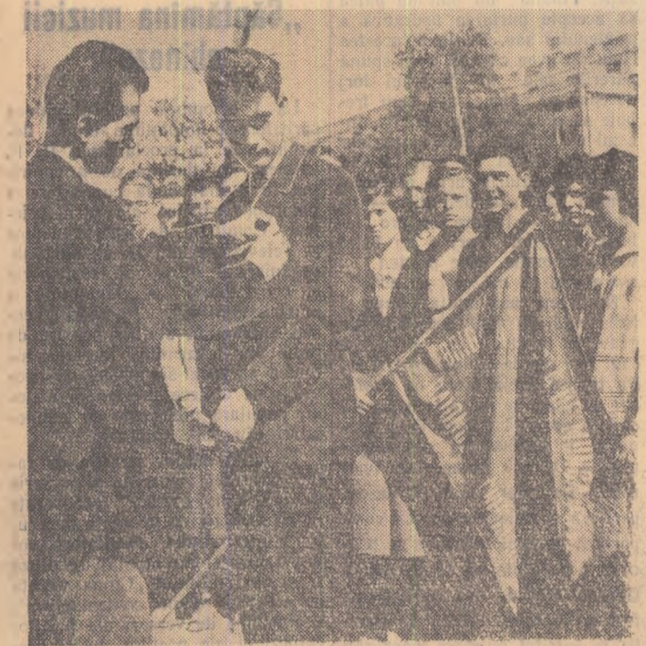
Moment emoționant: membrii birăzii utemiște de muncă patriotică din Școala medie nr. 1 din București în carnetul cărora sînt înscrise peste 100 ore de muncă voluntară, prinesc insigna de brigadier al muncii patriotice.