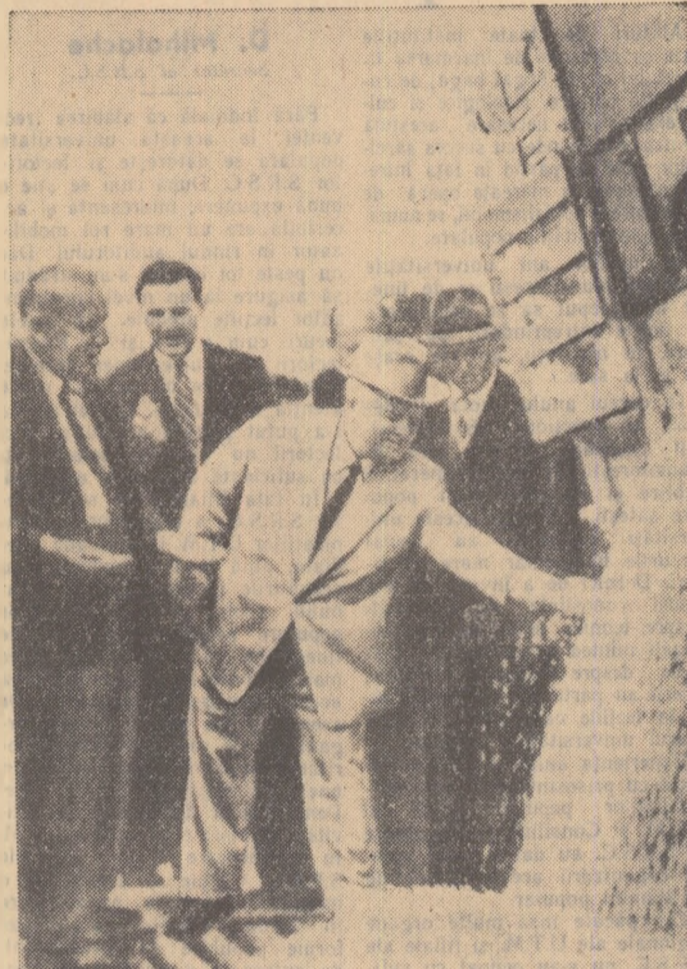
N. S. Hrușciiov în vizită la ferma lui R. Garst (Statul Iowa)