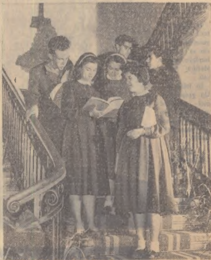
În pauză, un grup de elevi din clasa a XI-a a Școlii medii mixte „D. Cantemir” din București s-au oprit o clipă pe scări; acestea discută în legătură cu una din problemele cuprinse în lecția abia predată de profesor.