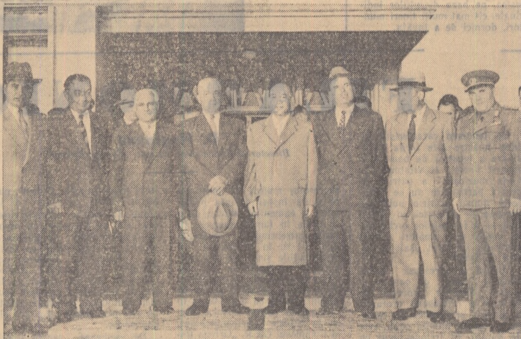
Pe aeroportul Băneasa înaintea plecării