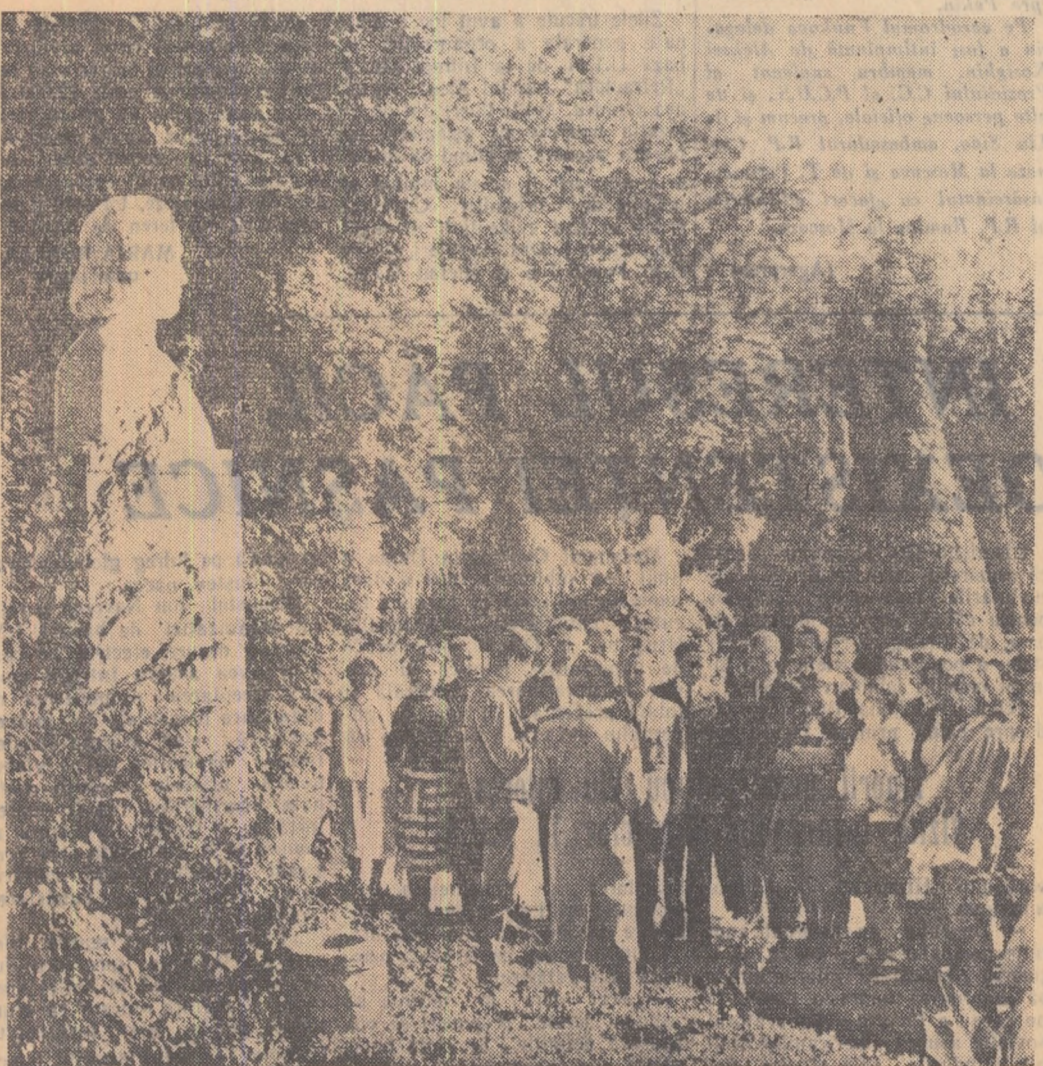
Duminică dimineața în Cișmigiu. În fața statuii lui Eminescu, tinerii din cercul literar al Casei de cultură a tineretului din raionul I.V. Stalin au organizat o frumoasă șezătoare închinată marelui poet.

V. MUNTEANU prim secretar al Comitetului orașesc U.T.M.—Orașul Stalin