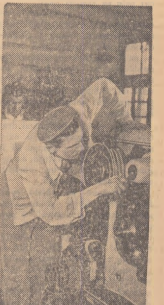
Zilnic ies pe porțile Uzinelor „Iosif Ranghel” din Arad nenumărate mașini unelte. În fotografie: un aspect din secția vopsitorie a uzinei.