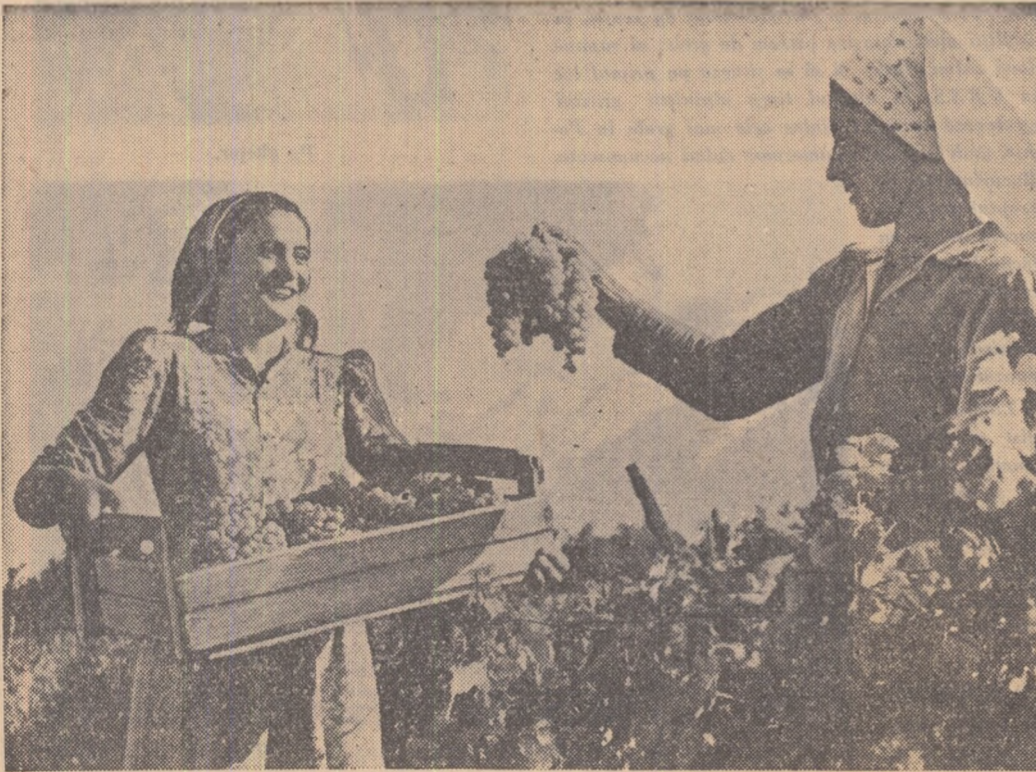
La G.A.C. „Grivița Roșie” din comuna Bolentin-Deal, regiunea București, a început culesul viilor.