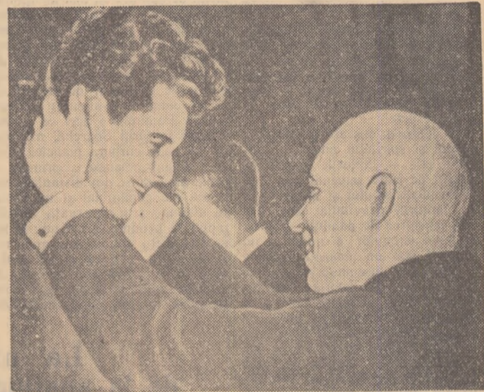
Întîlnirea între N. S. Hrușciiov și pianistul american Van Cliburn în timpul recepției de la ambasada sovietică din Washington.

WASHINGTON 26 (Agerpres). — TASS transmite la 25 septembrie, secretarul de Stat al S.U.A., Chr. Herter, a oferit un dejun în cinstea președintelui Consiliului de Miniștri al U.R.S.S., N. S. Hrușciiov.