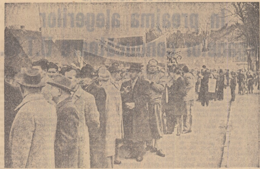
În Germania Occidentală ia avînt tot mai puternic mișcarea populară împotriva morții atomice. În fotografie un aspect de la o demonstrație a populației din Dortmund.

În cursul serii, președintele Consiliului de Miniștri al U.R.S.S., N. S. Hrușciov și persoanele care l-au însoțit în cursul vizitei sale de 13 zile în Statele Unite vor pleca pe bordul avionului „TU-114” spre patrie.