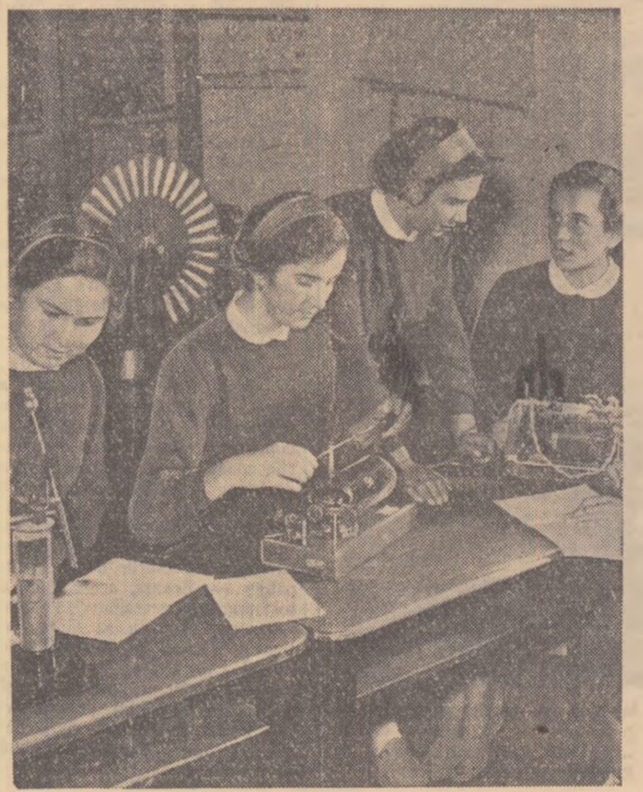
Eleve de la școala medie nr. 2 din Buzău la o oră de fizică în laboratorul școlii.