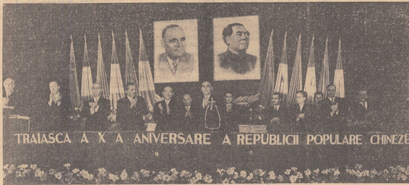
TRĂIASCĂ A X-A ANIVERSARE A REPUBLICII POPULARE CHINEZE