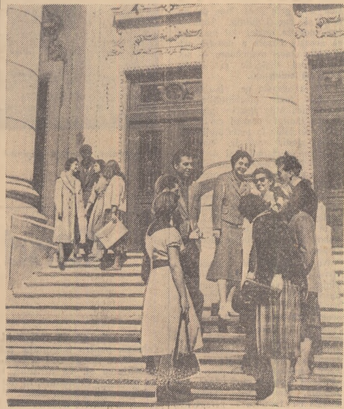
Din nou la facultate!

În ce-l privește, guvernul Republicii Populare Romine este hotărît să-și aducă întreaga contribuție la înfăptuirea acestui fel mareț.