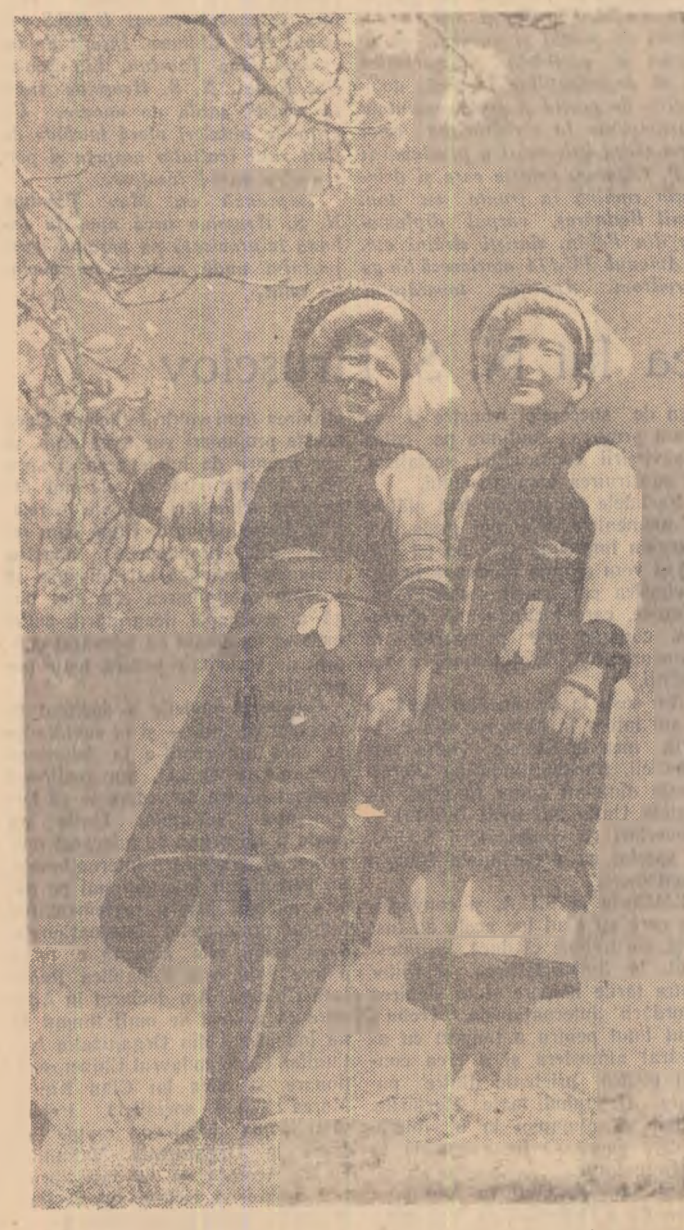
Surse de naționalitate Pai din multinaționala provincie Iunnan