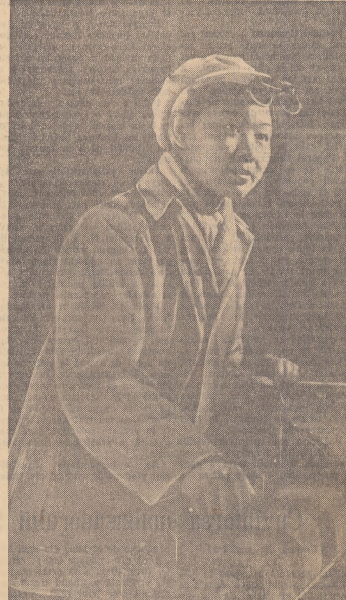
Tînără muncitoare manevrînd tabloul de comandă la toporia de oțel din Anșan