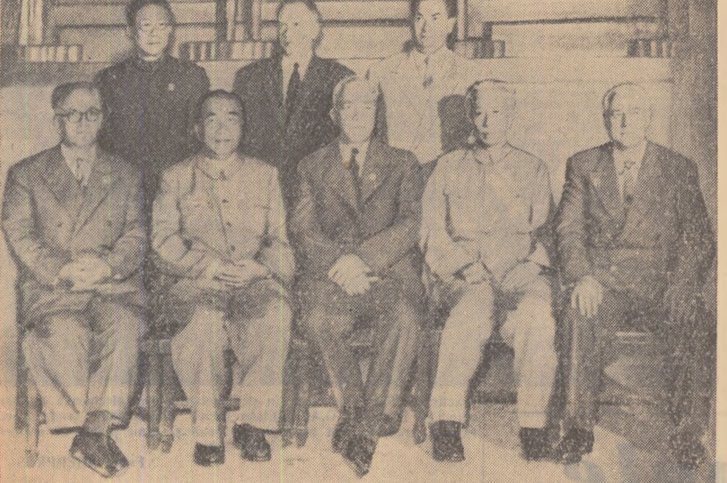
Fotografie de la întrevăderea tovarășilor Liu Șao-ți și Ciu De cu tovarășul Emil Bodnăraș și ceilalți tovarăși din delegația de partid și guvernamentală română.

Între N. S. Hrușciiov, M. A. Suslov și John Bernal, a avut loc o convorbire cordială, prietenească.