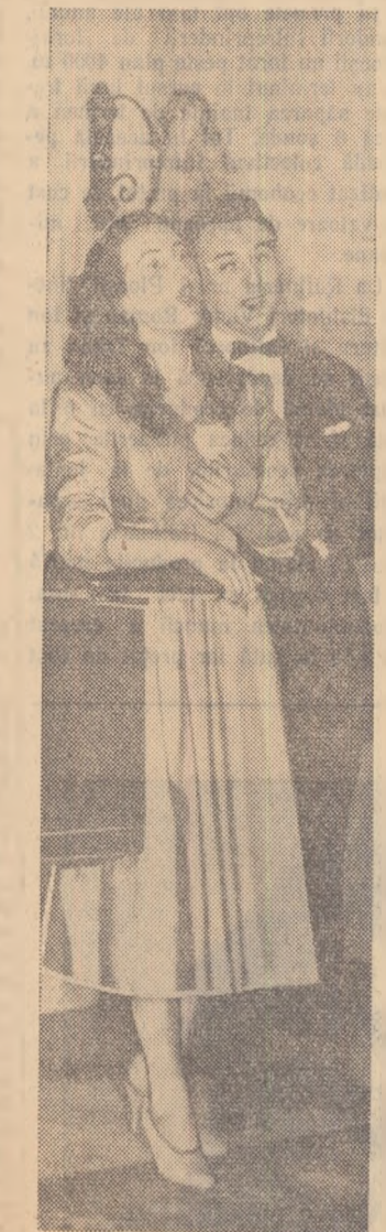
Recital de canto