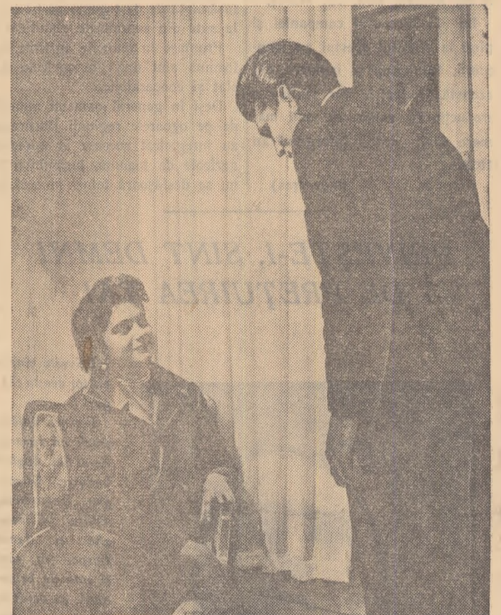
— Vă rog, dansați?