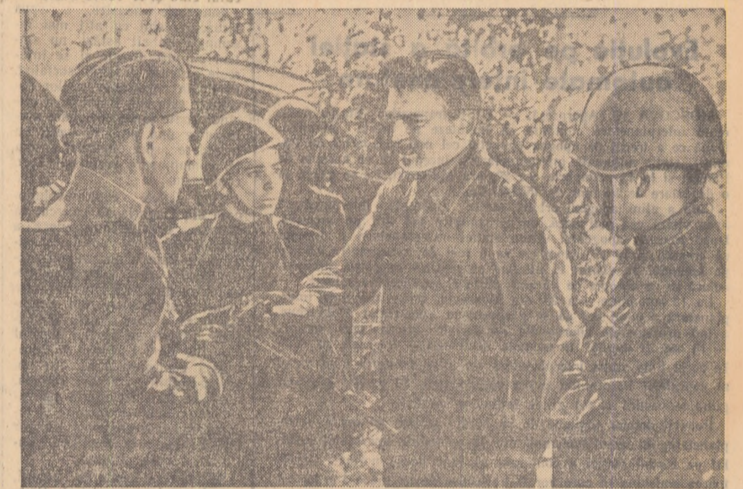
Scenă din filmul „Soarta unui om”.

Conferințele și expunerile despre realizările științei și tehnicii sovietice care au avut loc în orașele și comunele regiunii Stalin au fost audiate de peste 70.000 oameni ai muncii.