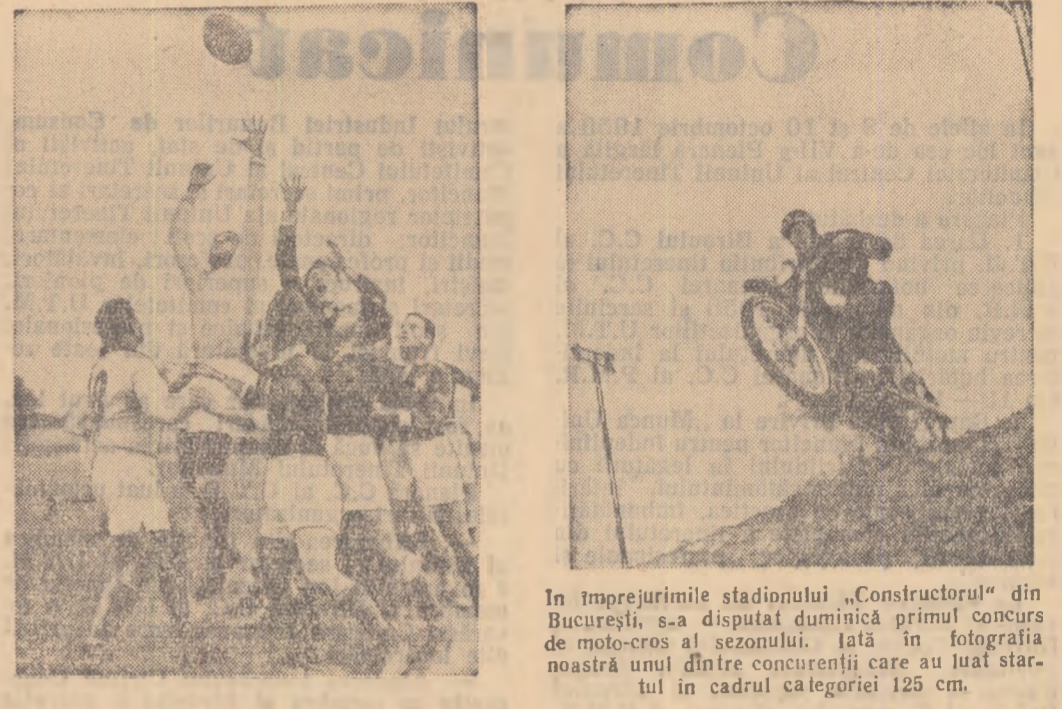
În împrejurimile stadionului „Constructorul” din București, s-a disputat duminică primul concurs de moto-cros al sezonului. Iată în fotografia noastră unul dintre concurenții care au luat startul în cadrul categoriei 125 cm.

Pasionații sportului cu balonul oval au urmărit duminică în Capitală, o partidă deosebit de disputată — cea dintre formațiile Constructorul C.C.A., terminată la egalitate. te: 6-6.