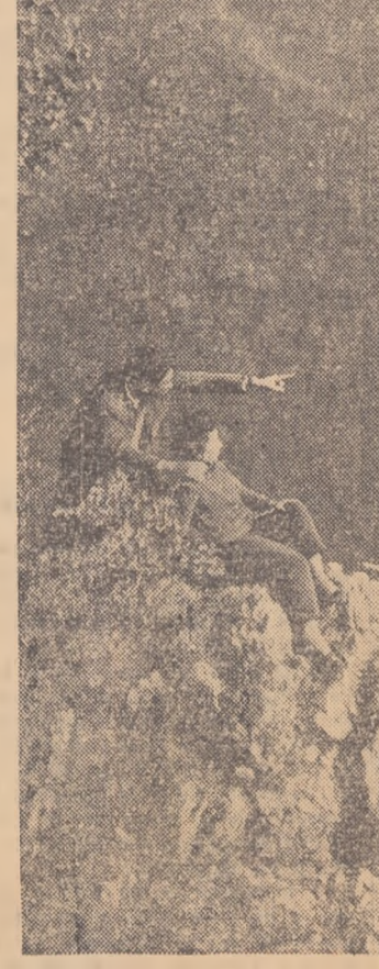
Tușnadul văzut de pe Stîncă Șoimilor.

Cantitățile cele mai mari de bumbac au fost recoltate în raioanele Alexandria și Zimnicea.