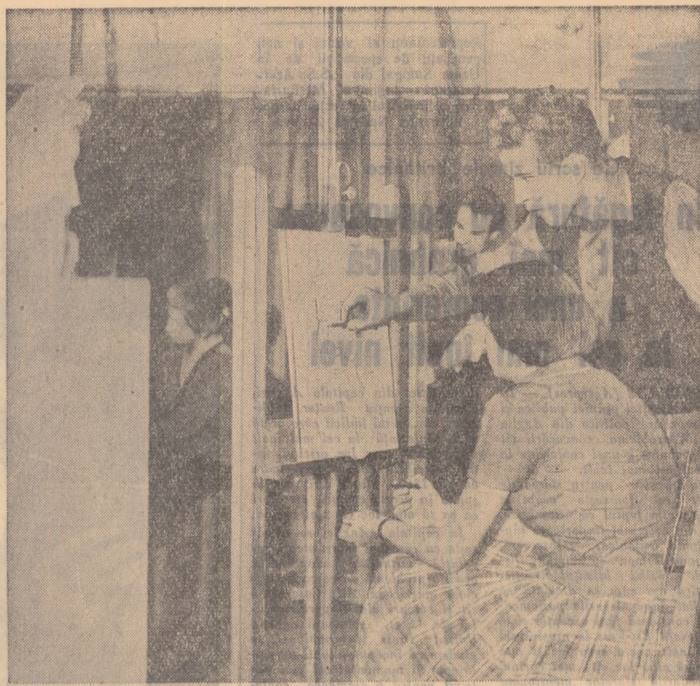
In cercul de artă plastică al tineretului din raionul „I. V. Stalin”, din București