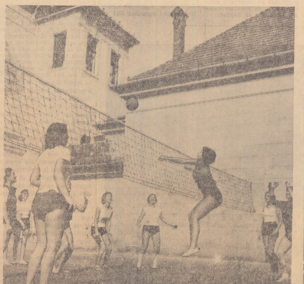
Elevete clasei a XI-a a Școlii medii mixte nr. 4 din Orașul Stalin, dovedesc multă pasiune pentru volei. Iată-le în timpul unei partide amicale.

(Urmare din pag. 1-a) De unde această forță? Se tot spune: au apărut din cînte cuceririle internaționale, sportivilor poartă pe piept zăgăzînd steagul patriei lor. E o mare cinste și o mare răspundere. Dacă partidul și guvernul au asigurat concurenților sportivi condiții aliedată nebănănit, deosebit de pe teren sau din fața aparatelor de radio și televiziune își tîlmăcesc, prin entuziasm lor colectiv, patriotismul socialist, dacă înaintea meciurilor se întonează imnurile, atunci se cuvine ca, dumneaș, sportivilor, să răspundă cu demnitate la aceste simboluri dragi. Să nămesteți ca să știți cum să lupti pentru victorie pentru ea, obținînd-o să nu te culci pe lauri, ci să nămesteți din nou. Și nu numai sînt. Să respicți etica sportivilor socialisti. Jos veștedismul, jos înșimfarea. Respect, modestie, bun simț. Și, pe urmă, fii și în muncă frumos și, după cum ești în sport și viceversa. Filozofia sportivă are partea ei fundamentală: imbinarea utilului cu frumosul. Adică robustețe și frumusețe, adică: estetică