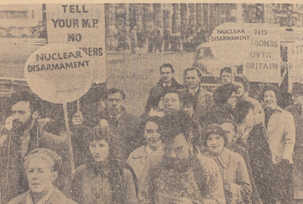
Nu de mult, în fața ambasadei franceze din Londra a avut loc o manifestație a populației capitalei engleze împotriva experiențelor atomice pe care Franța proiectează să le facă în Sahara

ese, în urma politicii discriminării impuse de S.U.A., ocupat de Japonia, au fost prezentate candidatură Poloniei și aceea a Turciei sprijinită de Statele Unite. Adunarea a procedat la 12 tururi de scrutin succesive, fără ca vreunul din candidați să obțină majoritatea necesară, adică 54 din voturile Adunării. Analiza rezultatului de pînă acum al votului arată însă că o majoritate constantă și fermă atînd 47-48 dintre delegații s-au pronunțat în favoarea candidaturii Poloniei, în timp ce Turcia n-a putut obține decît 33-35 voturi. Votarea urmează conform regulilor de procedură să continue în ședința de după-amiază, cînd în cazul unui rezultat definitiv se va trece mai departe la alegerea a șase noi membri în Consiliul Economic și Social O.N.U.