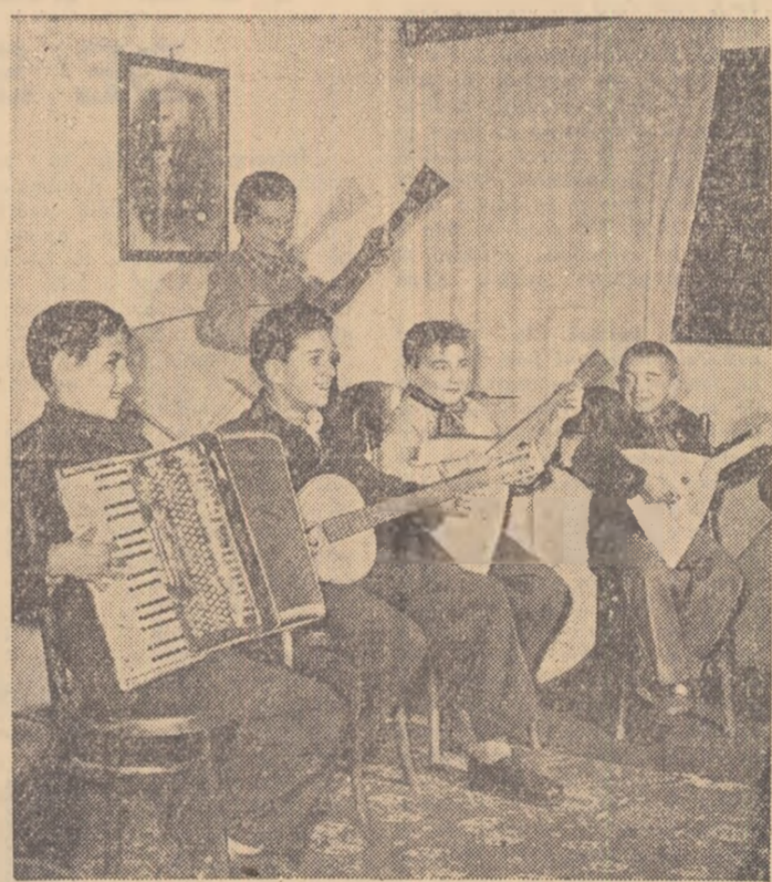
Cercul de muzică instrumentală al Palatului Pionierilor din Orașul Stalin atrage tot mai mulți pionieri.