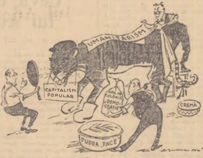
COSMETICA SOCIALA Desena de M. Abramov (din ziarul „Pravda”).

Intr-un buletin medical în legătură cu starea sănătății primului ministru Kassem se arată că ea continuă să evolueze normal, el urmînd să părăsească peste câteva zile spitalul. Kassem și-a reluat activitatea avînd întrevederi cu mai mulți membri ai guvernului irakian și primind în audiență o serie de diplomați străini.