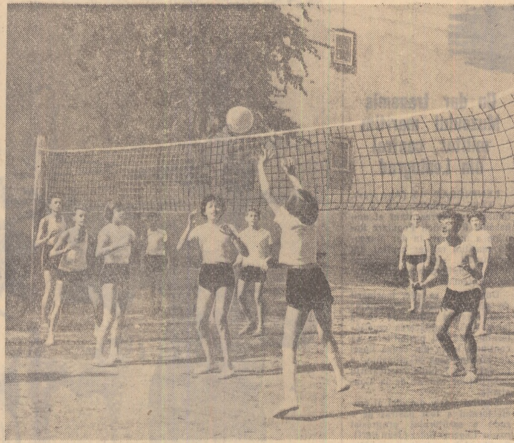
Ora de sport la Școala medie unificată nr. 2 din Oradea.

Aceștia vor încheia contracte cu sîturile populare regionale angajîndu-se să lucreze cel puțin 6 ani după absolvire, ca profesori la școlile de 7 ani din mediul sătesc.