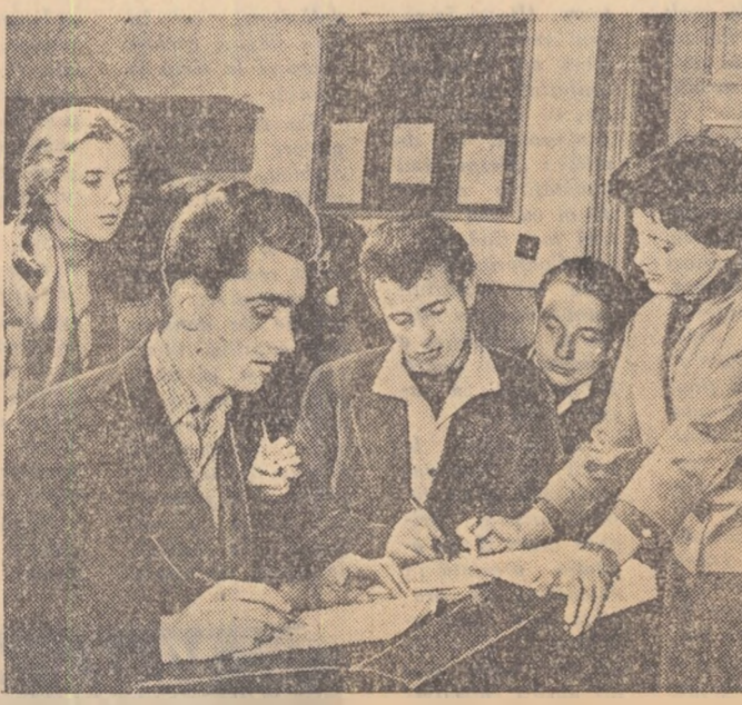
La Școala medie muncitorească de pe lângă Uzinele „Timpuiri Noi” din Capitală învață și tinerii de la uzinele apropiate. În fotografia noastră elevii din clasa a VIII-a B la ora de chimie.