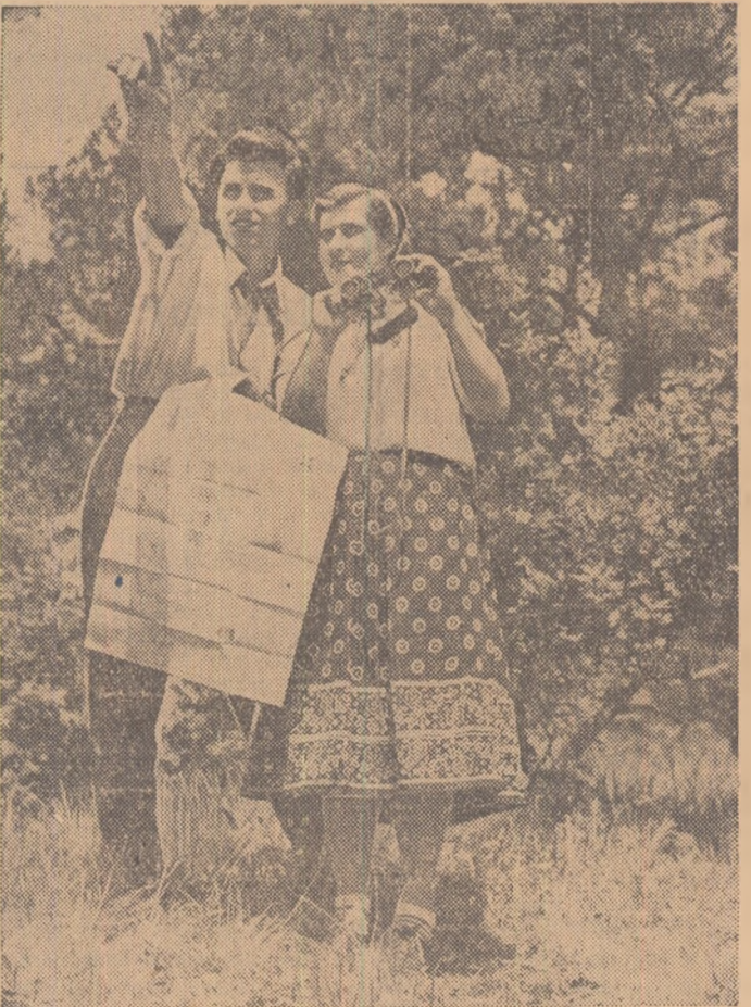
Harta și binoclul sint de un real folos în excursie. Cei doi tineri discută despre itinerariul unei noi excursii în munții Bucegi.

Anul XV, seria II-a, nr. 3244 4 PAGINI — 20 BANI Duminică 18 octombrie 1959