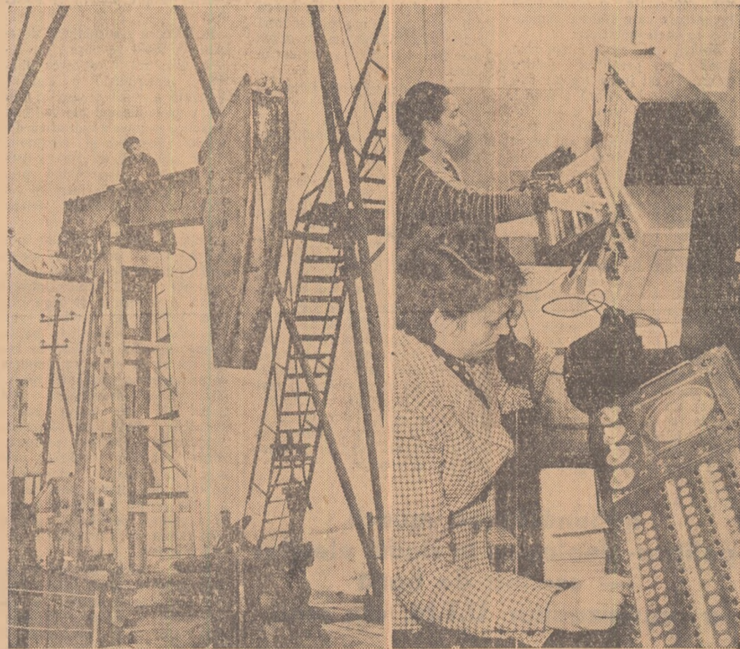
În întreprinderile petrolifere din R.S.S.A. Ceca-Ingusă, la o serie de sonde s-a trecut la un sistem de dirijare teletomată a procesului de producție. În clișee — montarea instalației (în stînga) și la tabloul de comandă (în dreapta)