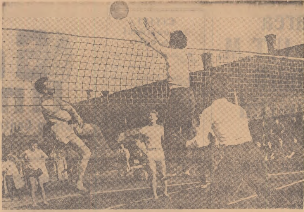
Un aspect de la întrecerile „Cupei Moldovei“ la volei Suceava-Galați 2-0 (15-9; 15-13)