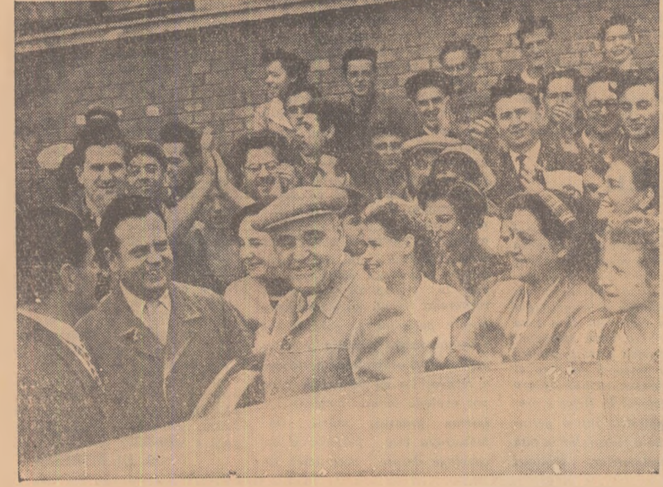
La uzinele textile „Moldova” din Botoșani

Colectivul Oțelăriei Martin nr. 1 de la Combinatul siderurgic Hunedoara a elaborat în ziua de 16 octombrie cea de-a 22.000-a tonă de oțel dată peste plan de la începutul anului. Succesele oțelariilor sînt rezultatul aplicării cu pricepere a metodei sovietice de elaborare a șarjelor rapide. Între 1 ianuarie și 16 octombrie, topitorii de la Oțelăria nr. 1 au elaborat 572 șarje rapide. Scurtarea timpului de elaborare a șarjelor a dus în același timp la creșterea indicilor de utilizare a cuptoarelor. În prima jumătate a lunii acesteia, de pildă, topitorii de la cupitor nr. 1 au realizat zilnic, în medie, de pe fiecare metru pătrat vatră de cupitor cu 0,55 tone de oțel mai mult decît era planificat. (Agerpres)