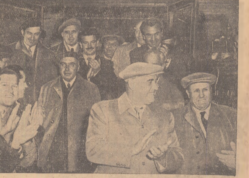
La teatrul de stat „Mihail Eminescu” din Botoșani