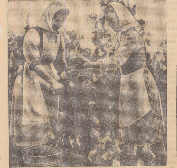
Recolta de struguri la G.A.S. Jidvei, raionul Timișoara, este și în acest an deosebit de îmbelșugată.