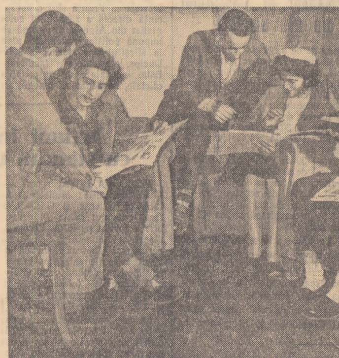
Un aspect din sala de lectură a fabricii de încălțăminte „Solidaritatea” din Oradea.

10% REDUCERE LA CARTI Vizitati librariile!