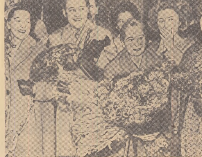
La sosirea în Capitală a colectivului Teatrului dramatic de stat „Mossoviet”

Următoarea fază a legăturilor cu stațiunea interplanetară va avea loc la 21 octombrie de la ora 15 la ora 16, ora Moscovei. Pînă la această dată stațiunea interplanetară automată se va îndepărta de Pământ la o distanță de aproximativ 327.000 km. și va afla deasupra unui punct de pe suprafața Pământului, avind coordonatele: 38 grade longitudine estică și 23 grade latitudine sudică.