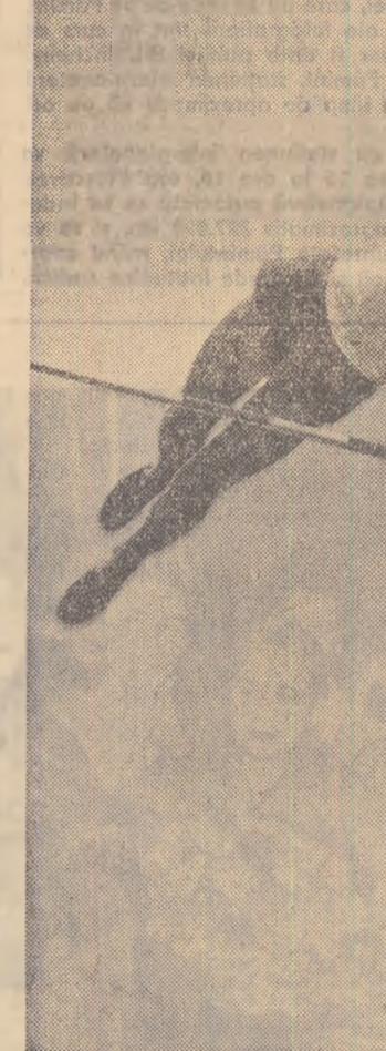
EUSEBIU PITULESCU VASILE RANGA