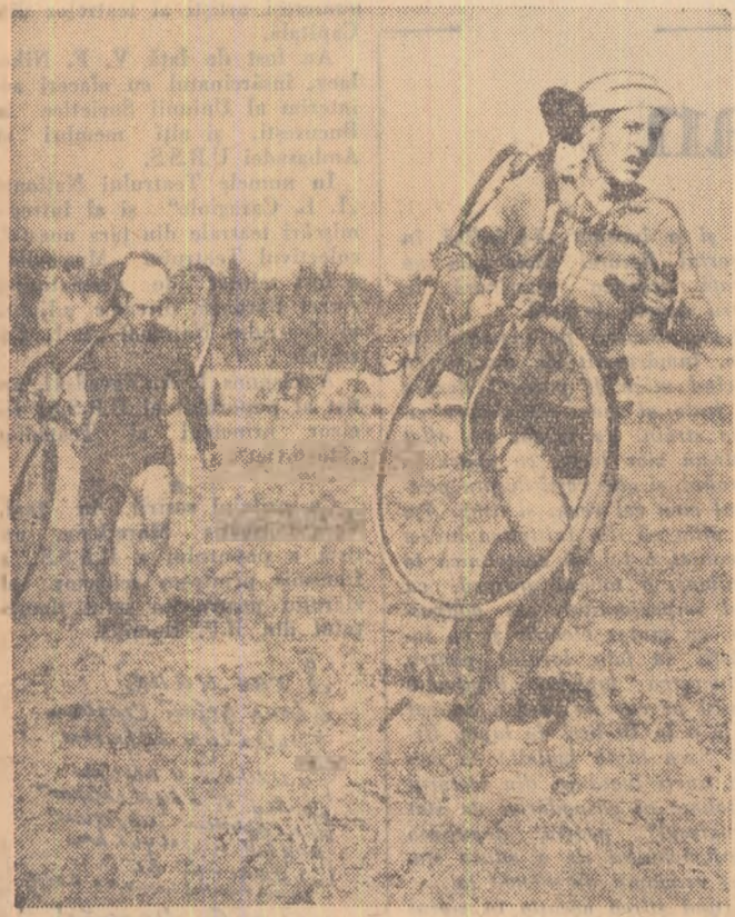
Ciclocrosul desfășurat duminică prin împrejurimile stadionului „23 August” din București a avut un concurs puțin cam... dificil. O bună porțiune a fost parcursă de concurenți pe un teren proaspăt arat.

Casa de cultură a tineretului din raionul Nicolae Bălcescu dispune de mari posibilități ma-