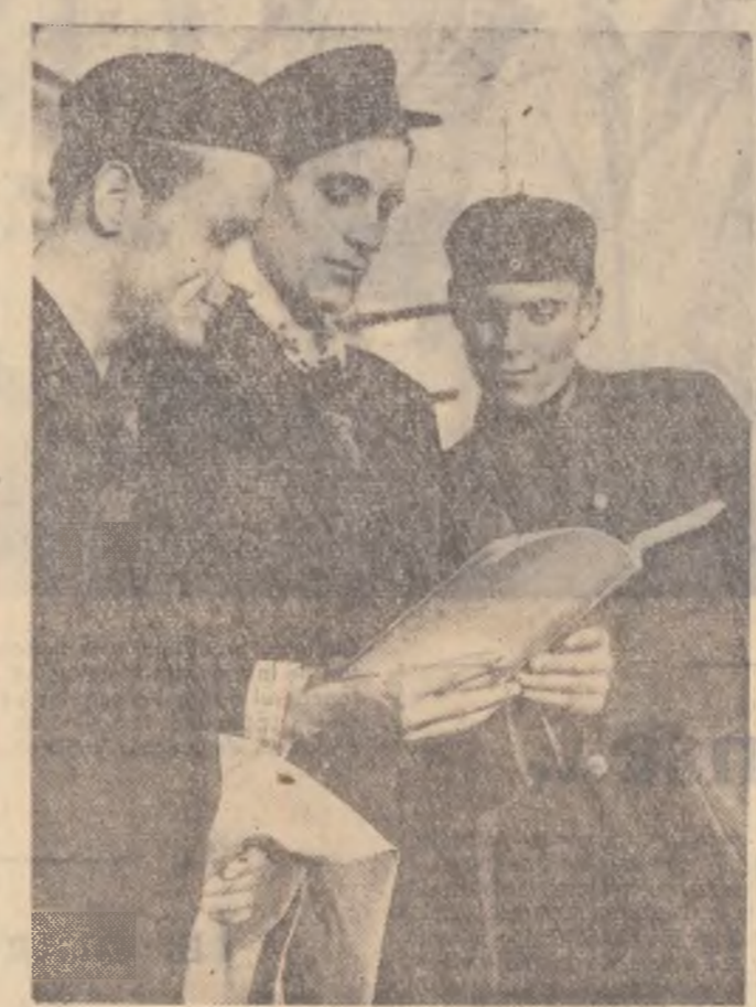
Un nou manual. Tinerii muncitori-elevi îl răsfoiesc cu curiozitate.