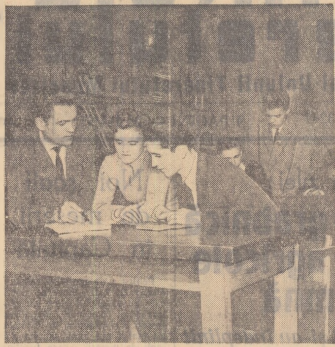
La Clubul Atelierele C.F.R. „Grivița Roșie” s-a amenajat o sală specială de lectură pentru tinerii muncitori-elevi.