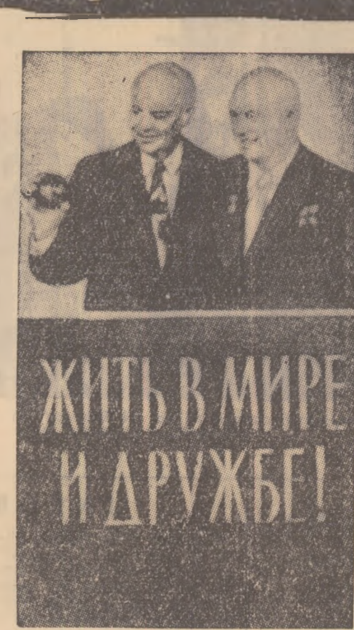
Coperta cărții „Să trăim în pace și prietenie”, apărută zilele acestea la Moscova. Cartea cuprinde toate materialele în legătură cu vizita lui N. S. Hrușciov în S.U.A.