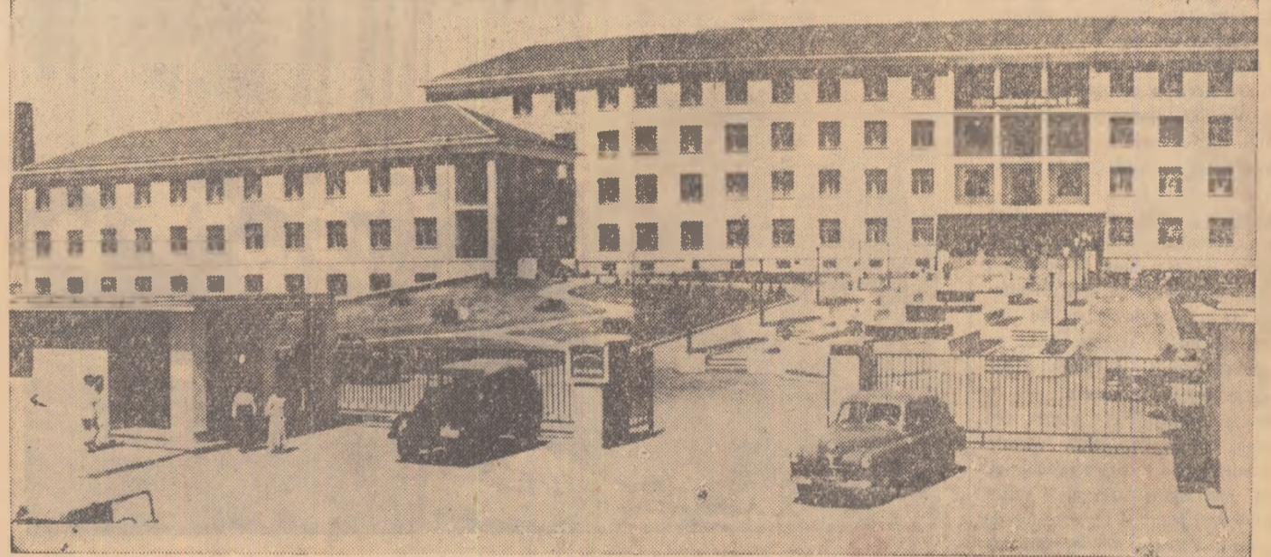
Spitalul din Phenian construit cu ajutorul R.P. Romine

DIN PARTEA POPULAȚIEI ÎNTREGII PROVINȚII PHENANUL DE SUD-COREEA