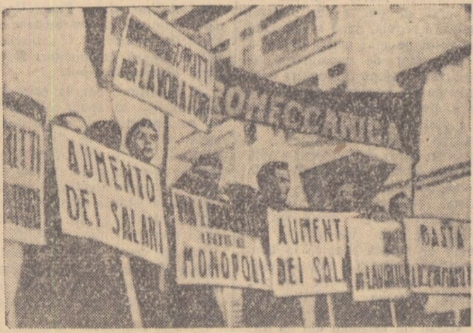
Italia. Muncitorii Uzinei de construcție de mașini „Bred” (la periferia orașului Milano), protestează împotriva concedierii și cer mărirea salariilor. În fotografia de sus: Participanții la demonstrație poartă plăcarde pe care scrie: „Respectați drepturile muncitorilor! Măriți salariile! Jos conducătorii legați de monopoluri!”

Fapt este, după cum subliniază United Press International, că în momentul actual are loc în departamentul războiului o adevărată „luptă în problema programelor cosmice care constituie una din cele mai mari dureri de cap pentru ministrul de Război McElroy”. De altfel s-a anunțat la 21 octombrie că președintele Eisenhower a convocat la Casa Albă pe principalii săi experți în probleme cosmice și cele ale rachetelor pentru a studia criza în problemele cosmice. Agenția Reuter precizează că această reuniune fusese prevăzută de mult dar convocarea ei a fost grăbită de demisia lui Medaris care a avut asupra opiniei publice efectul unui șoc puternic.