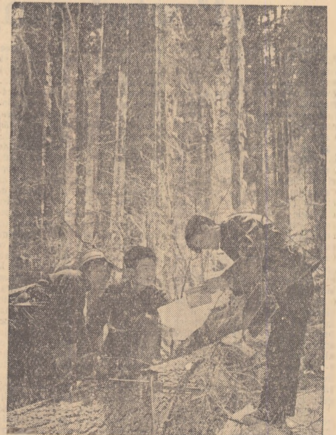
China de sud-vest abundă în pădurile dintre care unele sint neexploatate. În vederea inventarierii resurselor forestiere echipa de specialiști străbătă pădurile țării. În fotografie: o echipă de agenți silvici intr-o pădure neexploată din provincia Iunnan.

PEKIN. — Agenția China Nouă a transmis declarația comună a Partidului Comunist Chinez și a Partidului Comunist din Japonia semnată la 20 octombrie la Pekin.