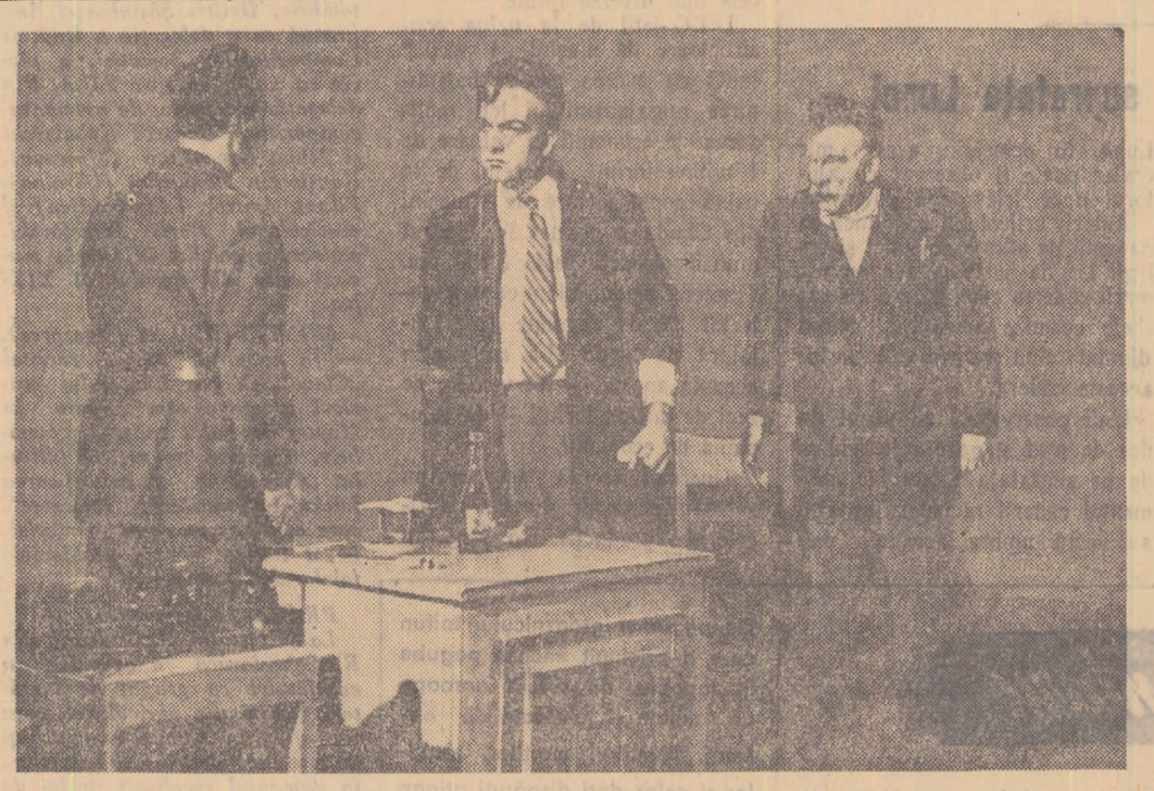
O scenă din piesa „Bătălie în marș”