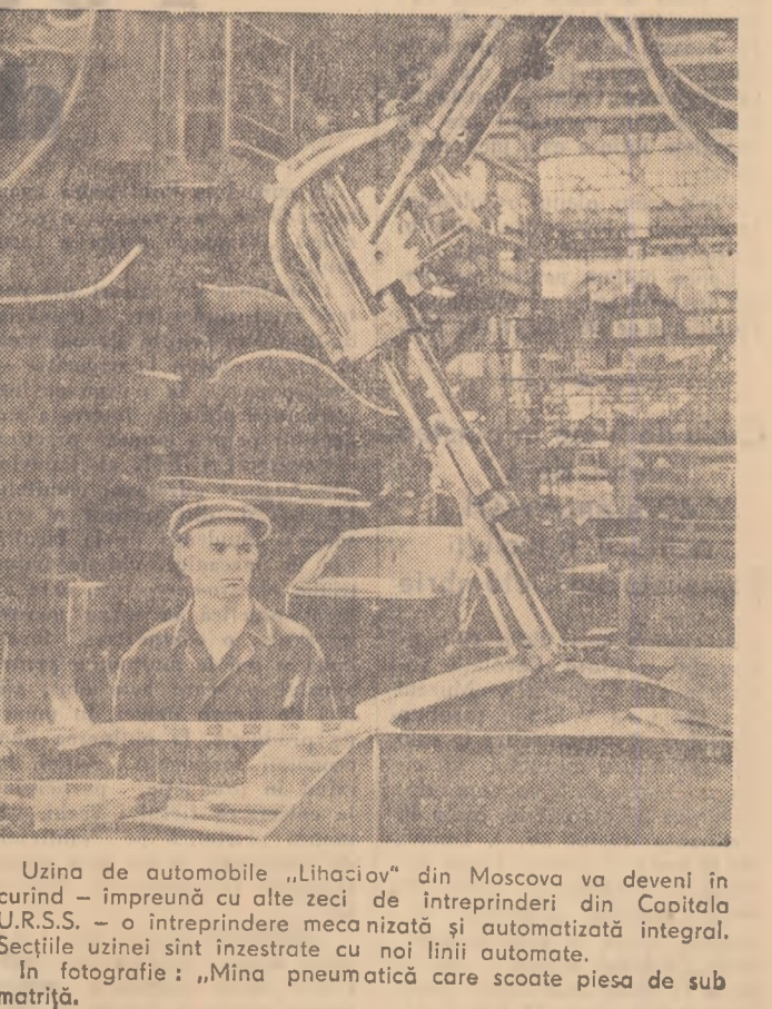
Uzina de automobile „Lihaciov” din Moscova va deveni în curînd — împreună cu alte zeci de întreprinderi din Capitala U.R.S.S. — o întreprindere mecanizată și automatizată integral. Secțiile uzinei sînt izostatice cu noi linii automate.

(După un articol apărut în revista „Nauka i Jizn”)