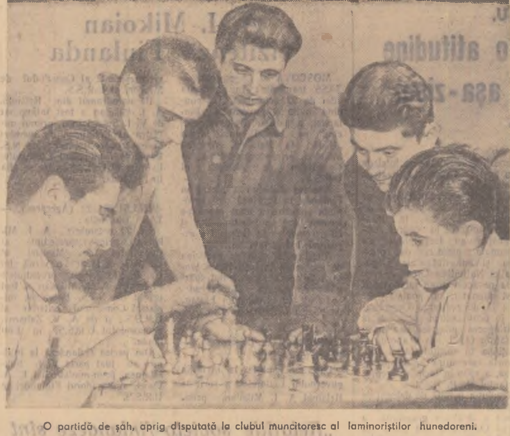
O partidă de șah, aprig disputată la clubul muncitoresc al laminoriștilor hunedoreni.