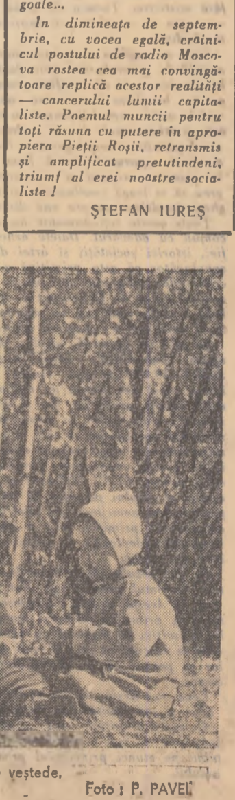
E bine la soare, chiar pe un covor de frunze veștede.