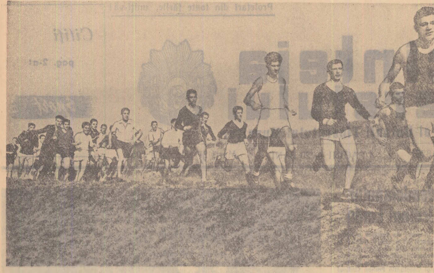
În împrejurimile Casei de cultură a tineretului din raionul „23 August” din Capitală, s-a disputat duminică etapa rațională pentru juniori și junioare, a crosului „Să întîmpinăm 7 Noiembrie”

După etapa I-a a crosului „Să întîmpinăm 7 Noiembrie”