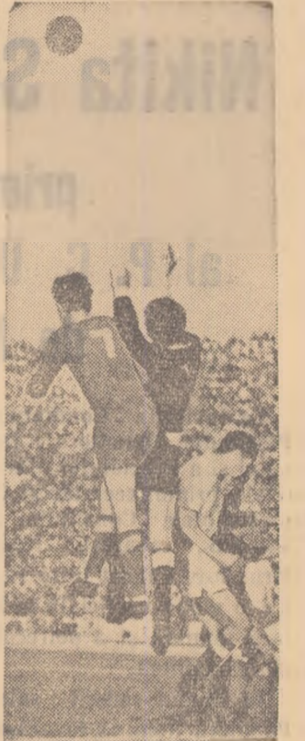
Un atac al echipei „C.C.A.”, care a dispus duminică cu scorul de 4-1 de formația bucureșteană „Progresul”

nu dai înapoi, mai ales după primul înscuș, inevitabil înscușul. Ai fost învins în prima sau a doua întrecere sportivă. Între carele pe teren sau în sala de sport, cu gîndul să te pregătești mai bine la antrenamente. Ascultă-l cu mai multă atenție pe antrenorul sau profesorul tău. Nu-ți face niciodată concedii. Ai mereu mai multă încredere în forțele tale, în pricepera antrenorului. El îți este prieten, te ajută. Astăzi nu ți-a reușit prea bine startul, sau poate fi-nisul? Mai încearcă, odată, de două ori, de zece ori. Ai să reușești. Ai reușit, nu te infurca. Și alții se străduiesc. Și ei se vor bucura de succese cînd și ei luptă pentru educarea voinței, pentru a învinge. Voința înseamnă să dorești astăzi să muncești la antrenament mai mult ca ieri, mai bine. Numai așa vei reuși ca mine să fi și mai în formă, iar mult rîvnita victorie să-ți surîdă încă din start. Numai așa surîdă voința de fier vei reuși să reprezîți cu cinste culorile asociației, culorile sportive ale scumpei noastre patrii.