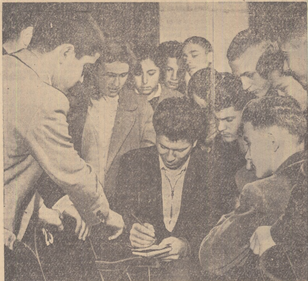
În pauza consfătuirii numeroși tineri s-au înscris la discuții.