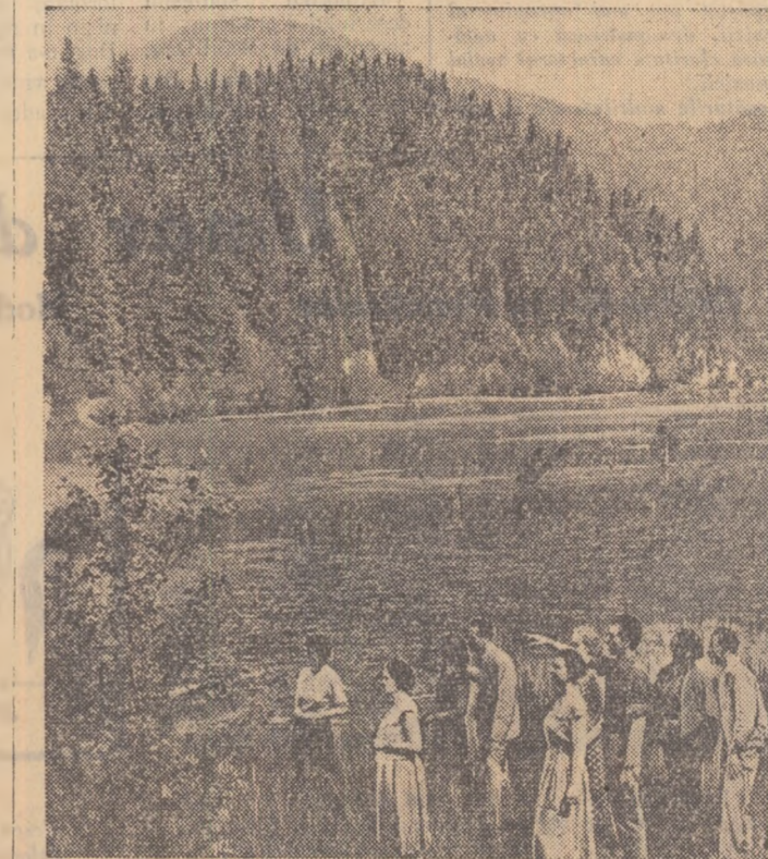
Din frumusețile patriei: Lacul Roșu

Sîmbătă după-amiază a plecat din Capitală spre Hunedoara un tren încărcat cu 500 tone de fier vechi, colectat în ultimul timp de brigăzile otemiste de muncă patrioțică din București. Acesta este cel de-al 4-lea tren cu fier vechi pe care tineretul Capitalei îl trimite siderurgistilor de la cele două mari combinăte — Hunedoara și Rășnă.