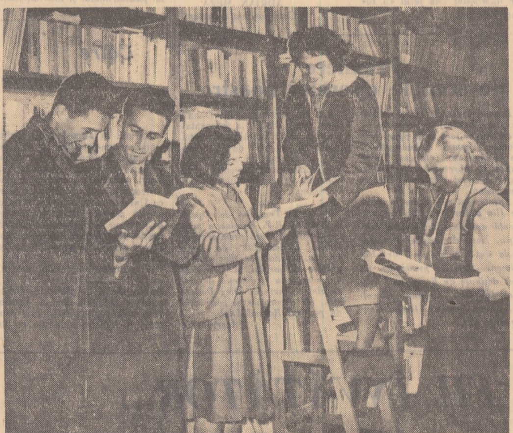
Biotehnica ciudaului C.I.R. „16 Februarie” înșoșoara are peste 25.000 de volume și peste 2.500 de cititori.