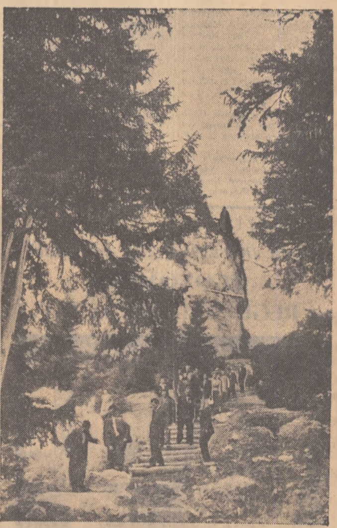
În drum spre Izvorul Rece — Rarău

U.R.S.S. pentru sprijinul prețios pe care l-a acordat activității asociației noastre. Îndrumată de Partidul Muncitoresc Român, care educă oamenii muncii în spiritul patriotismului și internaționalismului socialist, asociația noastră își va aduce și pe viitor contribuția la cunoașterea de către masele largi ale poporului nostru a grandioaselor realizări ale poporului sovietic în opera de construire a comunismului, a politicii de apărare și consolidare a păcii pe care o duce Uniunea Sovietică în fruntea lagărului păcii și socialismului, la întărirea continuă a prieteniei dintre popoarele noastre. Trăiască și înflorască prietenia veșnică dintre poporul român și poporul sovietic! Trăiască marea popor sovietic constructor al comunismului!