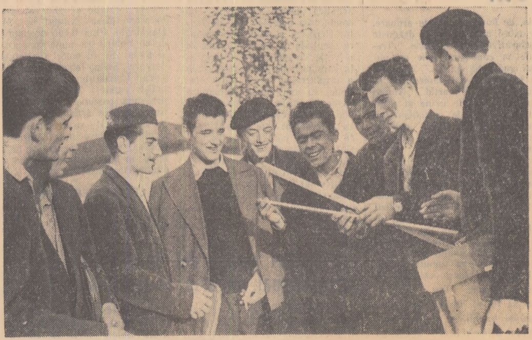
Calitatea baghetelor destinate viitoarelor planșe a stîrnit vil discuții. Fiecare din muncitorii siderurgisti-elevi în clasa a VIII-a curs seral a liceului „Matei Corvin” din Hunedoara — este exigent