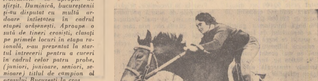
Hipism. Printre celelalte competiții sportive închinată zilei de 7 Noiembrie, amatorii de hipism din Capitală au putut urmări întrecerile „Cupei Sportului popular” desfășurate pe hipodromul „Gh. Gheorghiu-Dej”. Cu acest prilej au evoluat cu deplin succes membrii Centrului de tineret din Capitală. Cupa a revenit reprezentanților asociației „Recolta”.