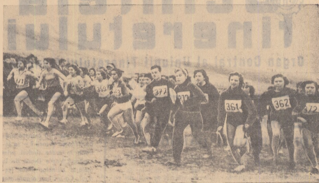
Cros. Intrecerile marii competiții sportive de masă, crosul „Să întîmpinăm 7 Noiembrie” se apropie de sfîrșit. Duminică, bucureștenii și-au disputat cu multă ardoare infietatea în cadrul etapii orașenești. Aproape o sută de tineri crosiști, clasăți pe primele locuri în etapa raională, s-au prezentat la startul întrecerilor pentru a curri în cadrul celor patru probe, (juniori, junioare, seniori, senioroare) titlul de campion al orașului București la cros.