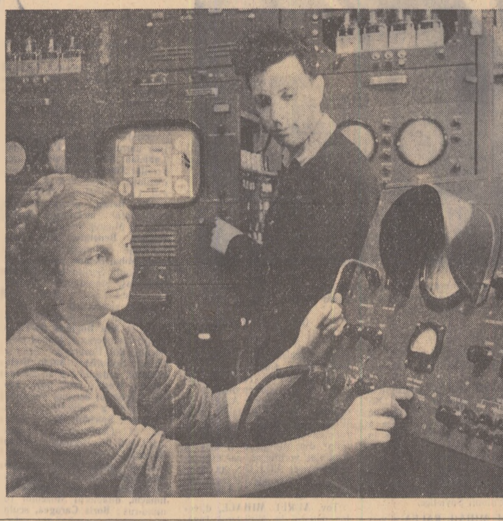
În fotografie: Tineri specialiști lucrînd la aparatura centralului de televiziune de la Dnepropetrovsk (U.R.S.S.)

Ziarul „Magyar Nemzet” relevă că în raportul lui N. S. Hrușciiov se vorbește „despre lucrul principal și cel mai de seamă — pacea”.