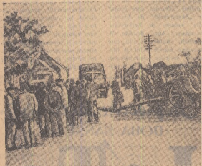
De curînd 30.000 de țărani francezi din provincia Bretagne au baricadat șoselele în semn de protest împotriva politicii guvernului în legătură cu stabilirea unor prețuri extrem de scăzute la achizițiile produselor agricole, în timp ce produsele industriale au prețuri nemoimpenabile de ridicate.

La dineu au luat parte de asemenea șefii unor misiuni diplomatice acreditați la Atena. Dineul a decurs într-o atmosferă cordială.