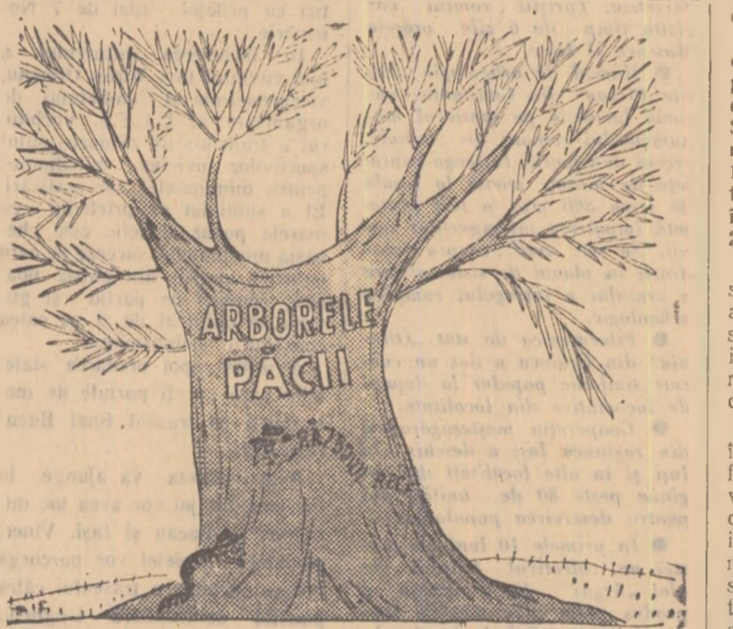
Dădătorii Desen de M. ABRAMOV (din ziarul „Pravda”)

Provoacă îndoieli îngrijorătoare în legatură cu soarta conferinței faptul că după reluarea tratativelor, adică de la 27 octombrie delegația S.U.A. a început să insiste tot mai mult asupra examinării așa-numitelor noi date seismice americane eschivîndu-se totală de a examina problema cotelor de inspecție. Totodată, delegația americană nu s-a abținut de a amenința cu crearea unui impas la tratative.