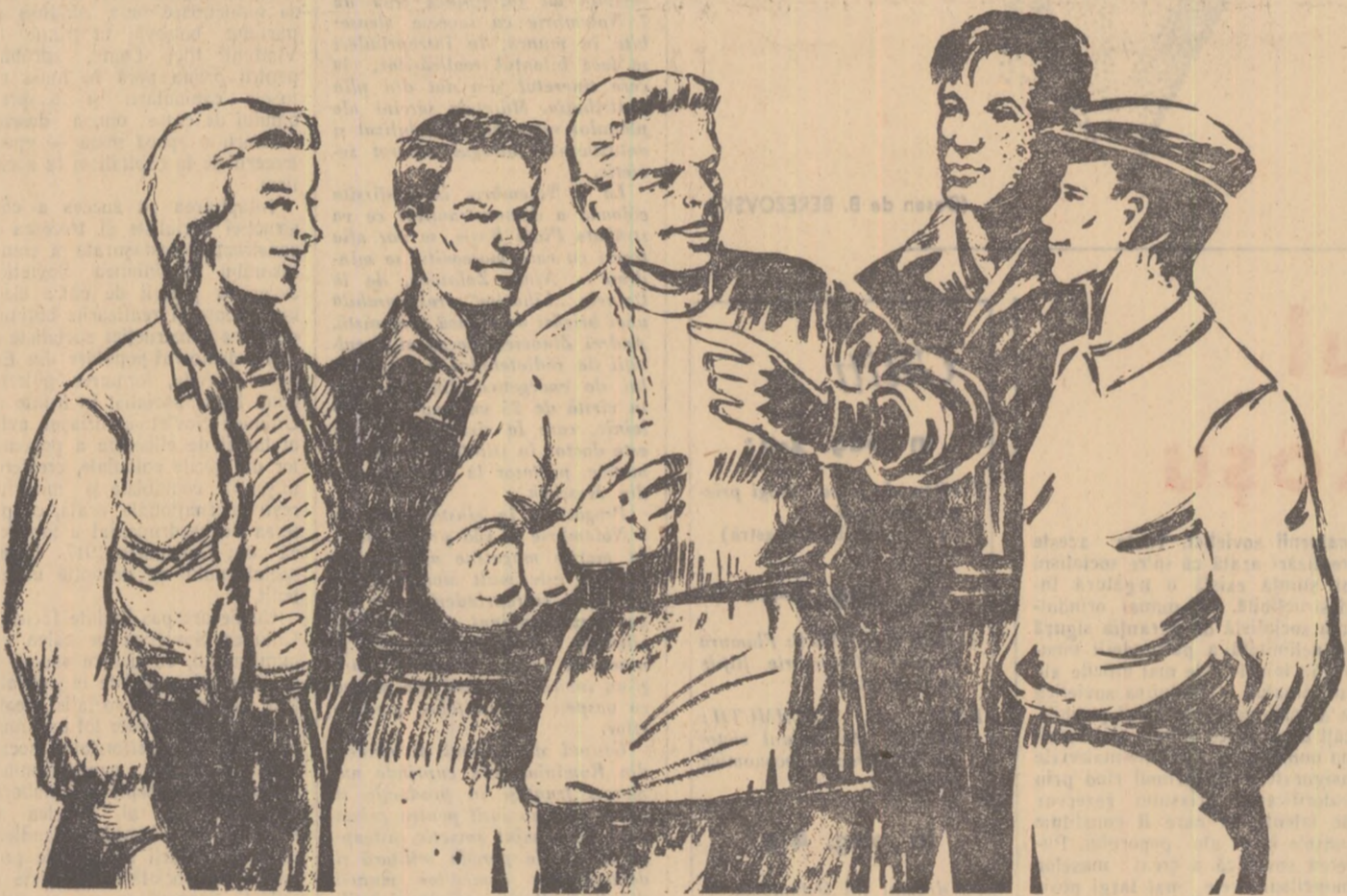
Desen de: A. CALISTRAT

studii, ca aspirant la Facultatea de fizică a Universității Lomonosov din Moscova, este unul dintre cele mai noi și mai pline de perspectivă domenii științifice: semiconductorii. Cunoștință largi aplicații în sectoare practice alite de diferite ca automatizarea, optica, radiofonia etc., studiul semiconductorilor se bucură în Uniunea Sovietică de aporțul unor vestii specialiste.