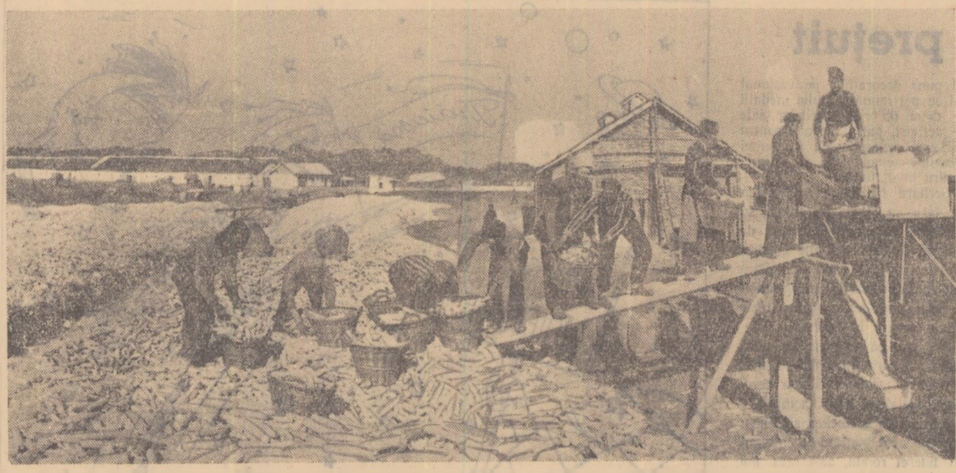
Anul acesta colectiviiștii din G.A.C. „6 Martie” comuna Scorțaru Vechi, raionul Brăila, au obținut o producție cu aproximativ 600 kg. porumb știuleți la hectar peste prevederile planului. Respectat regulile agrotehnice. Acum colectiviiștii depun eforturi gada a trela de cîmp lucrînd la boterea porumbului știuleți în vederea înmagazinării lui.

cu V. Gestnokov V. Brener L. Liubasevici A. Sestakov N. Khabladze N. Mameeva N. Kalinov Scenariu: S. Vasilev, N. Otten Regia: S. Vasilev Imaginea: M. Ruf Muzica: B. Geaikovski