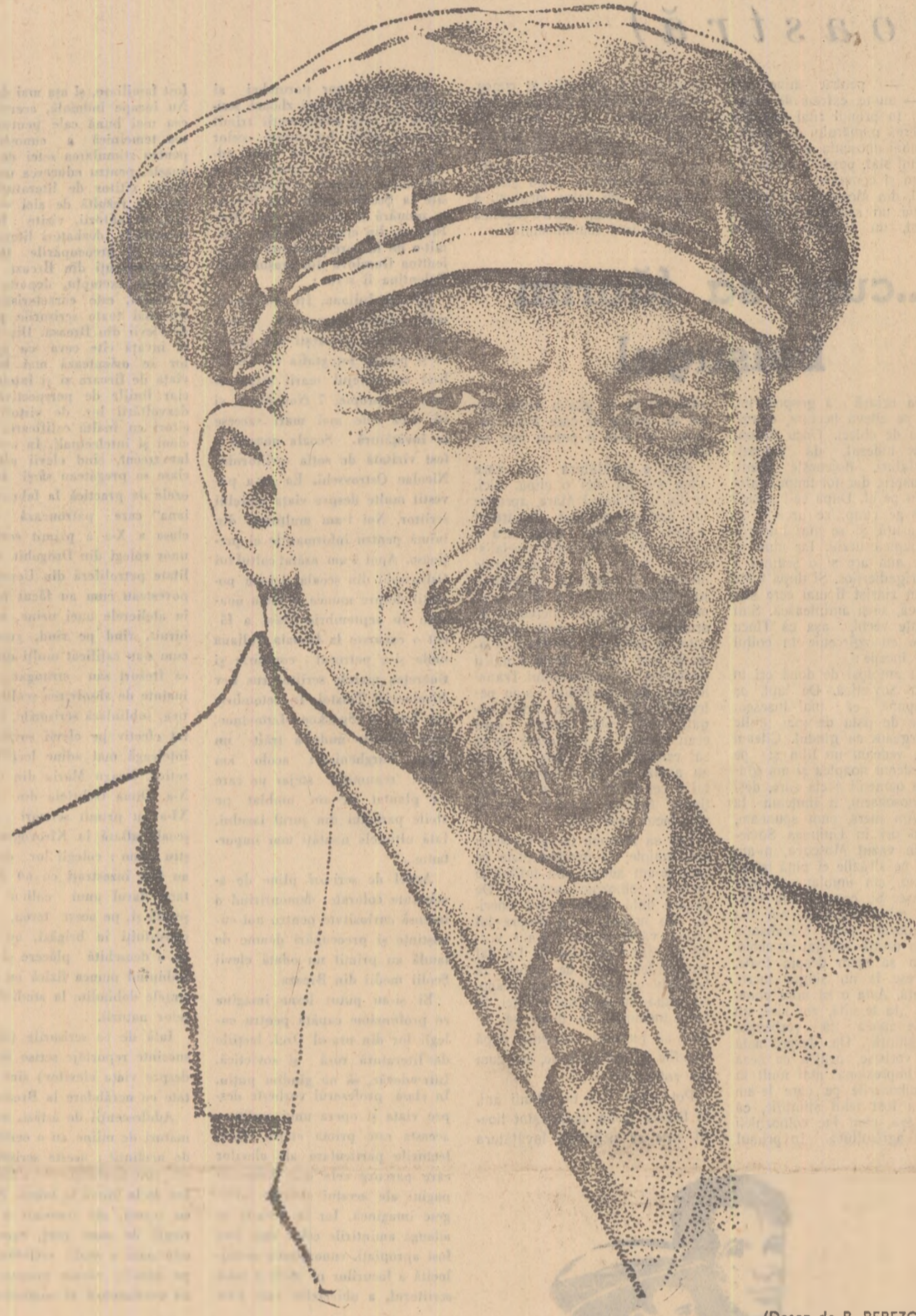
(Desen de B. BEREZOVSKI)