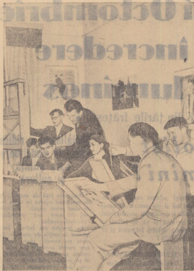
În cercul de artă plastică al siderurgistilor hunedoreni.

La invitația G.C. al Comsomolului din R.S.S. Moldovenească, un grup de tineri și tinere din orașul și regiunea Iași au plecat joi dimineața la Chișinău pentru a participa la festivitățile care vor avea loc în acest oraș cu prilejul celei de-a 42-a aniversări a Marii Revoluții din Octombrie.