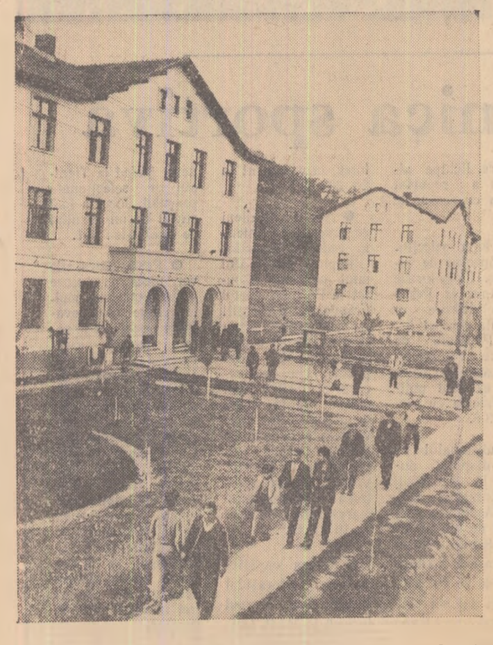
Iată un aspect din tînrul orașel Valea Caselor, regiunea Pitești, raionul Găești.