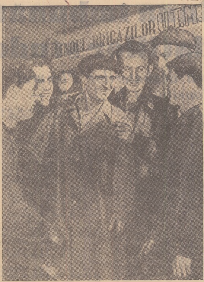
Un grup de tineri frunțași în producție din secția școlii și utilaj a Uzinei „Clement Gottwald” din Capitală. Ei au motive să fie veseli: au îndeplinit înainte de termen planul de producție pe luna octombrie realizînd totodată o economie de 1.200 kg. otel special.