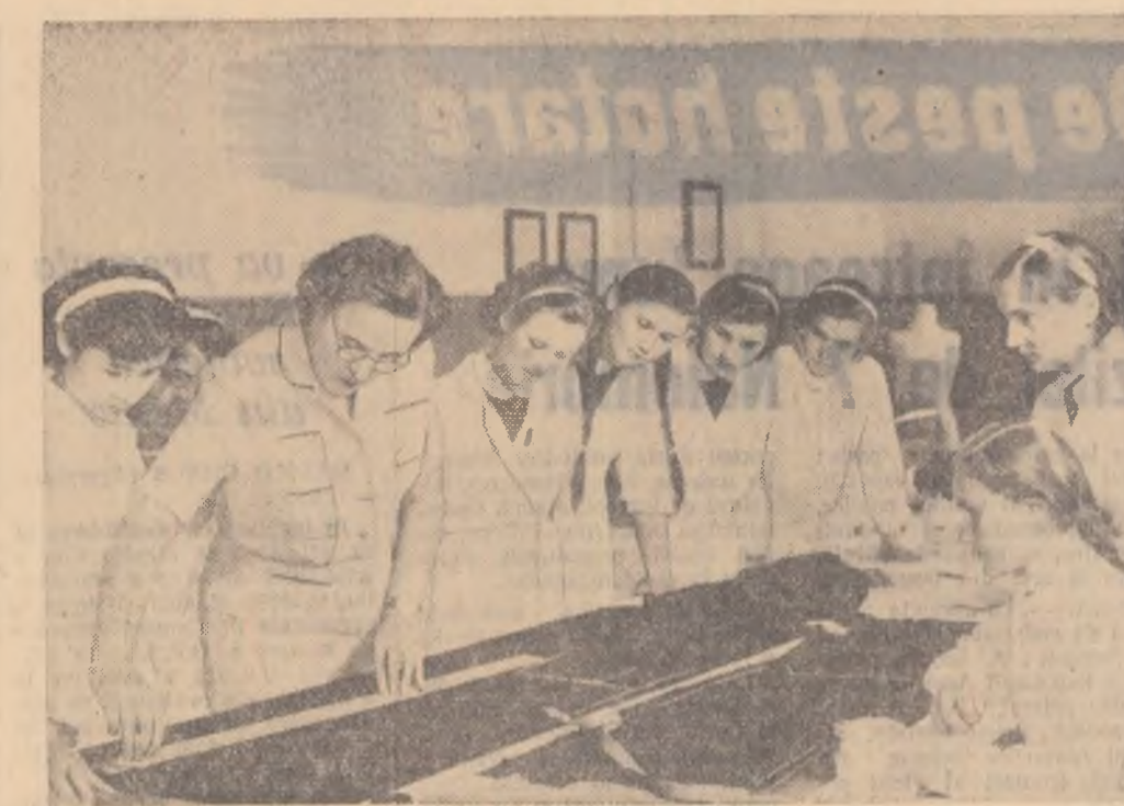
La Școala de meserii din Cluj elevule cu posibilitatea să se specializeze în diferite domenii. Iată pe elevule din anul III E la ora de croitorie.