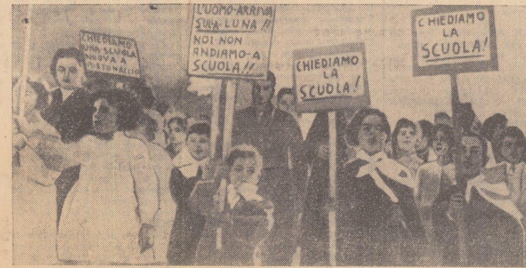
În Italia elevii au participat la numeroase demonstrații, cerînd îmbunătățirea condițiilor de învățămînt, un număr mai mare de școli. În clișeu: o manifestație la Roma.