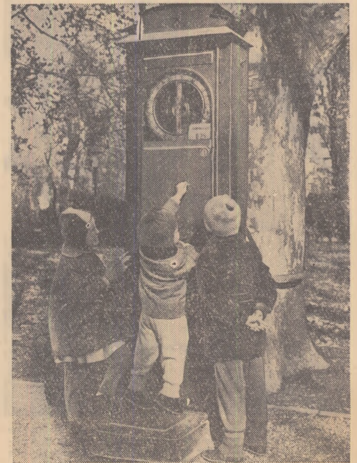
La cîntăritul celor mari prîslea a întîlnit o dificultate.