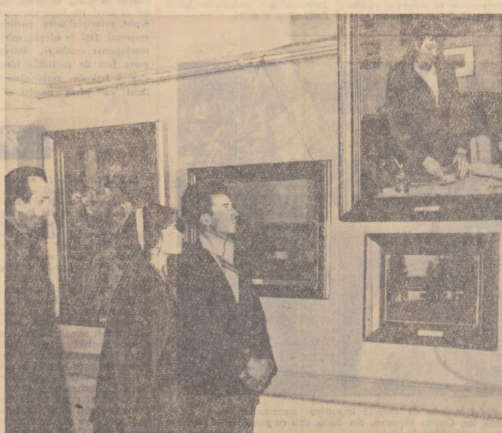
Tinerii vizitînd expoziția pictorului S. V. Gherasimov