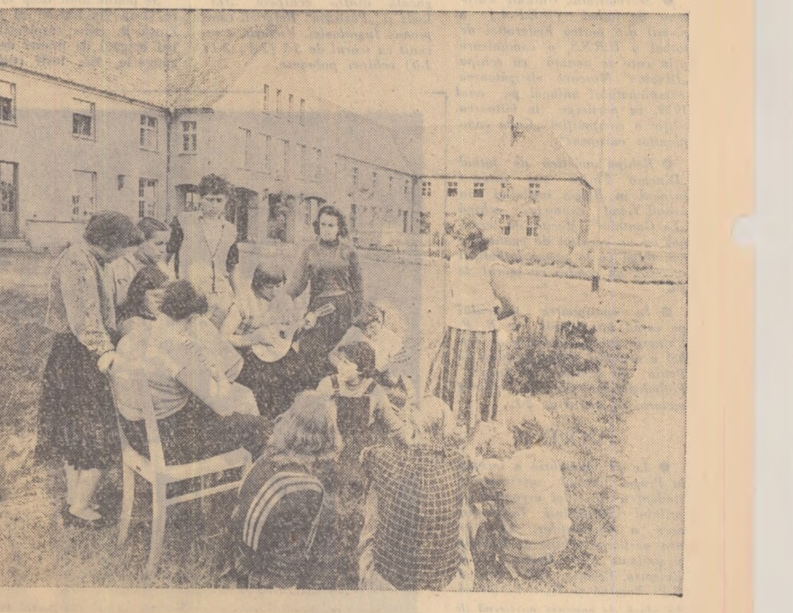
Un grup de ucenici de la Gospodăria agricolă de stat Kreiswaren (R.D.G.), într-un moment de destindere.