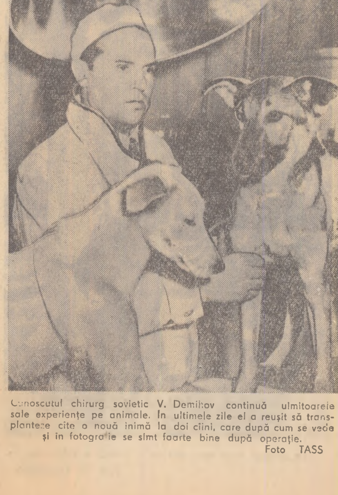
Conoscutul chirurg sovietic V. Demihov continuă ultimarele sale experiențe pe animale. În ultimele zile el a reușit să transplanteze cite o nouă inimă la doi cîini, care după cum se vede și în fotografie se simt foarte bine după operație.

tea ea va scădea pînă la minus 50 grade din cauza absorbției reduse a razei calde de către atmosfera marțiană. Noaptea, pe cerul lui Marte, se va putea vedea Pămîntul sub forma unei stele albastre foarte strălucitoare. Lîngă el se va vedea o stea mică, gălbuiă, mai puțin strălucitoare — Luna noastră. În afară de aceasta vom vedea cei doi sateliți ai lui Marte. Acești sateliți-minuscule, cu un diametru de numai 15 și 8 km., vor părea de pe Marte ca mici Lune. Este posibil ca înaintea „aterizării“ pe Marte, se va efectua un zbor în jurul lui Marte pentru stabilirea mai precisă a condițiilor care domnesc pe această planetă. Este posibil ca expediția să „aterizeze“ la început pe unul din sateliții lui Marte, de pildă, pe Phobos, pentru ca în 7 ore, în timp ce satelitul va face o rotație în jurul planetei, să examineze întreaga ei suprafață. Nu mai puțin interesant va fi și zborul spre Venus — o planetă enigmatică, înconjurată de un strat atît de gros de nori încît nu vedem niciodată suprafața ei. De aceea nu știm dacă, rîruri sau păduri, nu cunoscăm perioada exactă a rotației ei în jurul soarelui și înepmănia nău să ne dăm seama de situația polu-