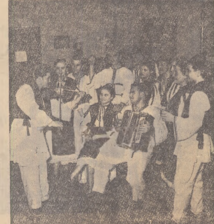
lata un grup de tineri din echipa artistică a Casei de cultură din Turda la o repetiție

● La Lodz s-a desfășurat meciul internațional de hochei pe gheață dintre echipele „Ikł” Lodz și „Partizan” Belgrad, campioana Iugoslaviei. Victoria a revenit cu scorul de 3-3 (2-2; 2-1; 1-0) echipei poloneze.