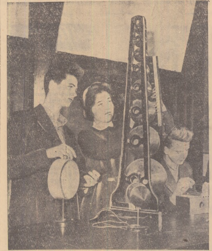
In laboratorul de fizică al Școlii medii nr. 4 din Orașul Stalin, elevii aplică practic cunoștințele teoretice însușite la orele de fizică.

ELENA NASTASE ericita in piele, Fabrica de încălțăminte „Nicolae Bălcescu”. București