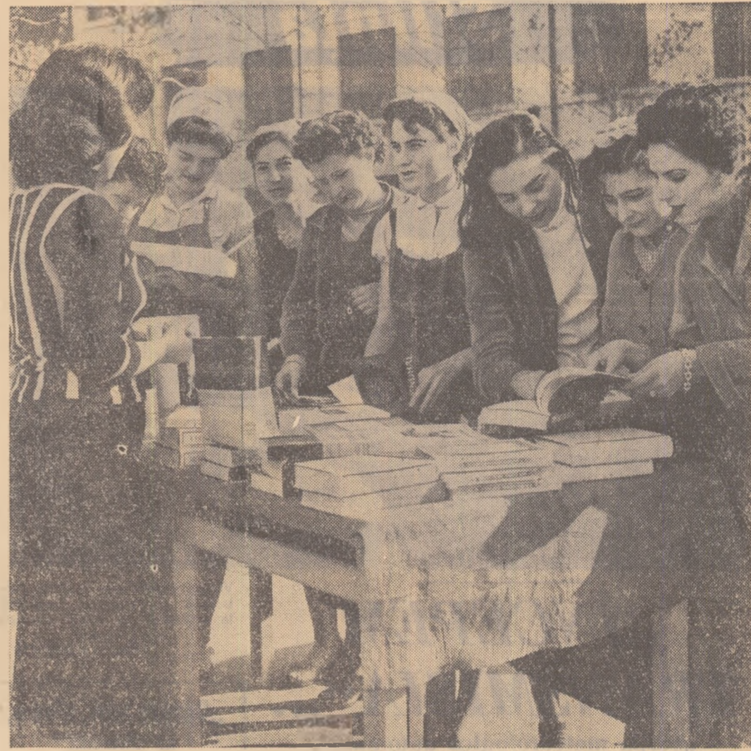
Înto un grup de tinere de la F.R.B., cumpărînd cărți de la standul de cărți aflat în incinta întreprinderii.