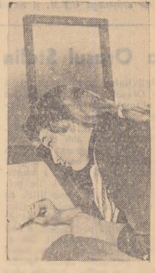
La școala de artă populară din Oradea învață și mulți elevi de la școlile medii și tehnice. Fotoreporterul nostru a surprins un aspect din timpul unei lecții la secția grafică.