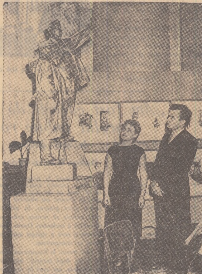
Cu ocazia Conferinței Internaționale a studenților pentru pace, care a avut loc la Praga, s-a deschis o expoziție de artă studențească la care a fost prezentată și această sculptură a lui Josef Cech, elevul maestrului Makovsky.

La biblioteca universitară din Praga s-a deschis expoziția „Studenții în luptă împotriva fascismului”. Un bogat material fotografic, cărți, diferite texte ilustrează lupta tineretului și studenților împotriva fascismului în timpul ocupației naziste precum și aportul lor astăzi la lupta pentru pace și colaborare pașnică între popoare.