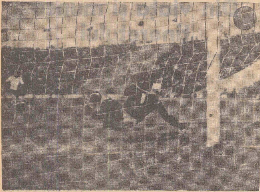
Spectaculoasa intervenția a portarului Mihalache (Minerul-Lupeni) n-a avut totuși darul să împiedice înscrierea unui nou gol (al șoptalea) în favoarea formației bucureștene Progresul