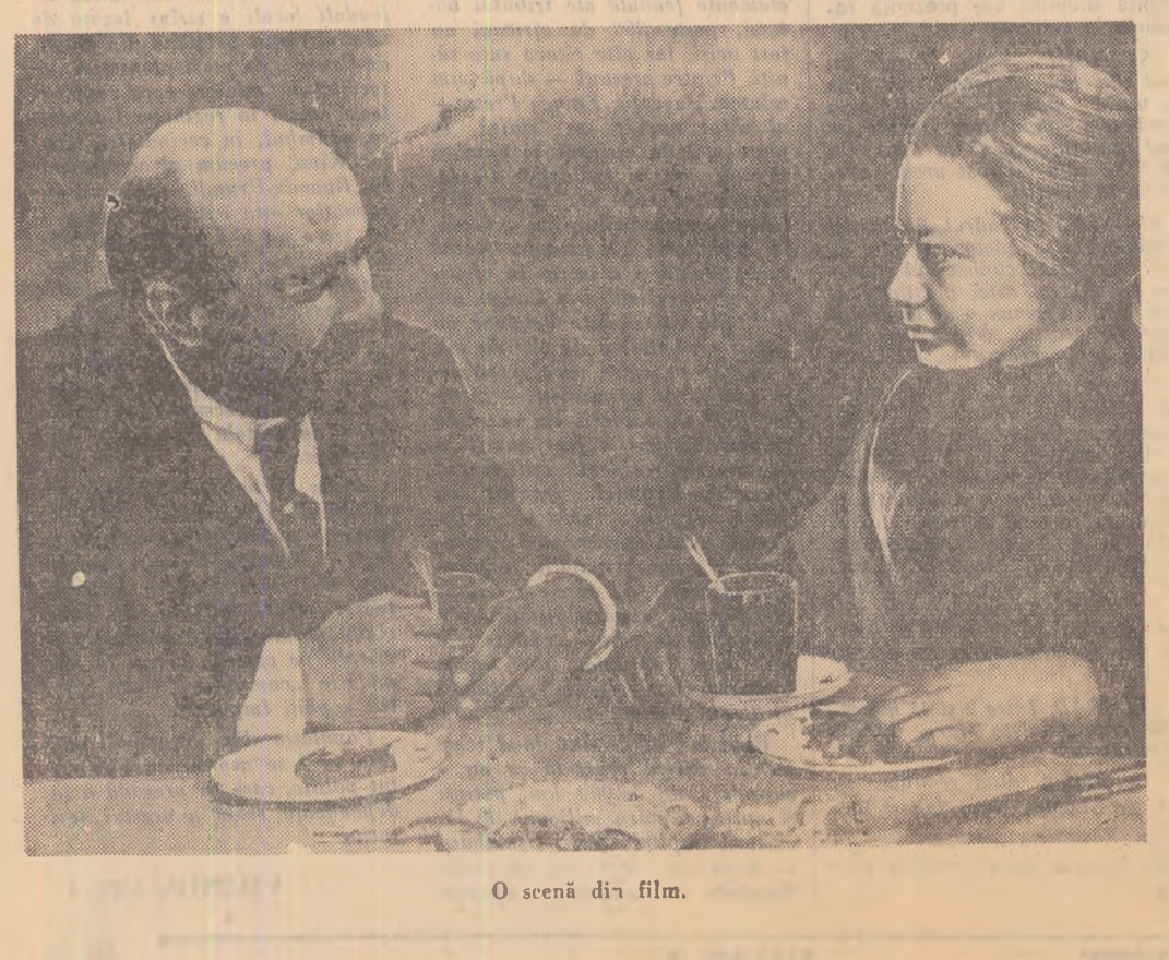
O scenă din film.

„Am fost cucerit de caldă primirea a generosului și marelui public român care mi-a lăsat o impresie din cele mai frumoase.”