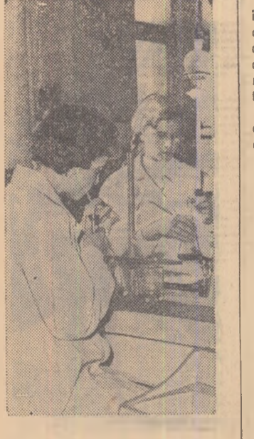
În laboratorul chimic al Uzinelor de tractoare „Ernst Thälmann” din Orașul Stalin.

Aceste trei cuvînta străvechi, de căldură intimă și de ospitalitate, s-au statornicit ca un „obicei al pămîntului” și în gospodăriile noastre colective. Ele au rămas acolo din ziua dinții a înființării, ca o neostovită invitație la prietenie, la cunoaștere și învățătură.