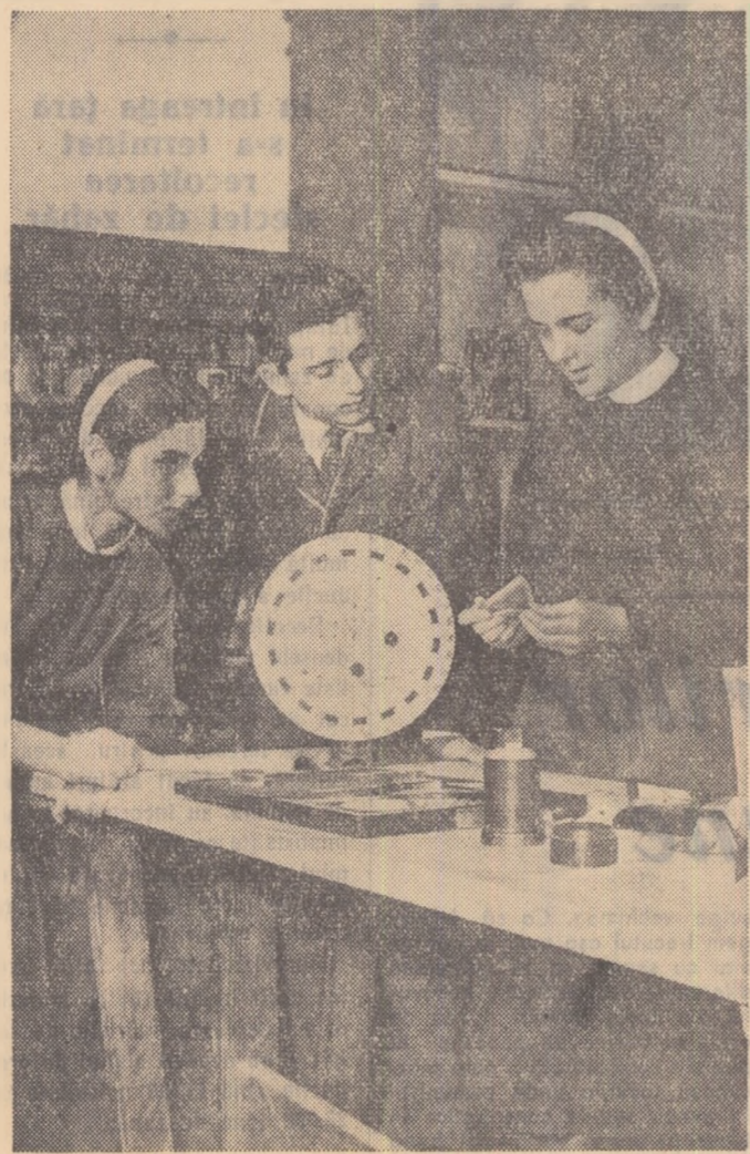
Una din grupele de învățatură de la Școala medie nr. 2 Pitești pregătind lecțiile la fizică.