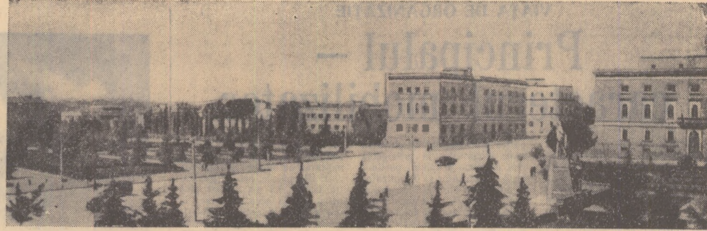
Locuințe noi pentru oamenii muncii din Tirana (R. P. Albania).

Reprezentantul sovietic I. I. Tugarinov a arătat că comisia O.N.U. pentru unificarea și relucerea Coreei contribuie prin înțelegerea sa activitate la crearea unui limbaj în problema unificării țării.