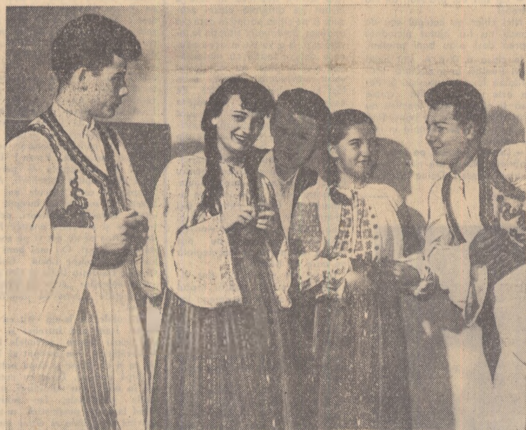
Un grup de tineri dansatori de la Școala de artă populară din Oradea.

Brigada utemistă de muncă patriotică nr. 16 de la Uzina „Mao Tze-dun”