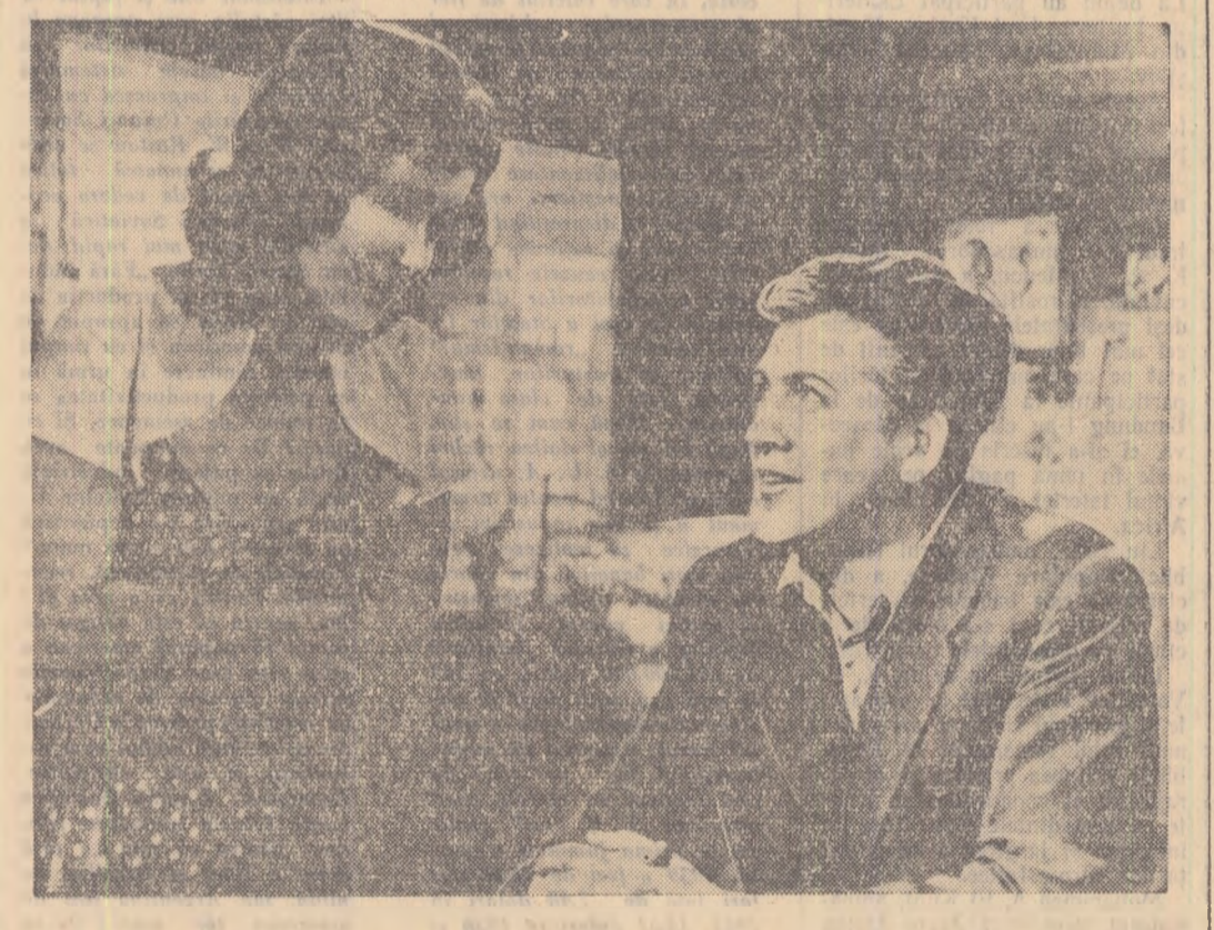
O imagine din film

Au fost de față reprezentanți al Ministerului Învățămîntului și Culturii, oameni de știință, muncitori, ingineri, tehnicieni, un numeros public.