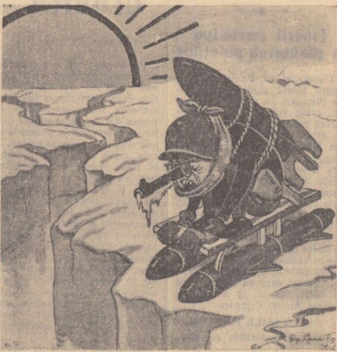
Deși iarna abea a început, pîrtia de sanie a devenit deja primejdioasă... (desen de B. EFIMOV din „Krokodil”)