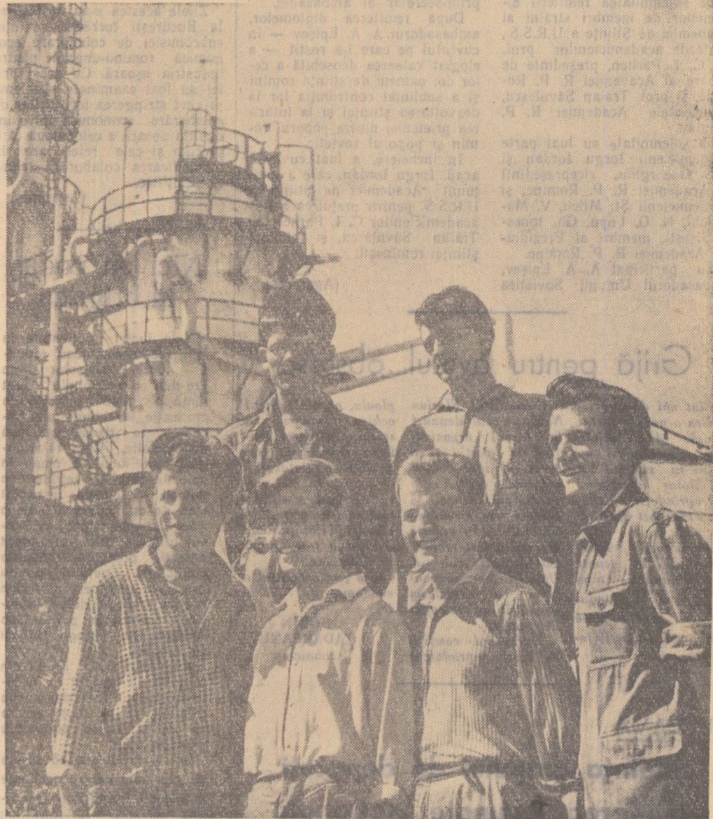
Brigada „Cea de-a 15-a aniversare a eliberării Albaniei” din cadrul Rafinării de petrol din Cerrik.

În aceste zile de sărbătoare, inimile tineretului nostru bat cu și mai multă putere pentru pace, prietenie, socialism. Acesta este drumul nostru. Pe acest drum merge poporul și tînăra generație a Albaniei.