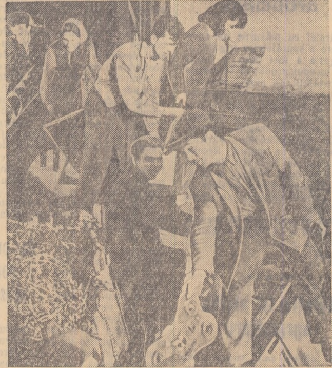
Și iată-i la muncă, încercînd fierul vechi.