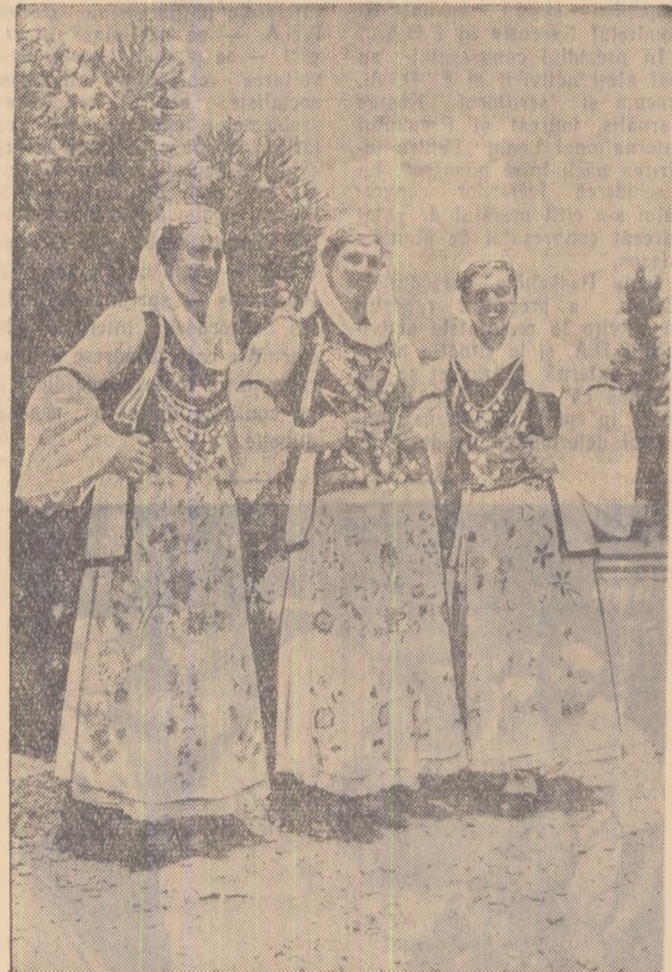
Tinere țărînel albaneze din Dropoll, în port național.