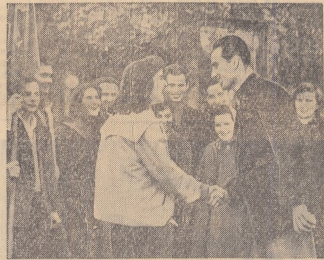
Un moment solemn: tinerii primesc carnetul roșu de brigadier.