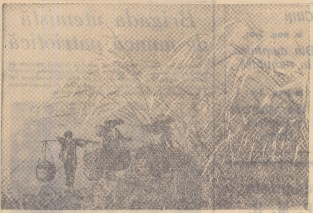
Orezul s-a copt.