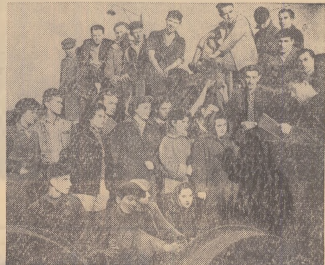
Membrii brigăzii, răspund chemării tinerilor craioveni: 600 ore muncă patriotică la canalul Porcaea, colectarea a 40.000 kg. fier vechi.

Deunăzi, am făcut cunoștință cu membrii brigăzii utemiste de muncă patriotică, din secția utilaj a Uzinelor de vagoane „Gheorghe Dimitrovi”, din Arad. Această familie doboșbit de numeroasă (40 membri) este cunoscută în întreg orașul Arad, pentru activitatea sa prodigioasă, multilaterală. Dar să vi-i prezentăm.