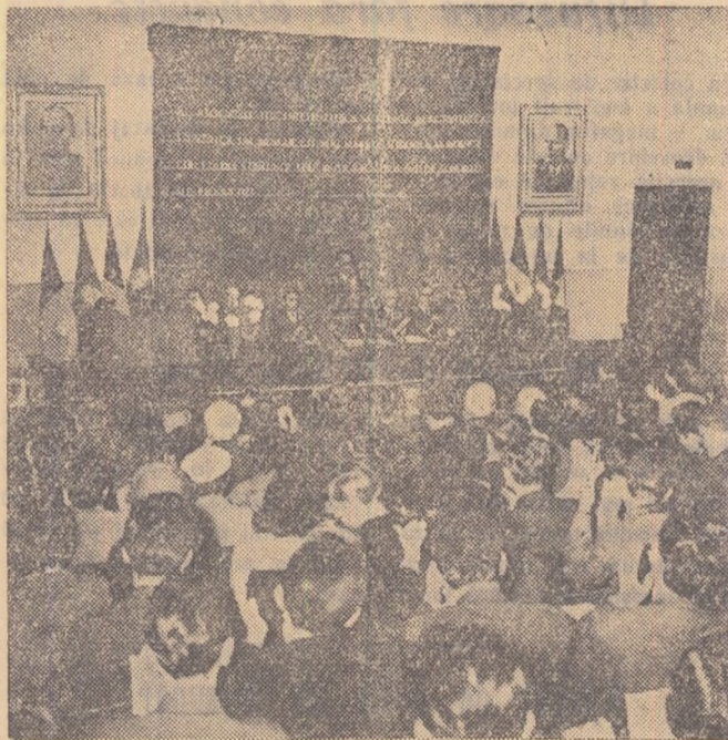
În fotografie: un aspect de la deschiderea lucrărilor seminarului național științific studențesc din Capitală