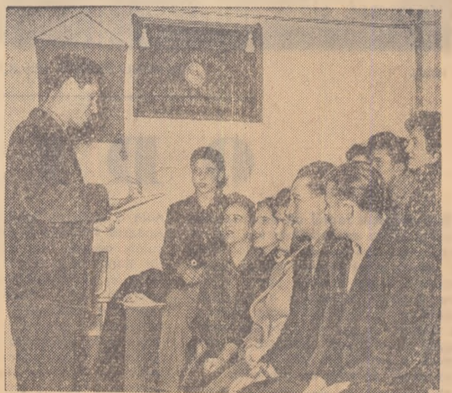
Într-un moment de repaus tinerii învață un cîntec patriotic.