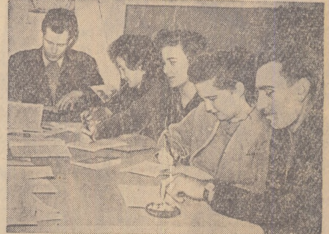
Tinerii din brigada utemistă de muncă patriotică sînt în același timp și membri ai cercului politic