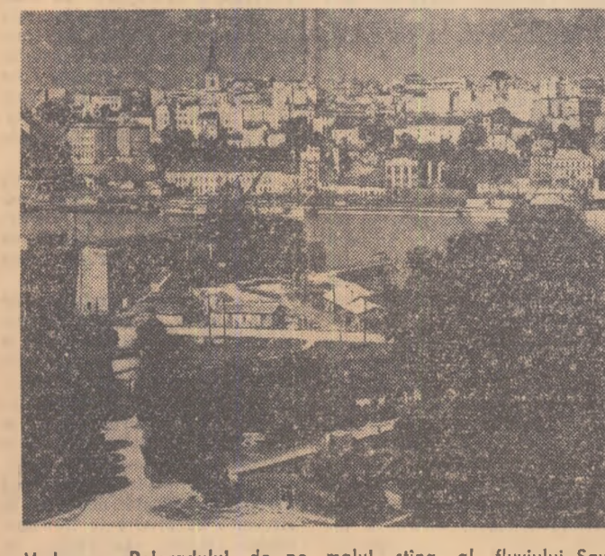
Vedere a Belgradului de pe malul stîng al fluviului Sava