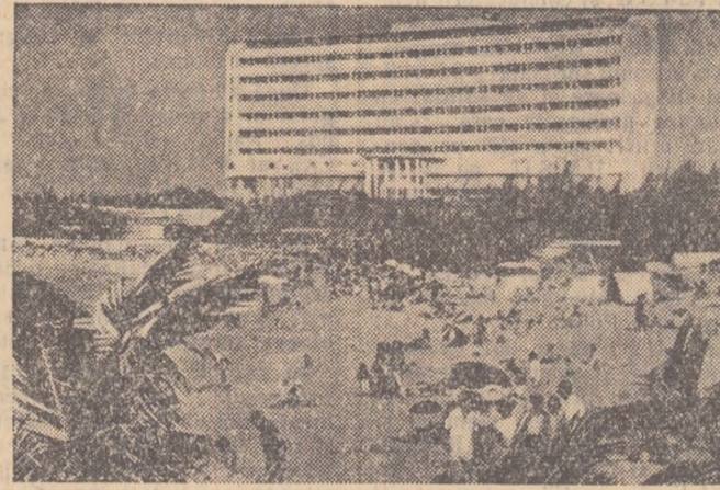
Imagini din Africa. Stînga: Aci se lăfăiesc colonialiștii. Dreapta: Aci locuiește, în sate mizere, populația africană.

Vicleanul minel populare din Africa conținut să erupă. De cîteva timp apar zilnic în orele telegrame care anunță: „Tulburări în Nyassaland”, „în Rhodezia au loc ciocniri între trupele coloniale și populația băștinașă”, „Alarmă în Somalia” etc. Agenția Reuter anunță de curînd că în unele orașe din colonii, băștinașii au devastat clădirile tribunalelor și închisorilor, eliberînd pe deînjulii politici. În provincia