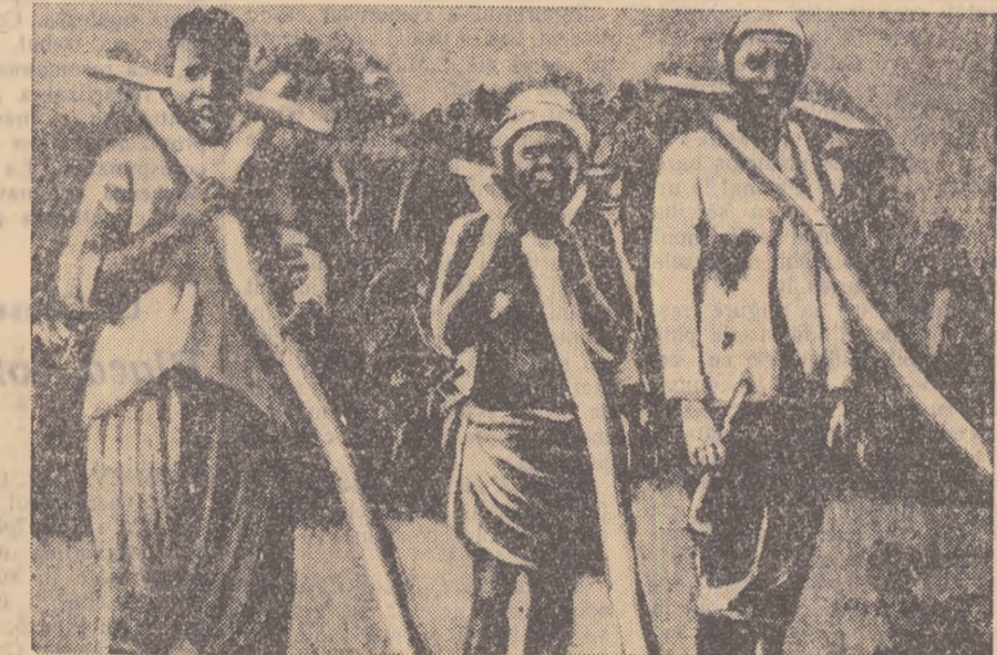
Țărani din Africa Ecuatorială franceză pedepșiți să poarte Jugul de git pentru neplata impozitelor.

Vreme de sute de ani, colonialiștii au tăiat și spînzurat în Africa instaurînd rînduiri sîngerose, jefuînd și exploataînd nemilos, călcînd în picioare cele mai elementare norme morale ale speței umane. Aceasta o făceau în calitate de „reprezentanți ai înaltei civilizații occidentale”.