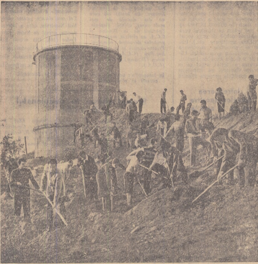
Tinerii aceștia sînt studenți la Institutul agronomic „Tudor Vladimirescu” din Craiova. Ei lucrează voluntar la șantierul grădini botanice din oraș.

În căminul nr. 1 al Universității „C. I. Parhon”, unde cele mai multe camere sînt curate, iată că e nevoie să se facă puțină curățenie și în atitudinea unor studenți în mișcarea care se întretăie și se înlecește tot soiul de linii spontane ale boemiei. E datorită utemistilor, a comitetului de cămin, a masei de căminiiști. IGOR ȘERBU