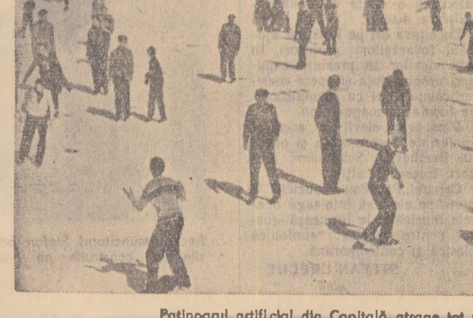
Patinoarul artificial din Capitală atrage tot mai mulți tineri.

Sînt spre pildă unele regiuni ca Baia Mare, Hunedoara care deși au condiții bune pentru atragerea unui mare număr de tineri la practicarea schiului se mulțumesc însă cu un număr destul de redus de schiori.