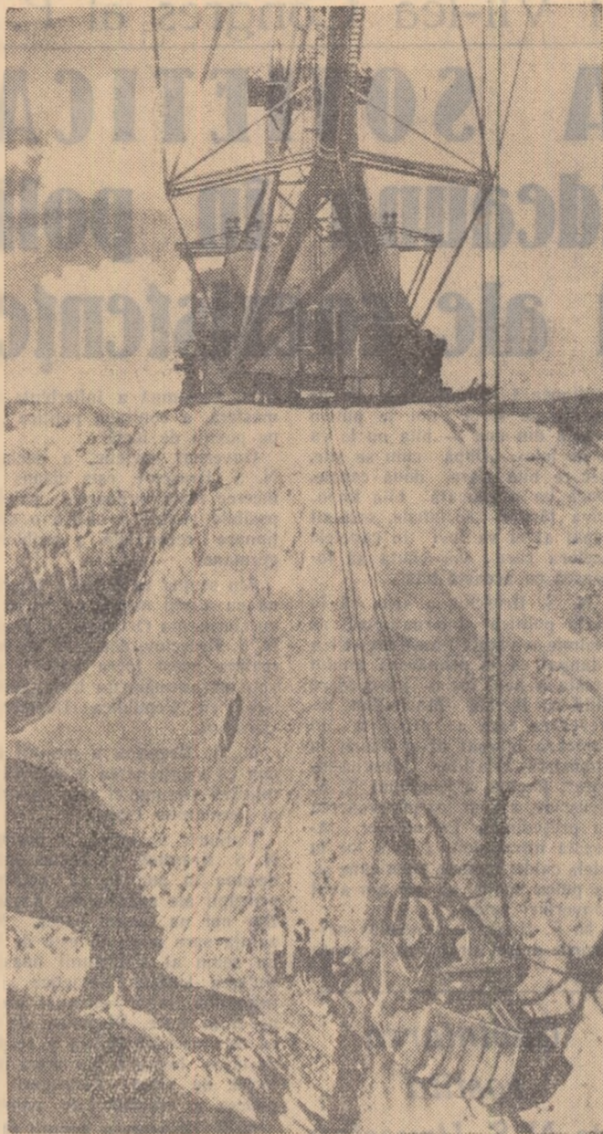
Escavatorul pășitor de KULEV POVSCHI (U.R.S.S.). (Fotografia a fost expusă la cel de-al II-lea Salon Internațional de Artă Fotografică al R.P. Romîne).