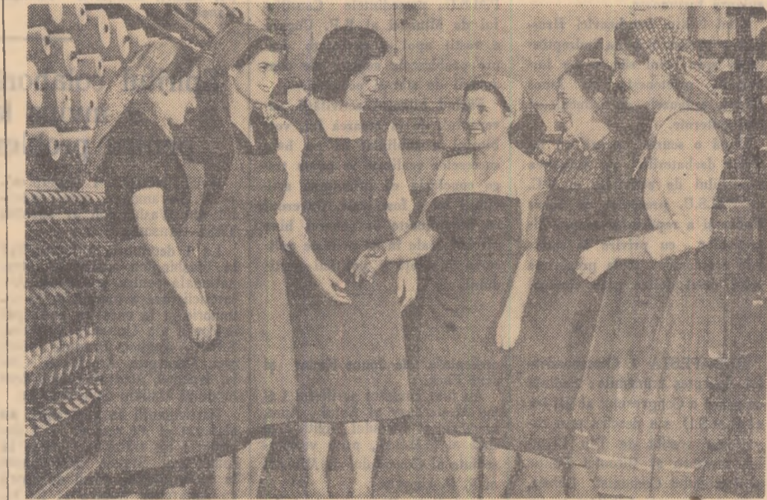
Brigada de tineret nr. 21 din secția rîsucă în Întreprinderii textile „11 Iunie” din Pitești este una din brigăzile fruntașe. În fotografie: o discuție între fetele din brigadă înainte de începerea lucrului.