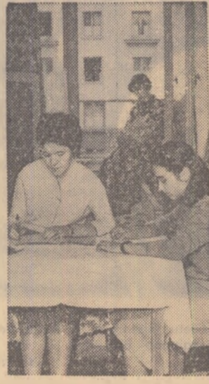
Un aspect din căminul studentesc al Institutului politehnic din Galați.