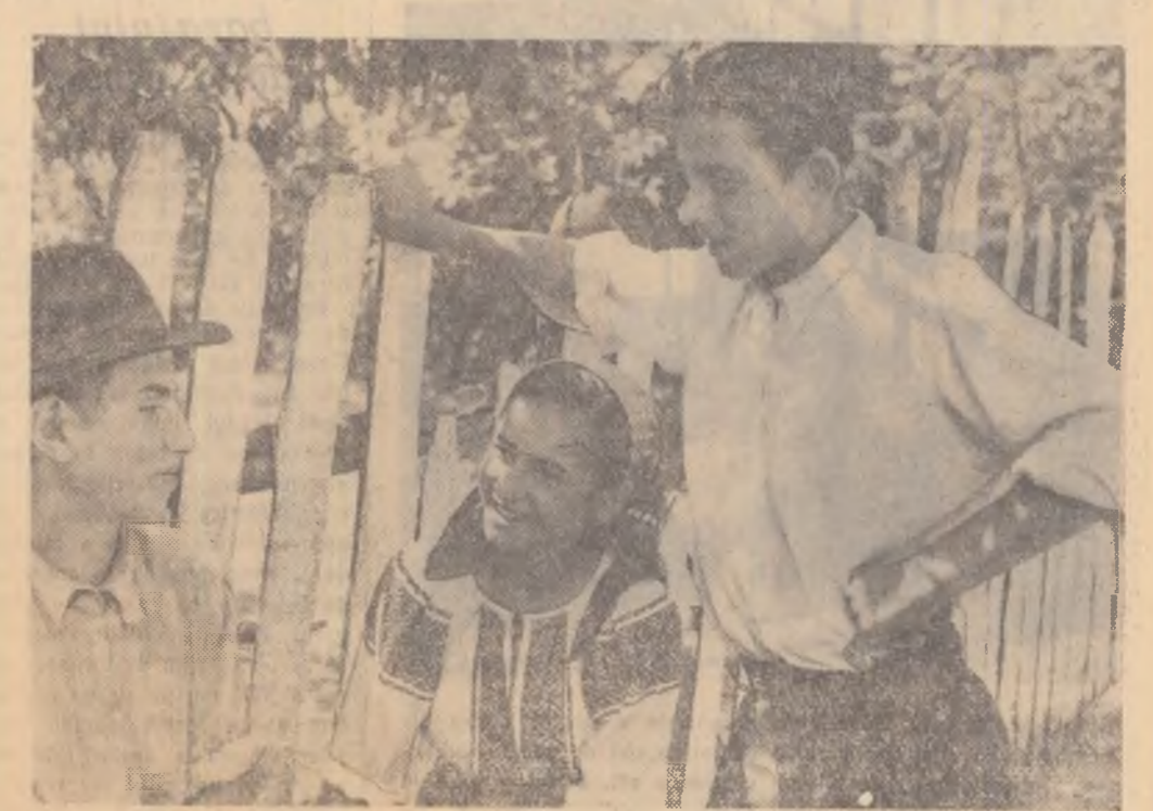
În zi de sârbătoare, clișiva tineri de la G.A.C. „Zorile socialismului” din comuna Golac, raionul Rostiori de Vede stau de vorbă, veseli, în fața casei.