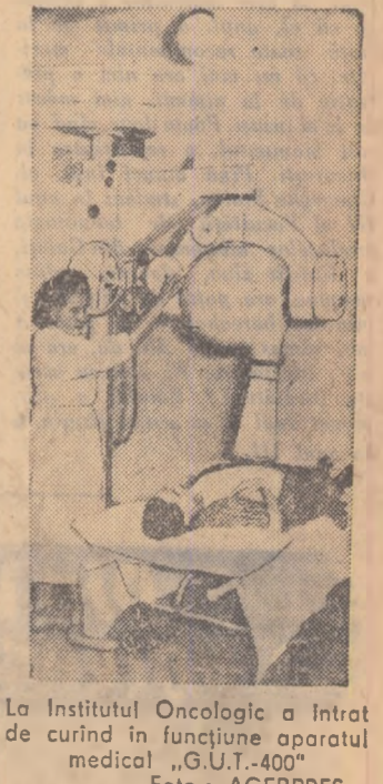
La Institutul Oncologic a intrat de curînd în funcțiune aparatul medical „G.U.T.-400”

CITIȚI PAGINA „Din viața universitară” cu titlul: „STUDENTIA — ucenicie a științei”