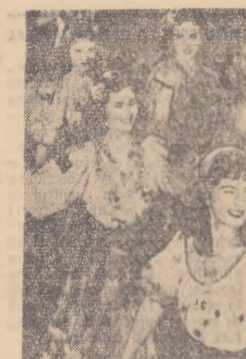
Dans țigănesc de FERENC BARTOL (R. P. Ungară)

Mamă eroină, deputată în Statul popular al Capitalei