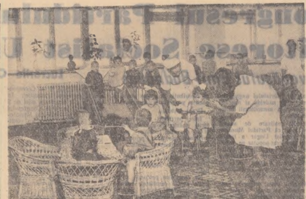
La Casa copilului din Craiova

În ultimul timp grija sfaturilor populare au fost aduse importante îmbunătățiri proiectelor pentru a asigura condiții cât mai bune de confort și un preț de cost redus.