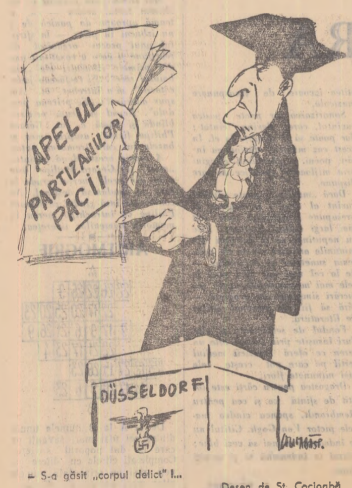
S-a găsit „corpul delict”!... Desen de Șt. Cocioabă

Bolnand, președintele Adunării Generale a O.N.U. Day Hammarskjöld, secretarul general al O.N.U., mulțumind pentru darurile transmise a spus: „Ziua din octombrie 1957, cînd a fost plasat pe orbită primul satelit artificial al Pământului a însemnat începutul unei noi epoci și în relațiile internaționale.”