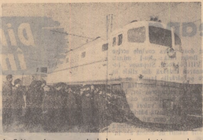
La Pekin au fost expuse primele locomotive electrice moderne produse cu titlul de încercare de industrie chineze.

Autoritățile au anunțat că a fost deschisă o anchetă pentru stabilirea răspunderii în această dezastru — care este considerat de agenția France Presse drept cel mai grav din ultimii ani în Franța. În întreaga Franță au fost deschise liste de subscripție pentru victimele catastrofei de la Fréjus.