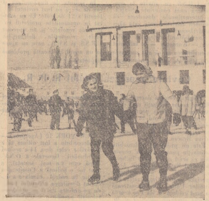
Primii pași pe gheață pe patinoarul artificial din Capitală.