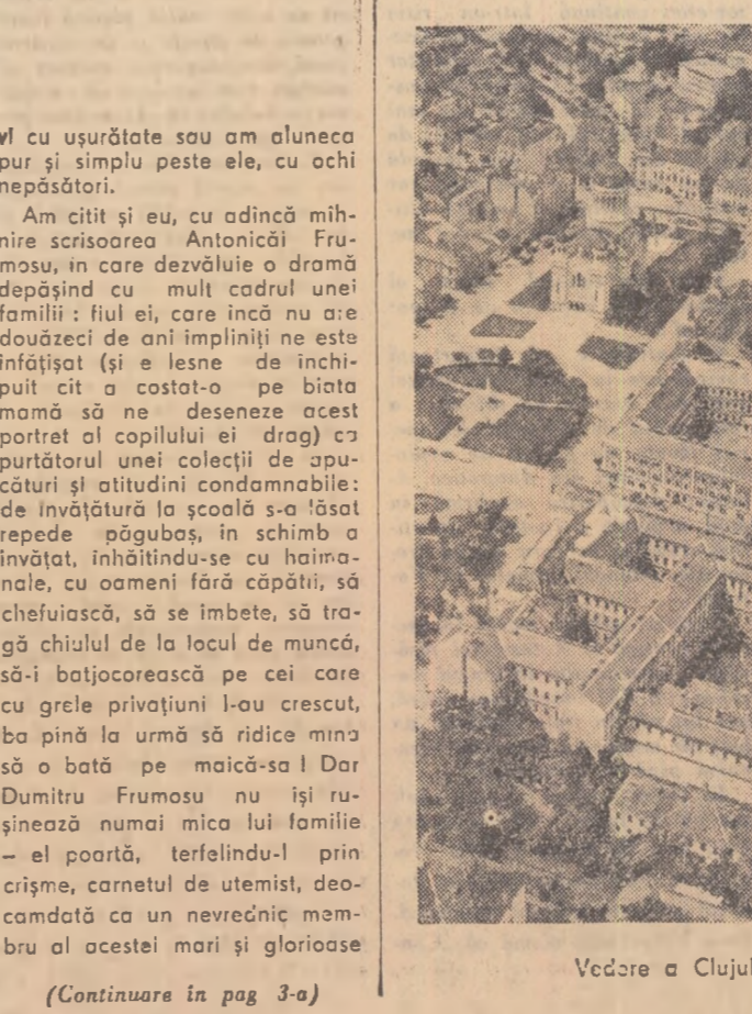
Vedere a Clujului luată din avion.