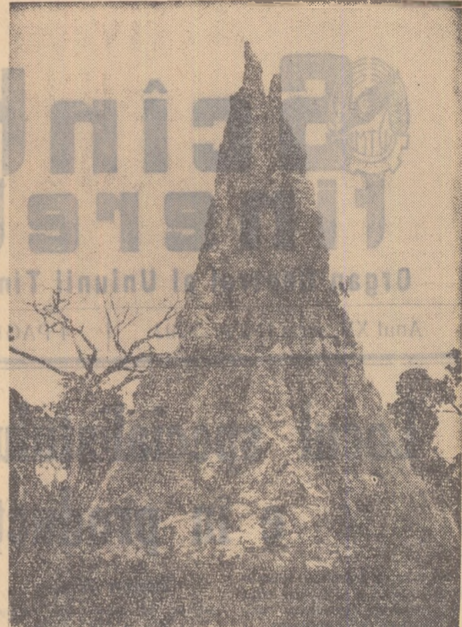
O stîncă în mijlocul cîmpiei? Un monument original creat de mîna omului? Nicidecum. Un autentic peisaj exotic des înfîlțit pe meleagurile Africii: un cuib de furnici albe.

„Sursa și propagatorul acestui fenomen este chiaburul... care nu-și mai poate exercita puterea asupra oamenilor... (și care) încearcă să trezească în om amintirea oamenilor trista legendă a unui creator și stăpîn al Universului, adică folosind un basm învechit să reînvie instinctul de proprietate. Trăsătura caracteristică a noilor „credințe religioase“ este faptul că ele nu-și au obșirba în misticismul formelor cultului, în acceptarea sau respingerea dogmelor și ritualurilor bisericești... își propun drept scop să se împotrivescă acestei realități“ (noi — nota ns.) „Hristos ne-a oprit să murim în zilele de sărbătoare — propovăduiesc acești noi apostoli fără să știe seama că, potrivit evangheliei, Hristos a neșocotit sărbătorile. În genera, predicile lor par să se rezume la acest unic scop: să nu muncim și nu numai de sărbători, dar și nu mai puțin mîndoclat pe lucru, ca să subminăm opera de construire a lumii noi. Dogmatismul mistic se transformă într-o politică contrarevoluționară și, pentru un scriitor, asta constituie un material deosebit de interesant.“