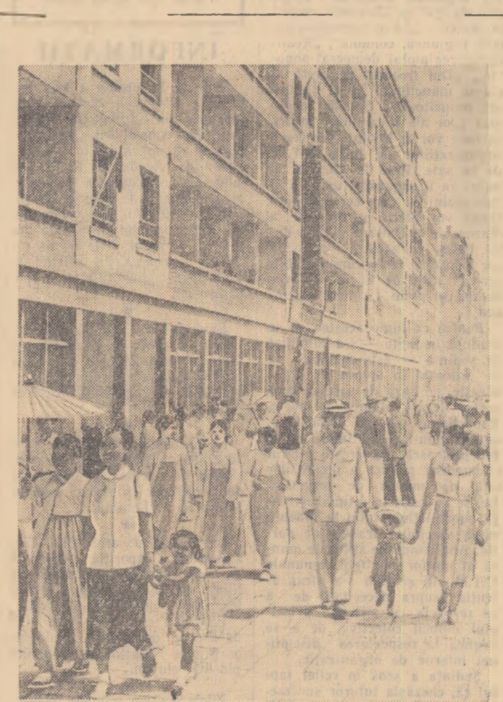
Instantaneu din Phenian.

„În vremurile noastre, a spus N. S. Hrușciov, „comunismul nu este o noțiune abstractă, ci o operă concretă făcută de sute de milioane de oameni care pașesc pe drumul marxism-leninismului”.