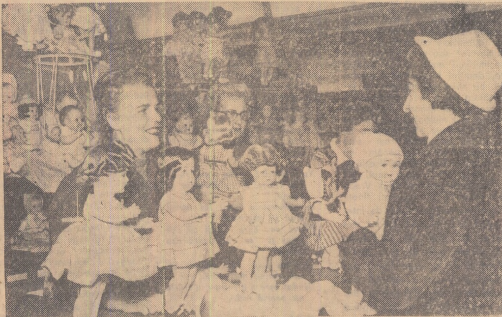
Animație neobișnuită în preajma sărbătorilor de iarnă, în magazinele de jucării din Berlinul democratic.

BUENOS AIRES 12 (Agerpres). — Agenția „Prensa Latina” a anunțat că în Paraguay a izbucnit o răscoală îndreptată împotriva regimului dictatorial al generalului Alfredo Stroessner. Polvitură acestei știri, grupuri de răsculați apăsă în prezent în mai multe regiuni din Paraguay și în special în apropiere de orașul Encarnacion, pe fluviul Parana și în faza orașului de frontieră argentinian Posadas. Localitățile paraguayene Villa Capitan Bado, Bella Vista și Querlo Izguazu ar fi căzută în mâinile răsculaților care continuă înaintarea spre interiorul țării. Posturi de radio clandestine ale răsculaților afirmă că a fost formată o armată de eliberare condusă de Juan Jose Rottella și Nario Steche.