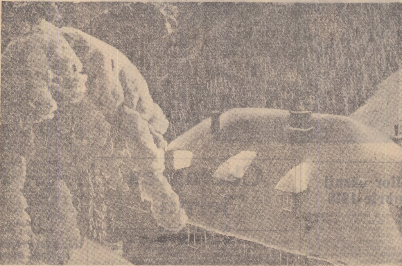
Cabana ne cheamă...

În legătură cu sarcinile care revin organizațiilor U.T.M. și asociațiilor sportive în organizarea activităților sportive de iarnă pentru tineret