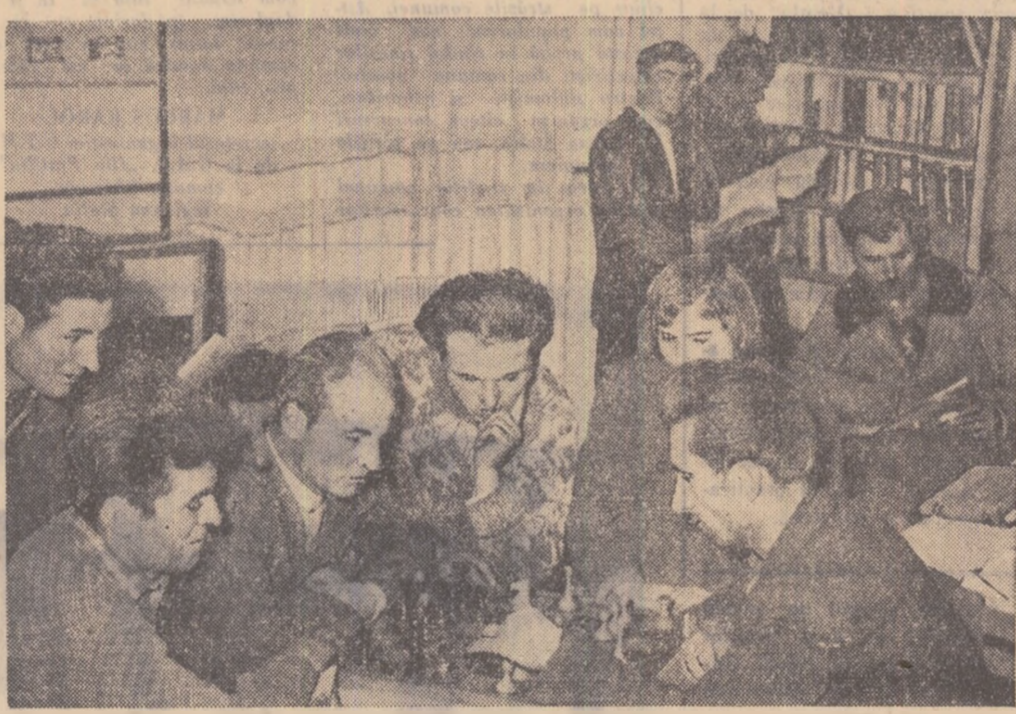
După o zi de muncă pe tractor, tinerii mecanizatori de la S.M.T. Chimoglu, regiunea Constanța, petrec alături de tinerii colectivști din Comana, clipe plăcute la clubul gospodăriei colective, pe care o deservește.