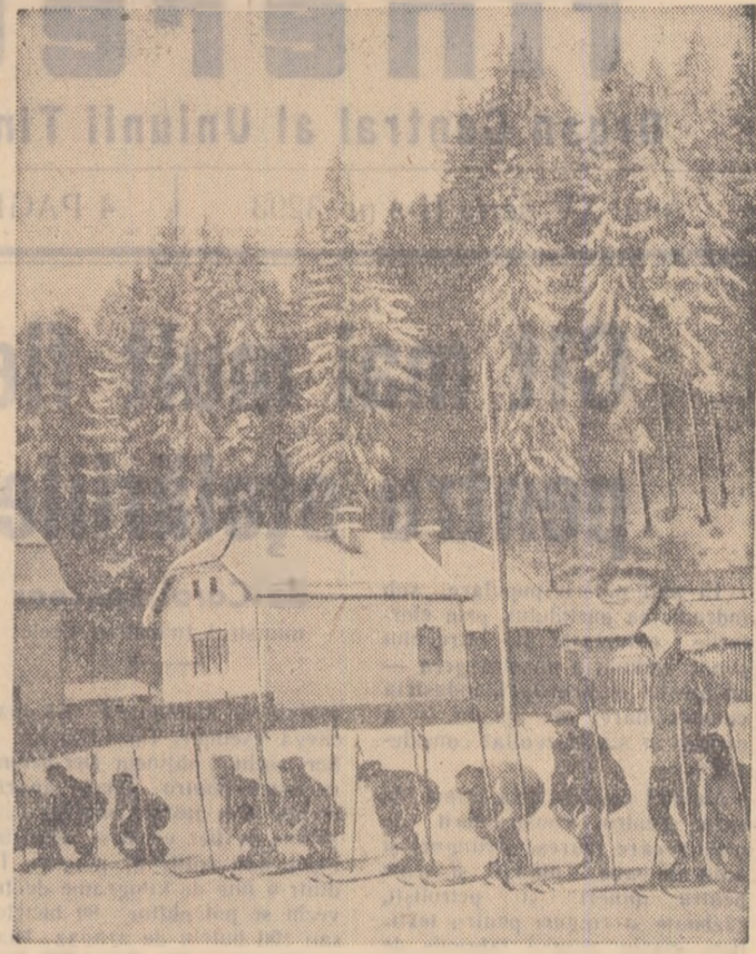
Tinerii din Tușnad, la startul unei întreceri de schi.