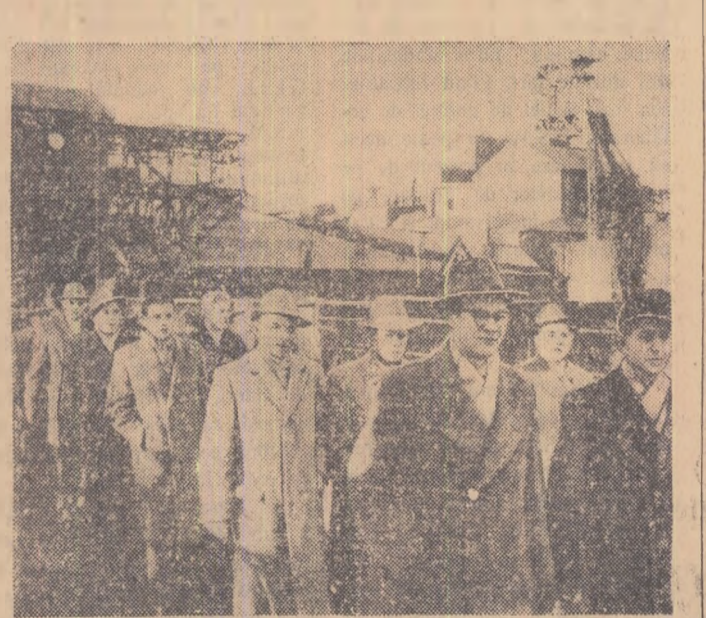
Aspect de la o demonstrație de protest care a avut loc recent la Bochum-Wiemelhausen împotriva închiderii unei mine din R. F. Germană și a concedierii minerilor.

O echipă de dansuri a interpretat o suită de dansuri populare românești. Cu această ocazie a fost organizată și o mică expoziție cu obiecte de artizanat și publicații românești.