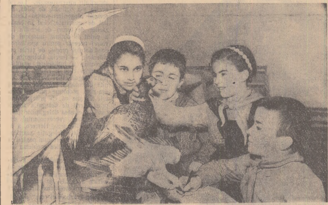
După ora de zoologie, un grup de elevi din clasa a IV-a A a Școlii medii nr. 37 din Capitală recapitulează în mod practic cele învățate.