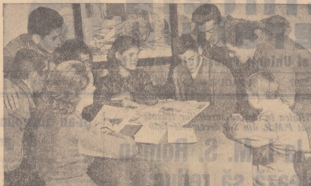
Sărbătoarea majoratului este întîmpinată de tinerii de 18 ani din comuna Biled, raionul Timișoara cu emoție și mîndrie. În fotografie: tineri colectivști la „Colțul majoratului”.