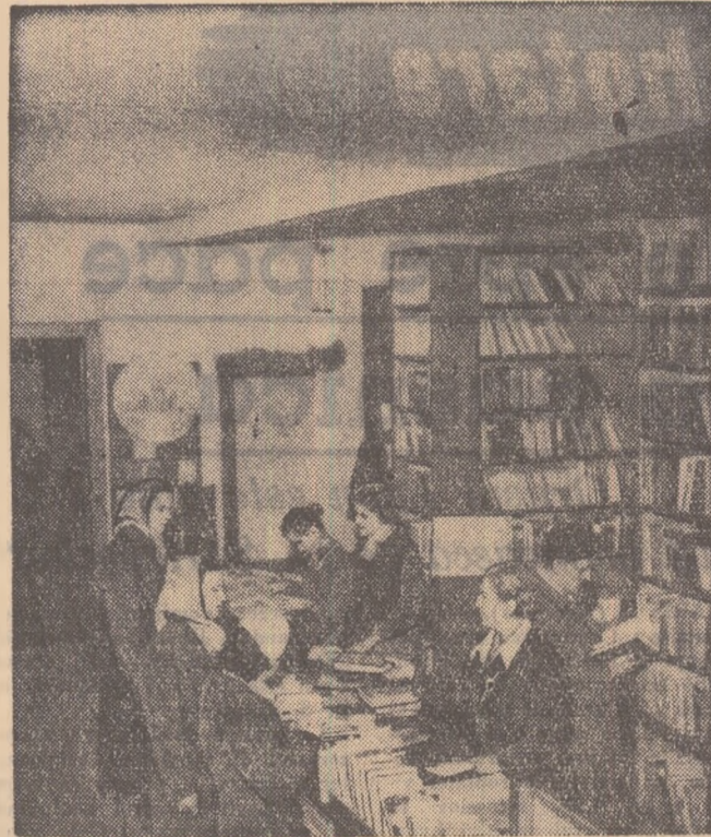
Biblioteca Uzinelor „Janos Herbak” din Cluj a fost vizitată numai în luna noiembrie de peste 3.000 de salariați ai uzinei, care au împrumutat un număr de aproape 6.000 de volume. În fotografie: un aspect din bibliotecă.