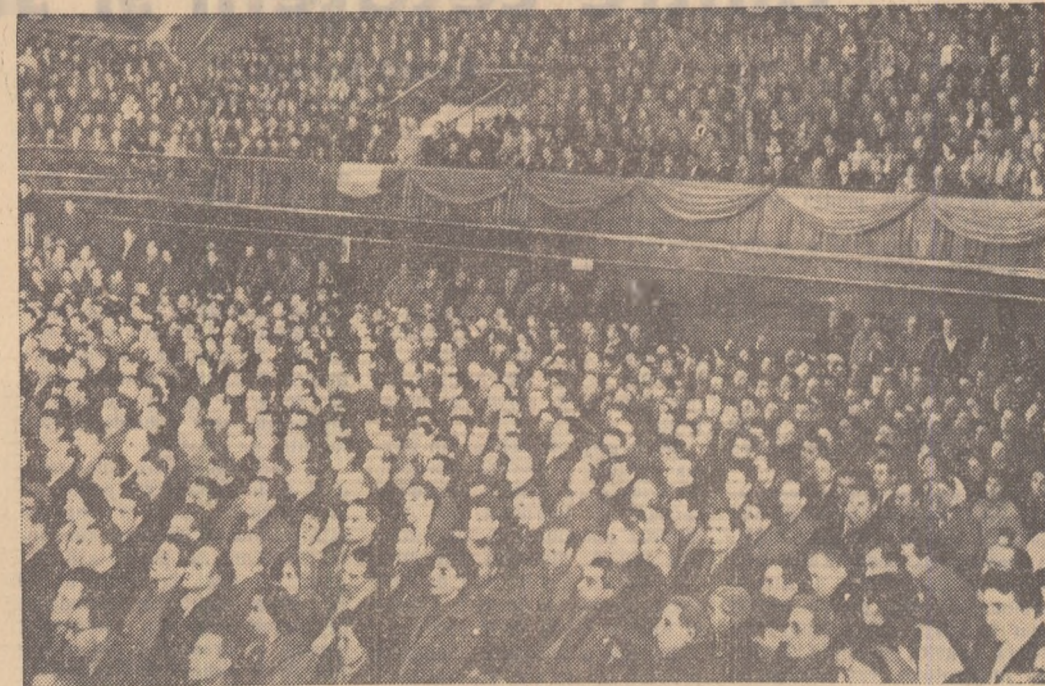
Citiți în pag. a III-a cuvîntările rostite la miting