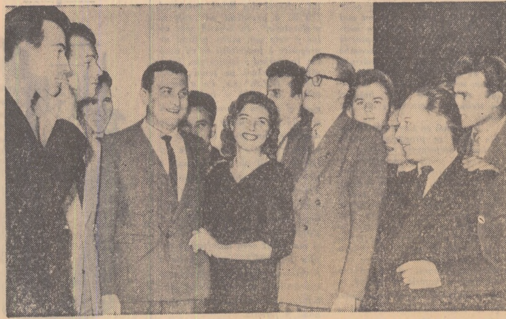
Un aspect de la întîlnire