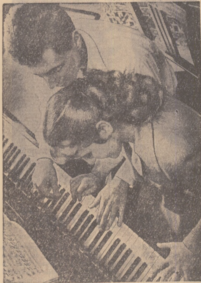
„LA PATRU MIINI”.