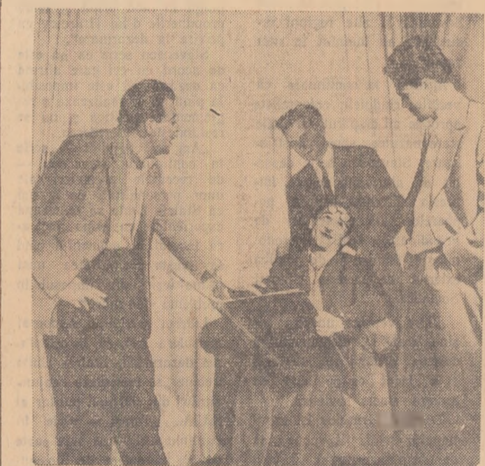
Scenă din plesă „Zăriștii” de Al. Mironan interpretată de un grup de studenți al Facultății de medicină din Timișoara.

Titlul informației apărută în rubrica „Din viața și munca tineretului” din nr. 3297 al ziarului se va citi corect: „Ansamblul artistic U.T.M. la Uzinele metalurgice „Grivița”.