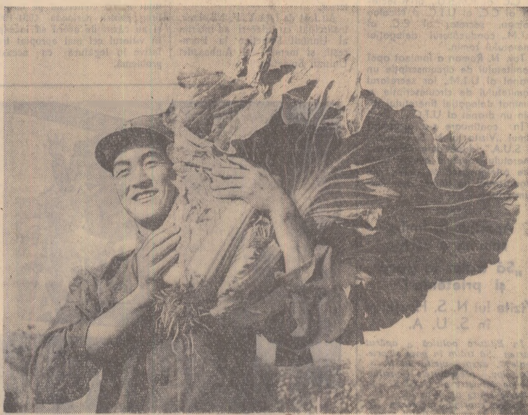
O varză uriașă recoltată în provincia Sandun (R.P. Chineză)