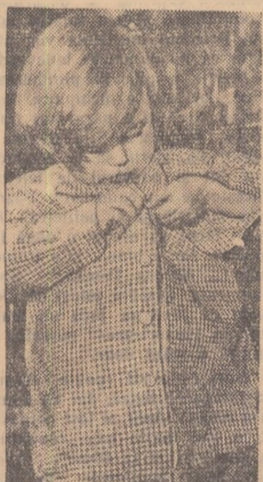
TREABA GREA. Fotografie de Ferenc Bortol - R. P. Ungară - (Din Salonul internațional de artă fotografică al R. P. R.).