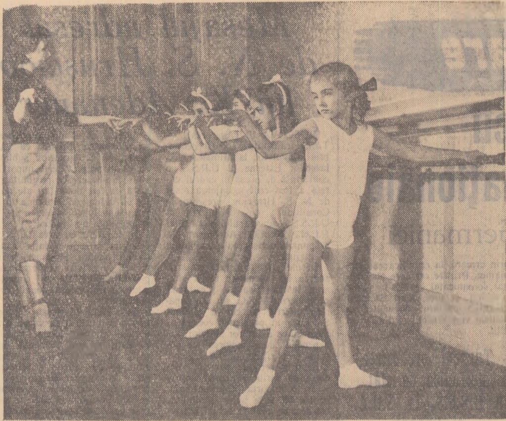
80 de copii între 5 și 12 ani frecventează cercul de balet de la Casa de cultură a Sindicatelor din Bala Mare.