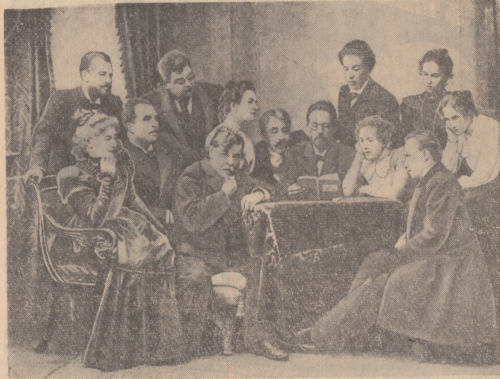
La 29 Ianuarie se implinesc o sută de ani de la nașterea lui A. P. Cehov. Fotografia de față n-l prezintă pe marile scriitor rus în mijlocul unui grup de artiști de la Teatrul de Artă din Moscova cînd pînea sa „Pescărușul”.